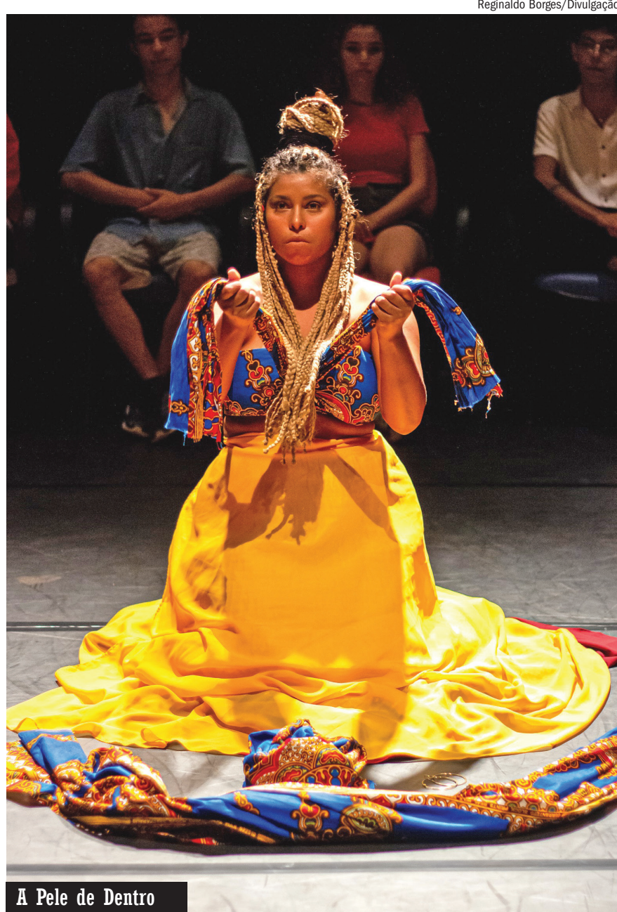
A Pele de Dentro

Uma verdadeira imersão ao Mundo DC, o parque indoor da