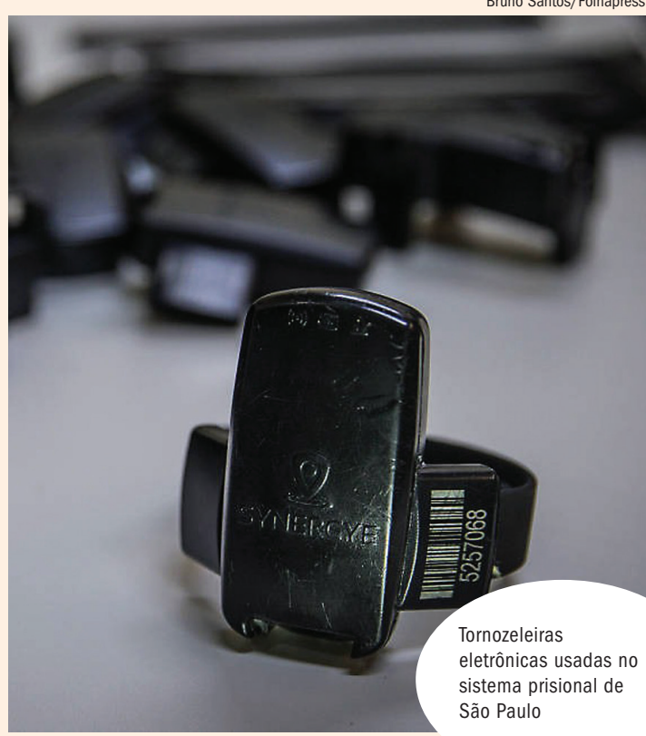
Tornozeleiras eletrônicas usadas no sistema prisional de São Paulo

Os estigmas se combinam a outros componentes que direcionam o problema a classes específicas no país. Um deles é a prevalência recorde de pessoas negras entre o público privado de liberdade no Brasil, que chegou a 68,2% do total. A maior parte é jovem, na faixa etária de 18 a 29 anos (43%).