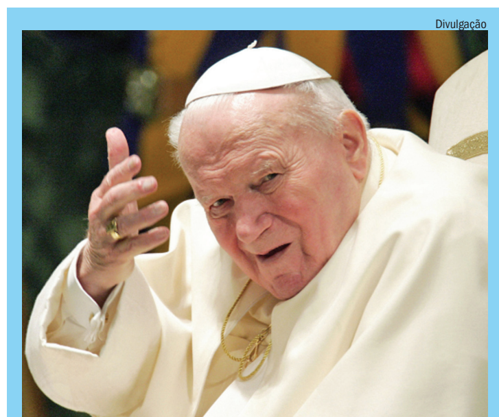
Querido São João Paulo II, abençoe nossa sexta-feira, nosso fim de semana e nos proteja de todo mal!