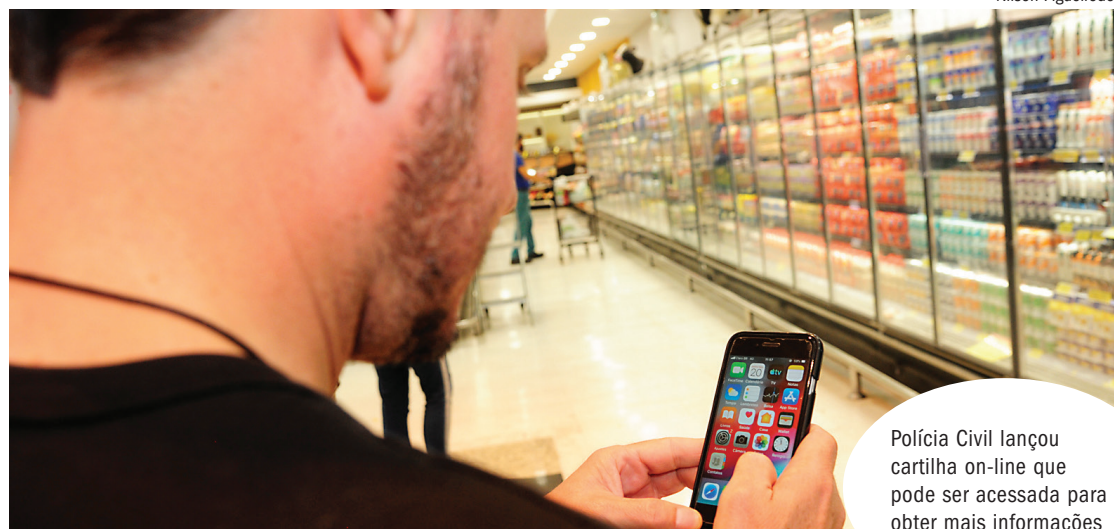
Polícia Civil lançou cartilha on-line que pode ser acessada para obter mais informações

Cabe destacar que não constam no banco de dados da Sejusp estatísticas específicas de golpes on-line, extorsão ou