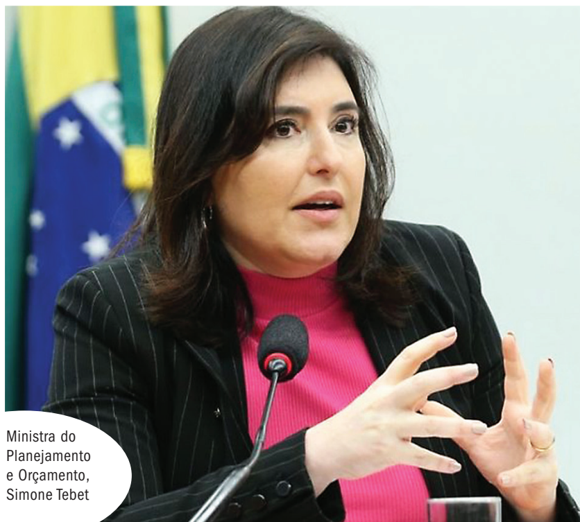
Ministra do Planejamento e Orçamento, Simone Tebet

Ainda de acordo com o profissional, a mudança indica que o governo, primeiro, está tentando se organizar. “Tudo indica que o governo está tentando se organizar em 2024, para colocar essa medida em vigor em 2025. Não vai ter como deixar de ter arrecadação de recursos no ano de 2024, em função de alguns compromissos que por