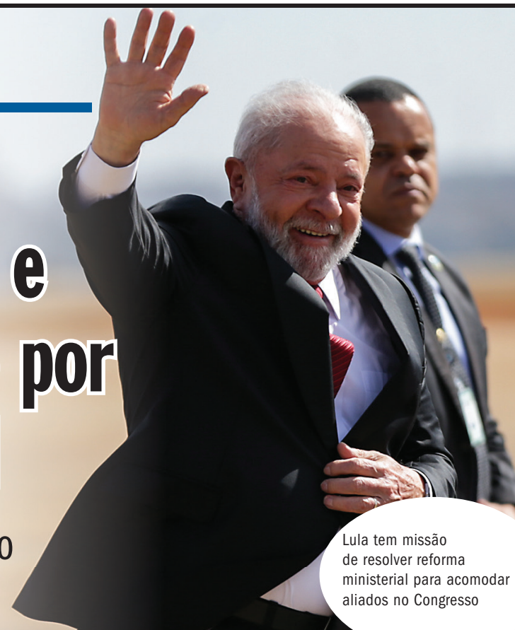
Lula tem missão de resolver reforma ministerial para acomodar aliados no Congresso

Aliados de primeira hora do presidente reconhecem que será necessário cortar “na carne” para abrigar os deputados do centrão. Nesse