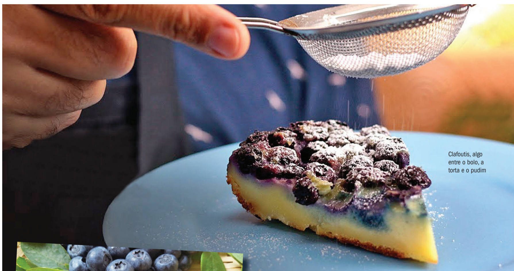
Clafoutis, algo entre o bolo, a torta e o pudim