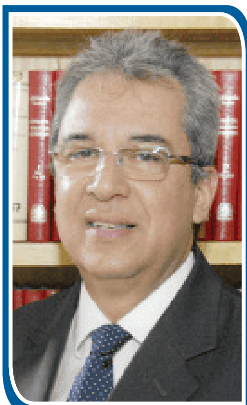
Escritor e advogado