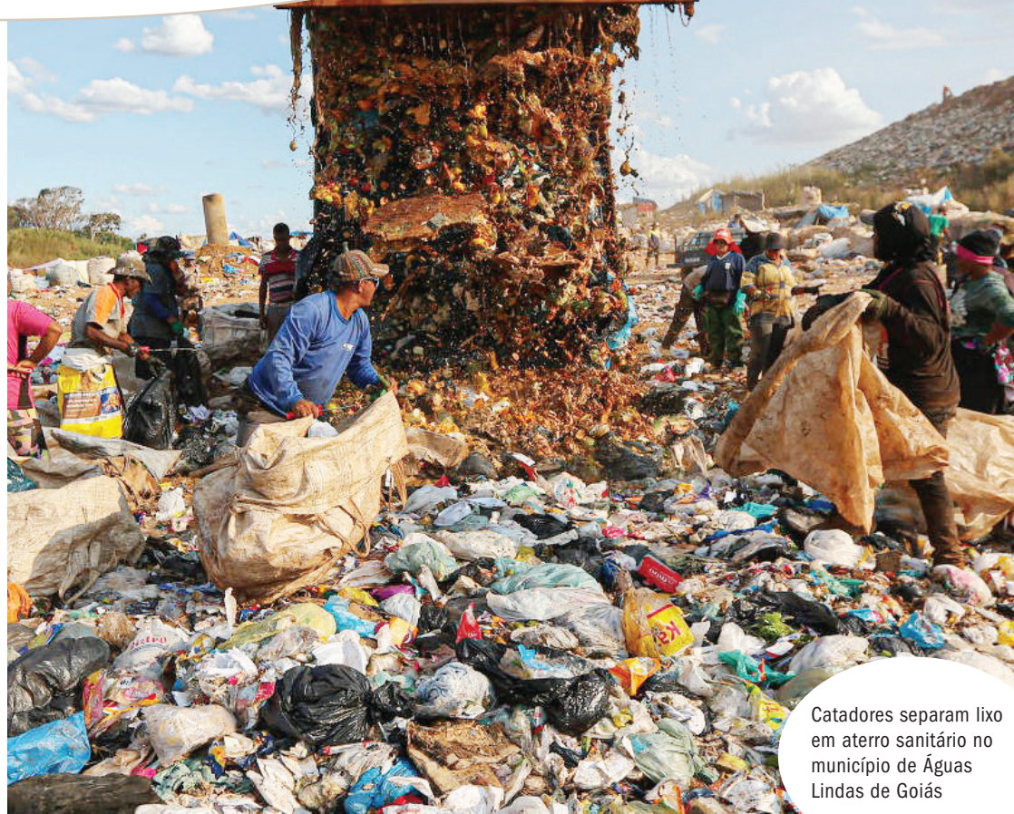
Catadores separam lixo em aterro sanitário no município de Águas Lindas de Goiás

Esse arranjo solucionou um dos principais gargalos, que era a falta de capacidade dos municípios pequenos de estruturar projetos, seja pela falta de pessoal qualificado, seja pela falta de recursos.