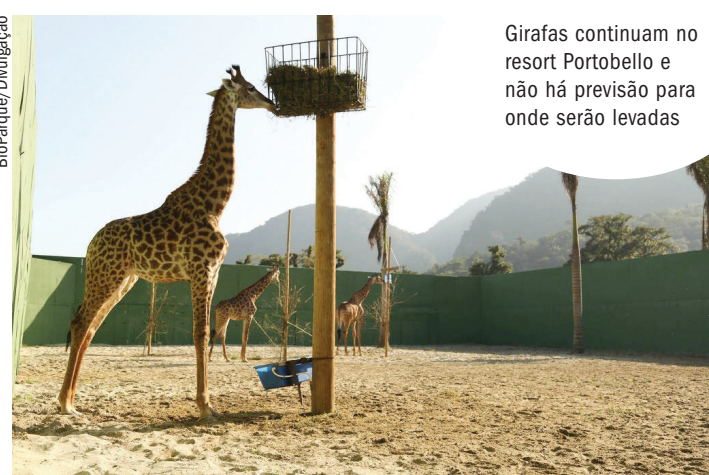
Girafas continuam no resort Portobello e não há previsão para onde serão levadas

Na ação para capturá-las, três girafas morreram. As