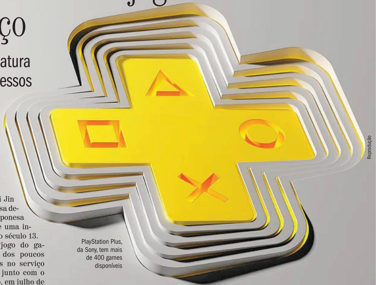
PlayStation Plus, da Sony, tem mais de 400 games disponíveis

Brasil de fora: A empresa japonesa não tem previsão para disponibilizar o serviço de streaming de jogos no Brasil.