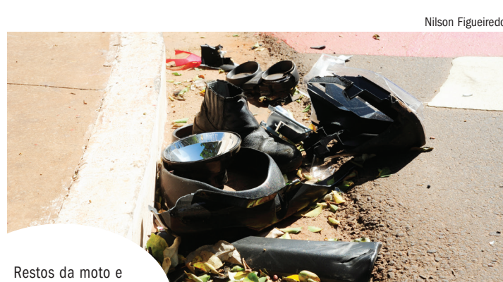
Restos da moto e pertencentes da vítima ficaram espalhados no asfalto