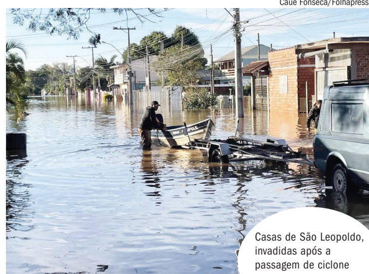
Casas de São Leopoldo, invadidas após a passagem de ciclone

De acordo com meteorologista, a temperatura mais quente do mar na costa do Sul do país, acima do normal, deve colaborar para a formação de chuva forte. “A água quente