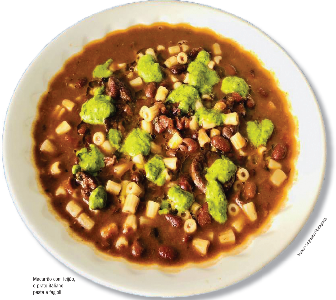
Macarrão com feijão, o prato italiano pasta e fagioli