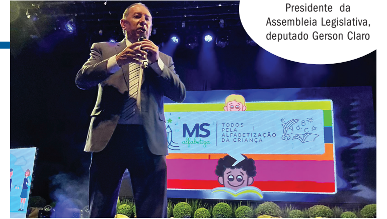
Presidente da Assembleia Legislativa, deputado Gerson Claro

como a questão ambiental ganhou espaço na agenda de preocupações dos gestores, com o ICMS ecológico, certamente, a partir de agora, eles vão acompanhar mais de perto o Ideb e o Saems das suas escolas”, destacou o deputado.