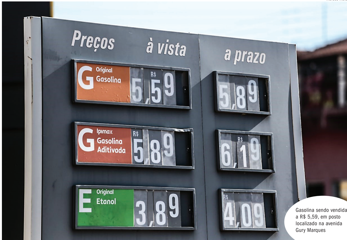
Gasolina sendo vendida a R$ 5,59, em posto localizado na avenida Gury Marques

Também em outro posto, no qual o gerente preferiu não se identificar, o valor vai subir. “Agora, com a volta do imposto federal, o PIS/Cofins