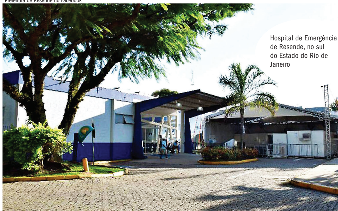
Hospital de Emergência de Resende, no sul do Estado do Rio de Janeiro