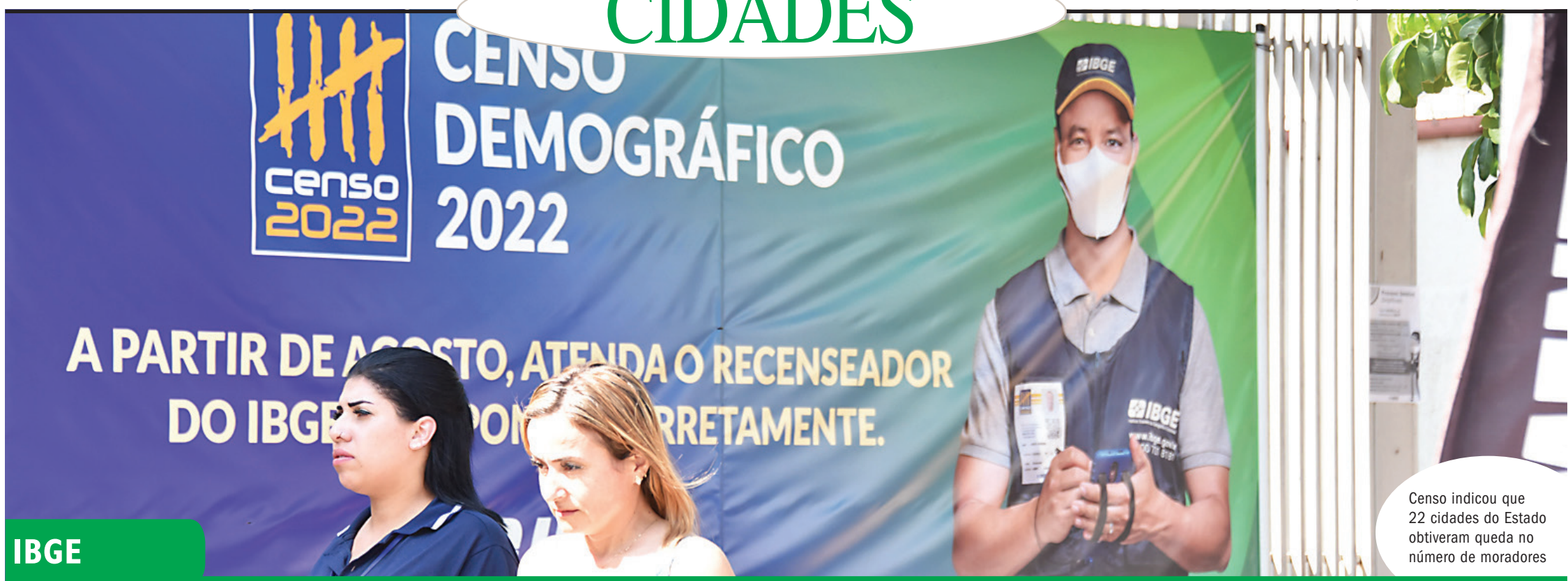
Censo indicou que 22 cidades do Estado obtiveram queda no número de moradores