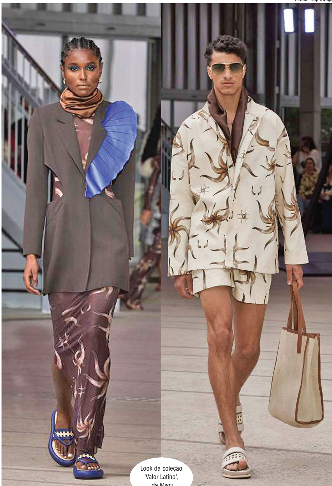
Look da coleção 'Valor Latino', da Misci

pertam atenção. Algumas têm forma de galão e outra é simplesmente imensa -um par de chifres de verdade poderia caber dentro dela com folga. Paisagens naturais aparecem estampadas em calças, que, assim como todos as peças apresentadas, têm silhuetas fluidas e assimétricas.