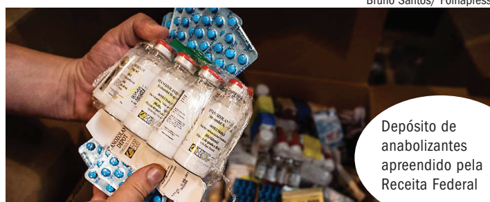
Depósito de anabolizantes apreendido pela Receita Federal

A facilidade para comprar no mercado paralelo, porém,