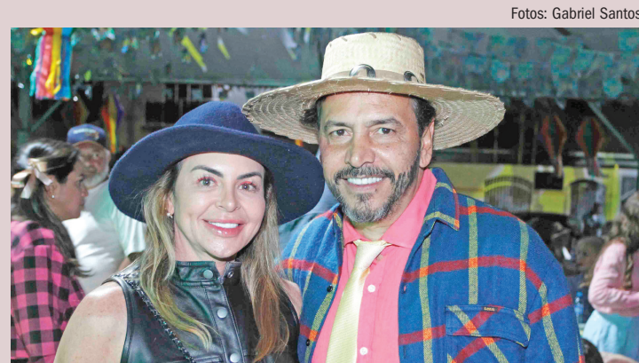
Tatiana e o marido, secretário de Estado de Turismo, Esporte, Cultura e Cidadania, Marcelo Miranda