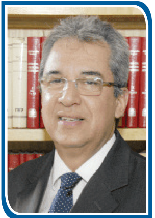
Advogado e escritor

Pois não me envergonho do evangelho, porque é o poder de Deus para a salvação de todo aquele que crê, primeiro do judeu e também do grego. Rm 1:16.