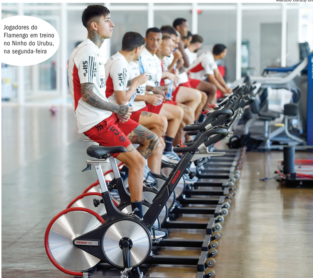
Jogadores do Flamengo em treino no Ninho do Urubu, na segunda-feira

Desde 2019 considerado um jogador praticamente intocável quando está em plenas condições físicas, o meia Arrascaeta tornou-se uma peça nem tão imprescindível no Flamengo do técnico Jorge Sampaoli. Na vitória contra o Santos por 3 a 2, no último domingo (25), por exemplo, o uruguaio iniciou a partida no banco de reservas por opção do treinador.