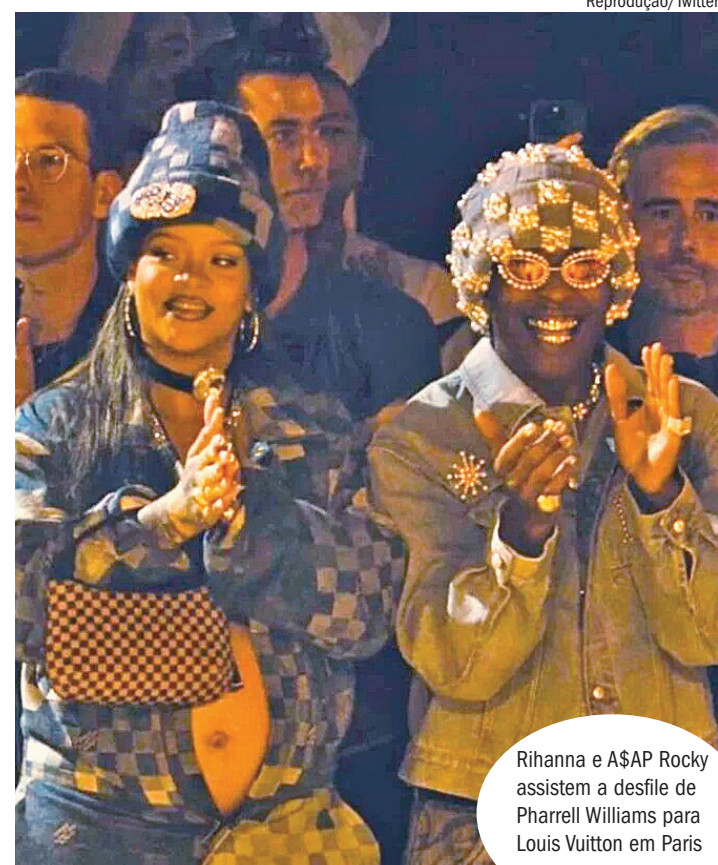
Rihanna e ASAP Rocky assistem a desfile de Pharrell Williams para Louis Vuitton em Paris