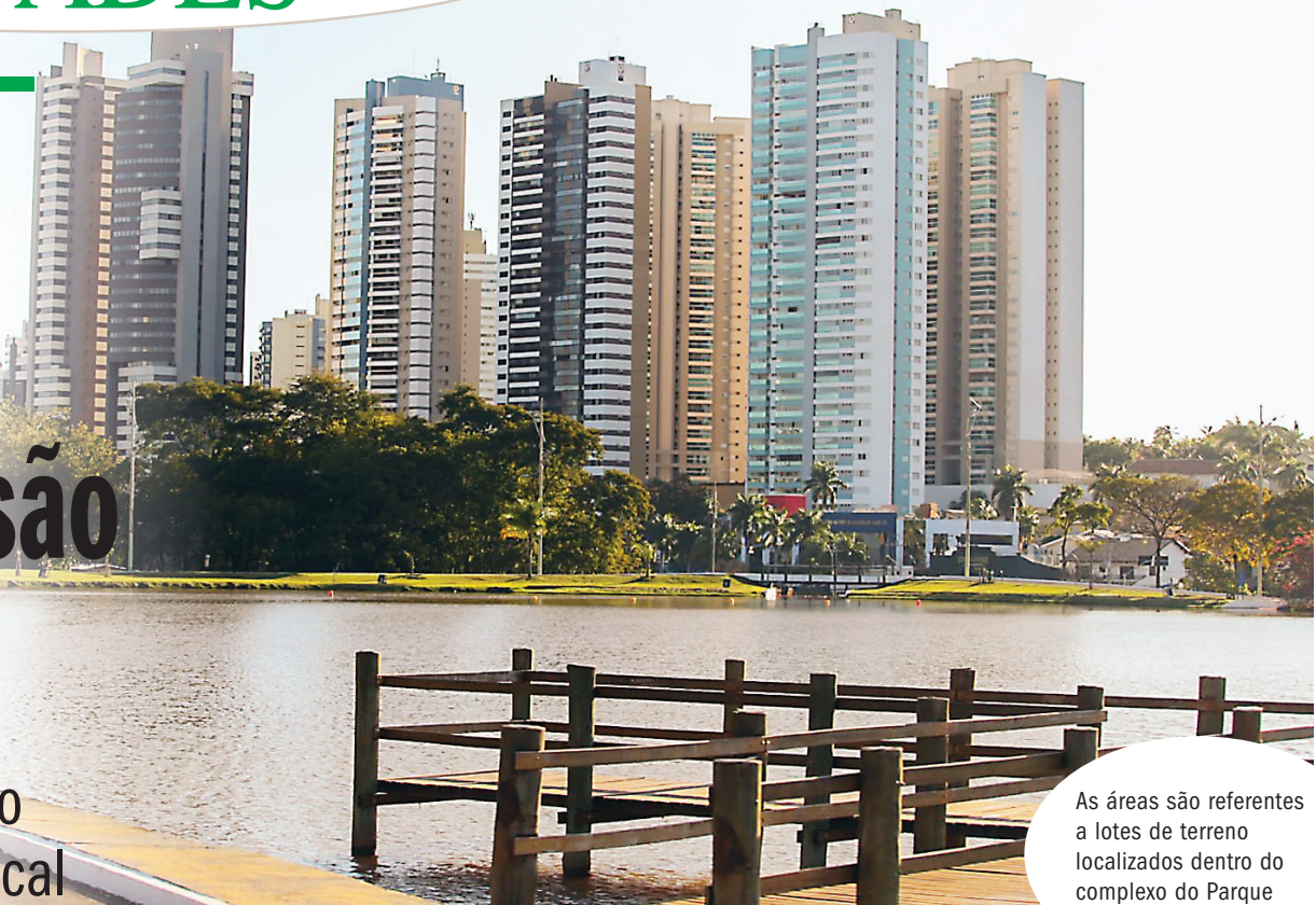
As áreas são referentes a lotes de terreno localizados dentro do complexo do Parque

De acordo com a secretária Eliane Detoni, o BNDES deixou