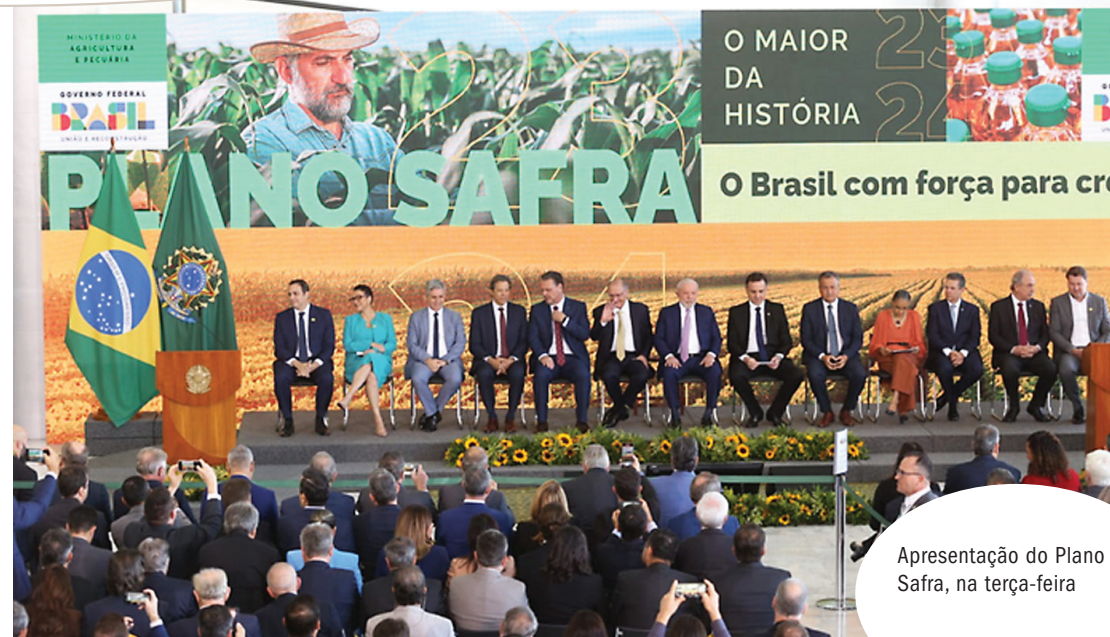
Apresentação do Plano Safra, na terça-feira

O Programa para PCA (Construção e Ampliação de Armazéns) terá um aumento no volume de recursos de 81% para construção de armazéns com capacidade de até seis mil toneladas e de 61% para armazéns de maior capacidade. Desta forma, o objetivo é fortalecer o financiamento de investimentos necessários à construção de novos armazéns, no intuito de aumentar a capacidade estática instalada de armazenagem.