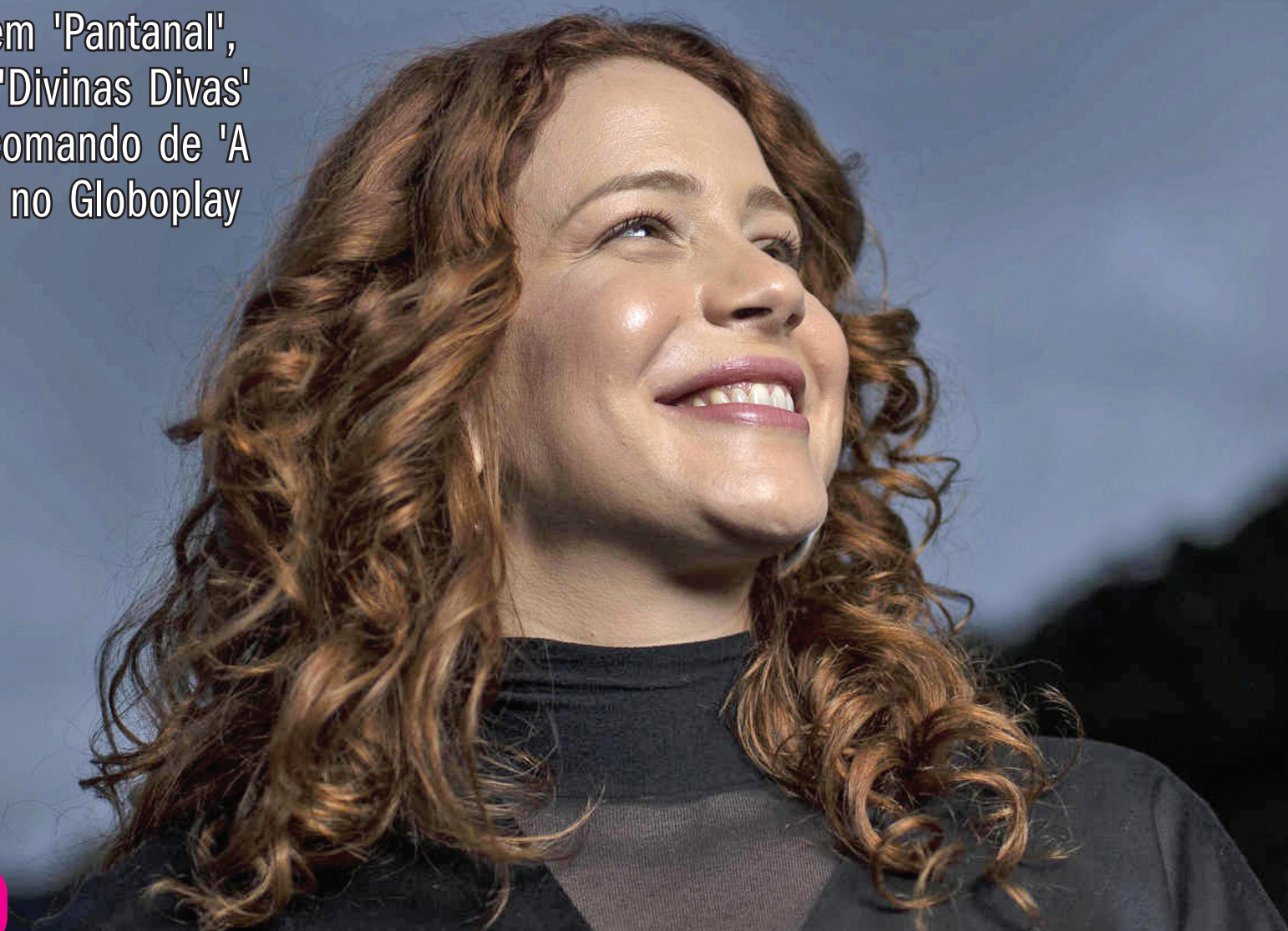
Leandra Leal começou em 'Pantanal', foi premiada por 'Divinas Divas' e agora está no comando de 'A Vida pela Frente', no Globoplay

Artista começou em 'Pantanal', foi premiada por 'Divinas Divas' e agora está no comando de 'A Vida pela Frente', no Globoplay