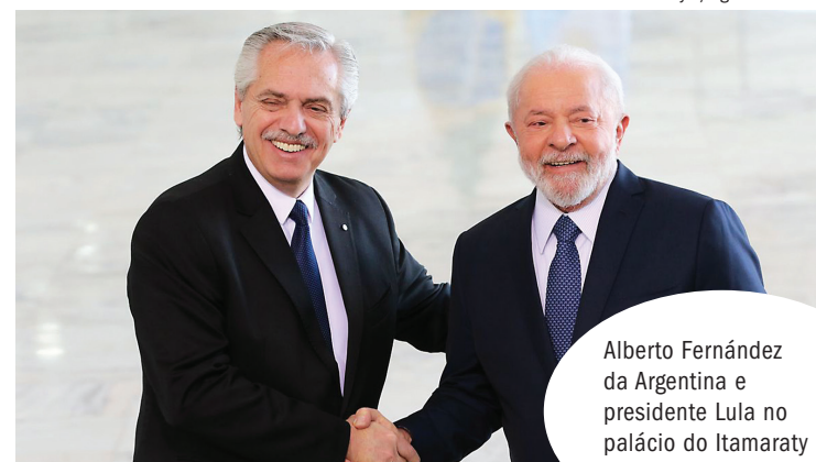
Alberto Fernández da Argentina e presidente Lula no palácio do Itamaraty

criação de uma linha de financiamento abrangente das exportações brasileiras para a Argentina. Não faz sentido o Brasil perca espaço no mercado argentino para outros países porque esses oferecem crédito e nós não”, disse o presidente brasileiro após a reunião. “Todo mundo tem a ganhar: as empresas e os trabalhadores brasileiros e os consumidores argentinos.”