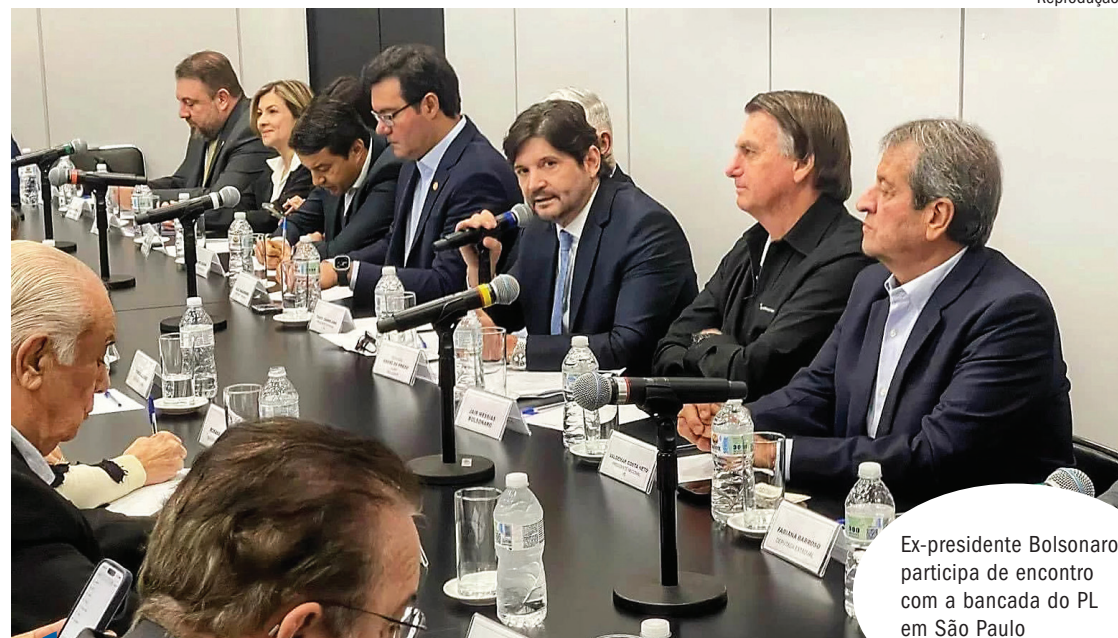
Ex-presidente Bolsonaro participa de encontro com a bancada do PL em São Paulo

Não existe ninguém insubstituível. [...] Tem muita gente aqui muito mais competente do que eu