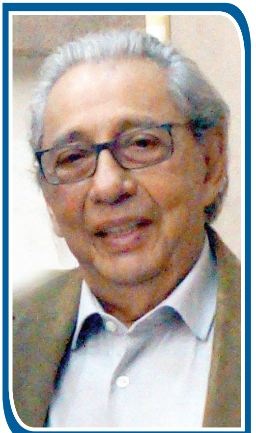
Economista, professor aposentado da UFMS e membro da UBE-MS.

A nova política para o meio ambiente (com a permanência de Marina), a preocupação do governo com o saneamento básico e com a segurança pública, além do desempenho do agronegócio, despertam um bom acolhimento do Brasil no mercado internacional. A blindagem da Educação e da Saúde reforçam a confiabilidade nas propostas governamentais.