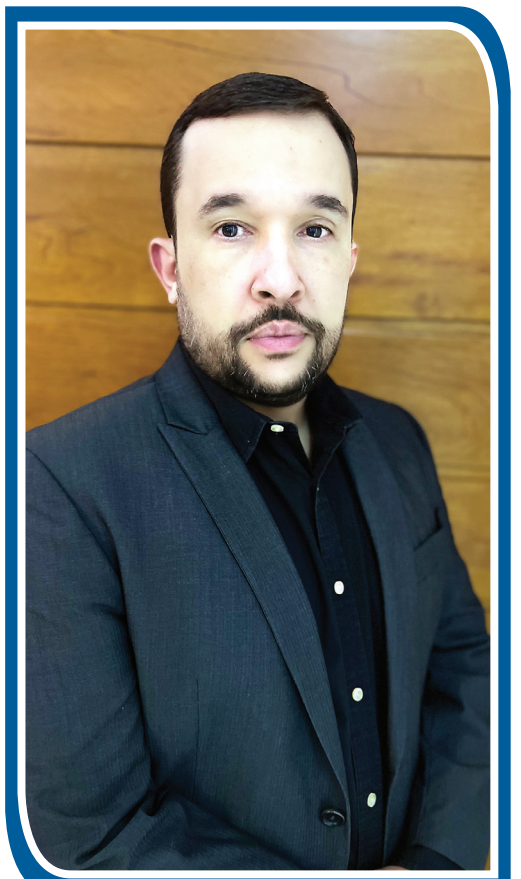
Diretor Florestal da Reflorestar

As soluções florestais estão em franca expansão, surgindo novas tecnologias que agregam valor ao produto e ao setor. Quando as empresas do ramo acompanham essa modernização, tendo a sustentabilidade como um compromisso, trabalhamos para um futuro melhor. O agronegócio florestal segue defendendo estratégias ambientalmente corretas, economicamente viáveis e socialmente justas.