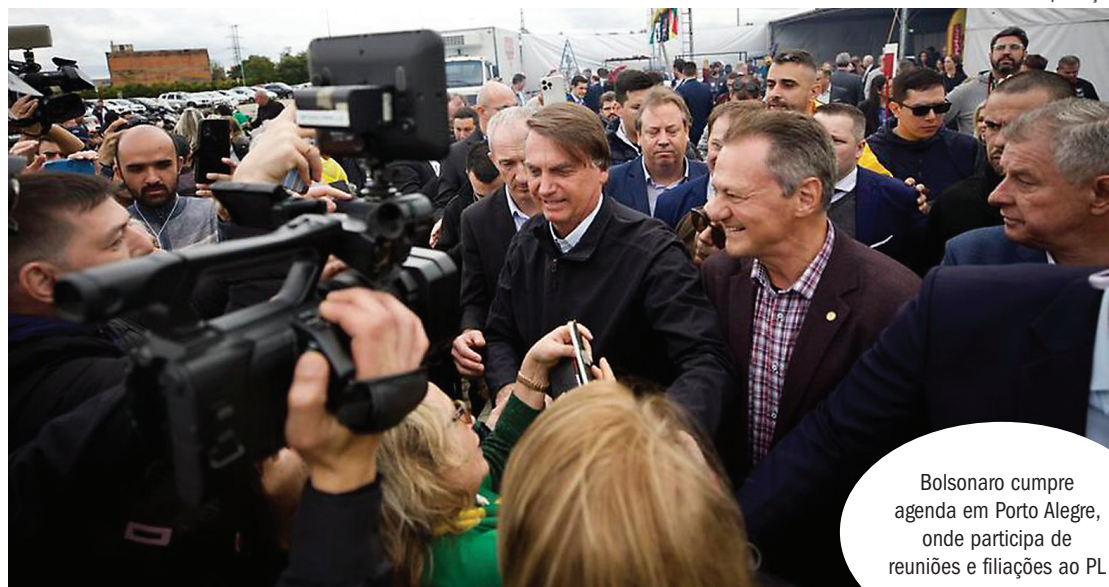
Bolsonaro cumpre agenda em Porto Alegre, onde participa de reuniões e filiações ao PL

“Houve uma jurisprudência em 2017. Quando julgaram a chapa Dilma-Temer e o tribunal não aceitou outras provas anexadas ao processo. Ficou valendo para o julgamento apenas a ação inicial do PSDB em 2015. Dessa forma, a chapa foi mantida legal. Naquele momento, Dilma Rousseff não era mais presidente, foi cassada no ano anterior e mantidos os direitos políticos dela e dessa forma Michel Temer continuou