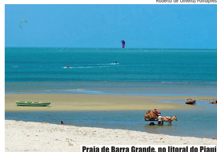
Praia de Barra Grande, no litoral do Piauí

Ainda quase intocados, os locais resistem à badalação, oferecendo paz e tranquilidade aos visitantes