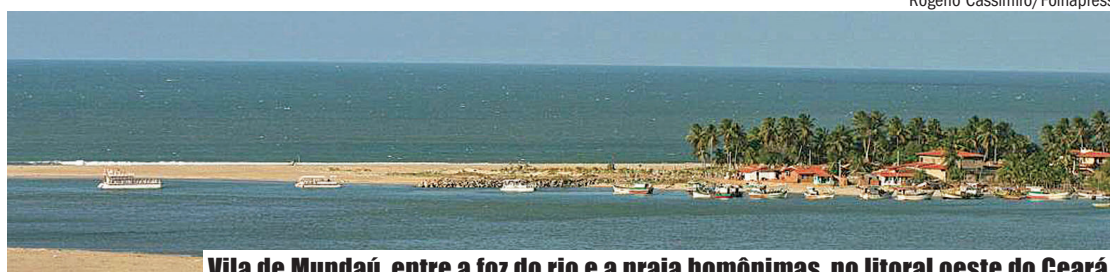
Vila de Mundaú, entre a foz do rio e a praia homônimas, no litoral oeste do Ceará