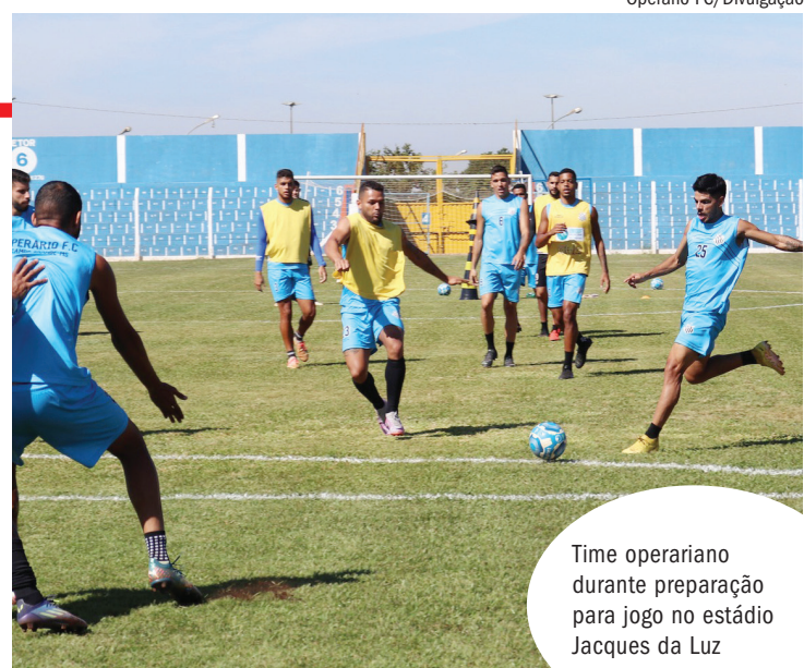
Time operário durante preparação para jogo no estádio Jacques da Luz

Para isso, terá que mudar seu retrospecto. Depois de nove jogos, o Operário ganhou apenas um e acumula quatro derrotas. Novo tropeço, nesta tarde, deve encaminhar o clube a um fim de campeonato melancólico.