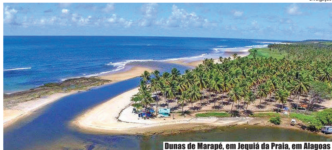
Dunas de Marapé, em Jequiá da Praia, em Alagoas