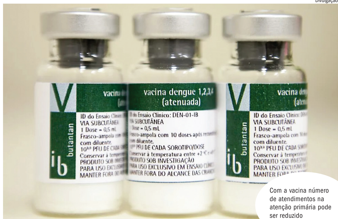
Com a vacina número de atendimentos na atenção primária pode ser reduzido