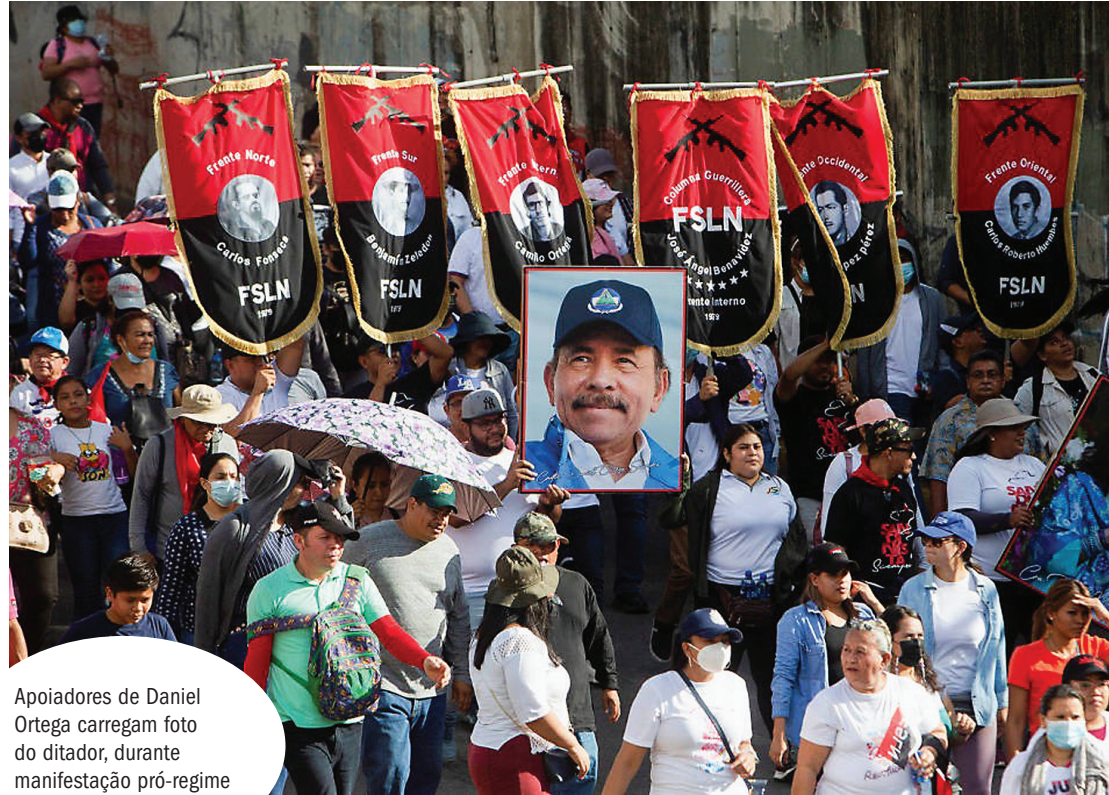
Apoiadores de Daniel Ortega carregam foto do ditador, durante manifestação pró-regime

Muitas das demandas brasileiras permaneceram na versão final da resolução, elaborada pelo grupo de trabalho que também conta com a participação de membros dos governos