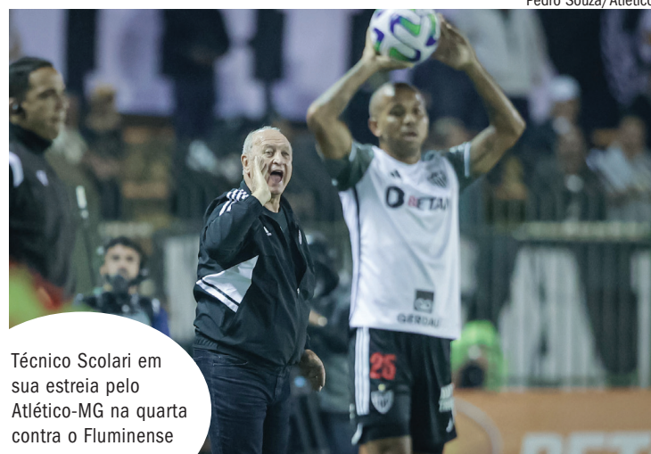
Técnico Scolari em sua estreia pelo Atlético-MG na quarta contra o Fluminense