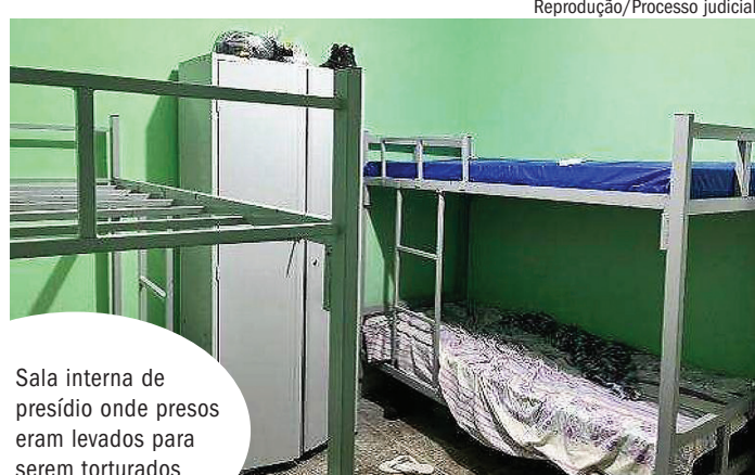
Sala interna de presídio onde presos eram levados para serem torturados

A UPPOO 2 é a unidade onde a Justiça encontrou em setembro do ano passado 72 presos feridos, supostamente