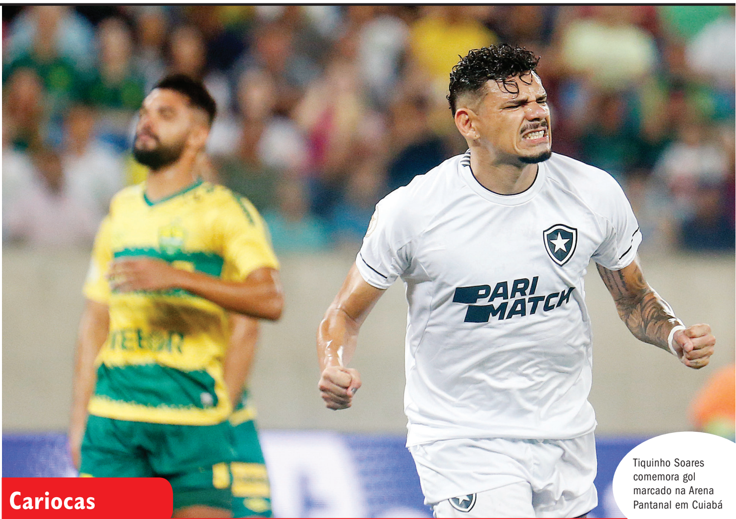
Tiquinho Soares comemora gol marcado na Arena Pantanal em Cuiabá

Jadson André, Gabriel Medina, Yago Dora e Italo Ferreira ainda competem.