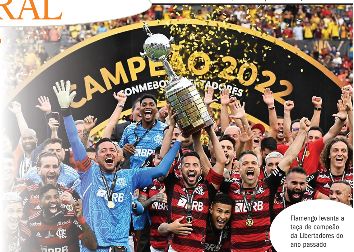
Flamengo levanta a taça de campeão da Libertadores do ano passado

Até o momento, já estão definidos 12 participantes: Palmeiras, Flamengo, Chelsea-ING Real Madrid-ESP, Manchester City-ING, Al-Hilal-ARS, Urawa Red Diamonds-JAP, Al-Ahly-EGI, Wydad Casablanca-MAR, Monterrey-MEX, Seattle Souders-EUA e León-MEX.