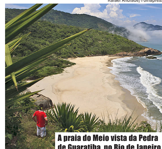
A praia do Meio vista da Pedra de Guaratiba, no Rio de Janeiro