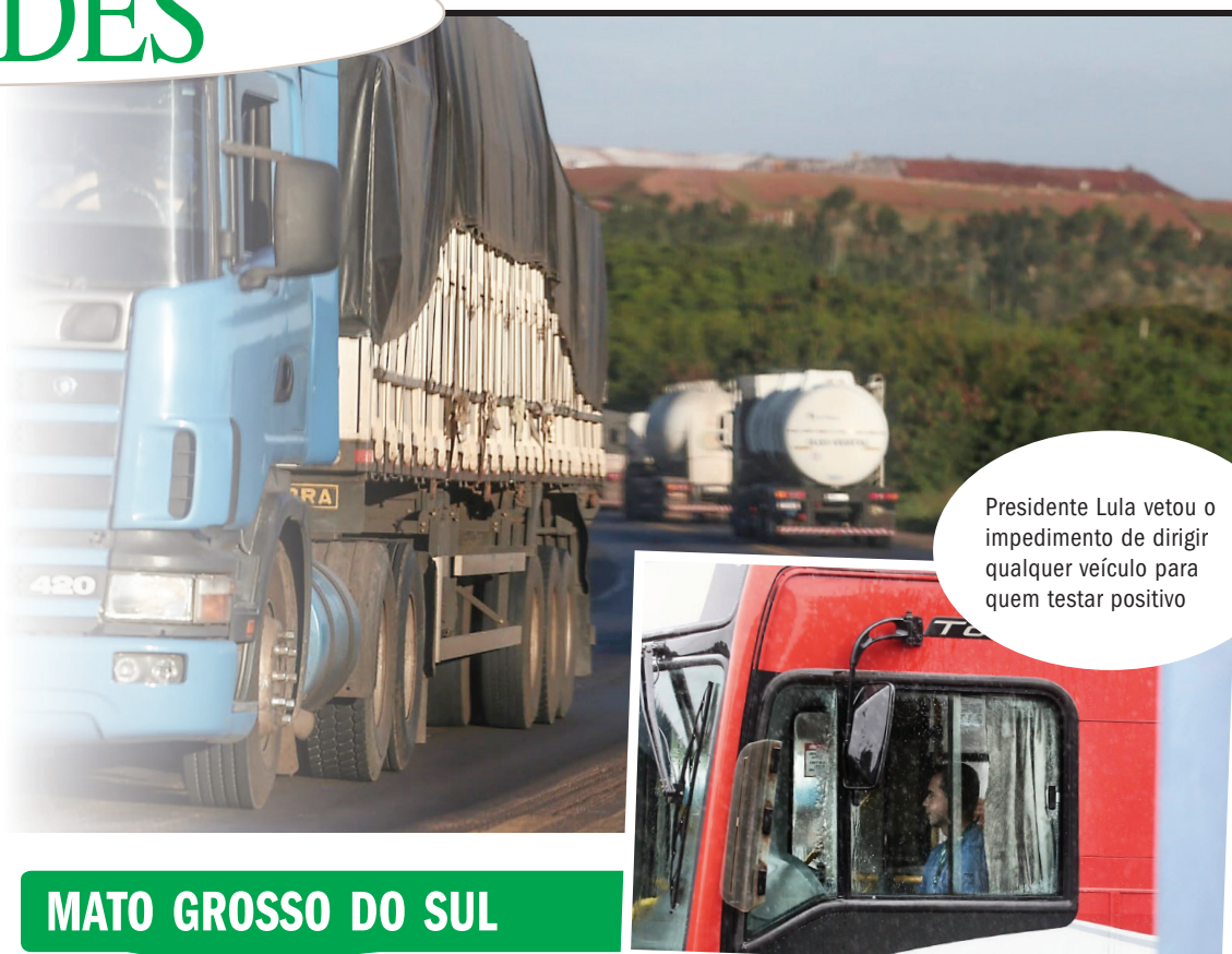
Presidente Lula vetou o impedimento de dirigir qualquer veículo para quem testar positivo

É de competência do médico revisor do laboratório credenciado a interpretação do exame toxicológico e emissão de relatório médico, concluindo pelo uso indevido ou não de substância psicoativa, com base no comprometimento da capacidade do condutor, bem como de medicamentos.