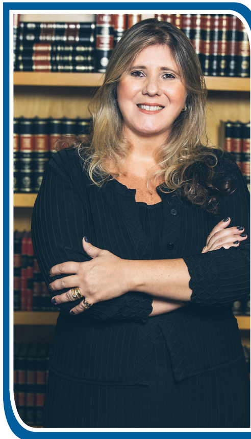
Advogada, sócia do escritório Raeffray Brugioni. Doutora em Direito pela PUC-SP. Vice-presidente do Instituto de Previdência Complementar e Saúde Suplementar (IPCOM). Membro e diretora científica da Academia Brasileira de Direito da Seguridade Social. Membro titular da Câmara de Recursos da Previdência Complementar (CRPC)

Por isso, é de suma importância que os médicos baseiem-se em evidências científicas robustas que sustentem a eficácia e a segurança do uso off-label, bem como a obtenção do consentimento informado do paciente.