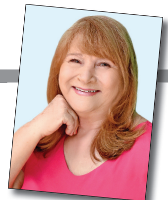
* Professora, cronista e poeta

A 'paraguaiá' vendia cortes de tecido em sua casa para uma freguesia feminina, e jamais haviam visto seu marido por ali. Era sobre ela que os ouvidos da menina estavam ouvindo naquela manhã: de que o investigador havia sido morto a facadas por ela, que uma parte do corpo do homem fora cortada e entregue ao delegado de plantão. Quis saber maiores detalhes com a mãe, mas a resposta foi taxativa: "Isto não é assunto para criança". Não se conformou. Precisava 'sentir a textura' da notícia. Quis ir verificar 'in loco' o ocorrido. Chamou uma amiguinha de longa data, acostumada a aceitar passivamente as ideias da menina de