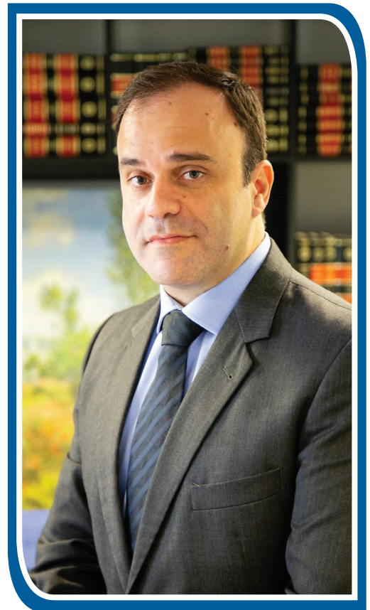
Advogado, sócio do escritório Raeffray Brugioni. MBA em Gestão e Business Law pela Fundação Getúlio Vargas (FGV). Relator e vice-presidente da Terceira Turma Disciplinar do Tribunal de Ética Disciplinar da Ordem dos Advogados do Brasil, Seccional São Paulo