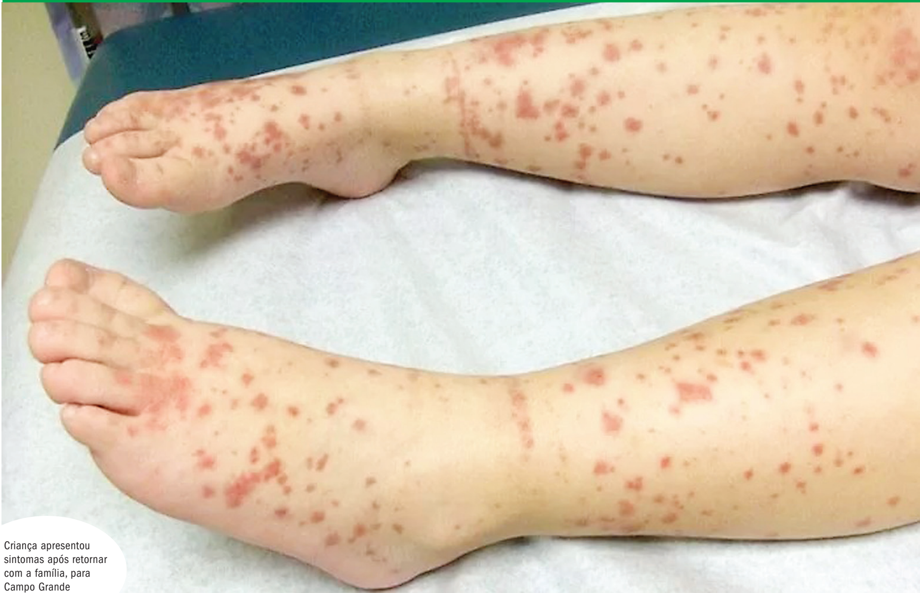
Criança apresentou sintomas após retornar com a família, para Campo Grande