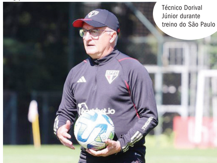
Técnico Dorival Júnior durante treino do São Paulo