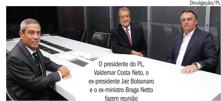
O presidente do PL, Valdemar Costa Neto, o ex-presidente Jair Bolsonaro e o ex-ministro Braga Netto fazem reunião