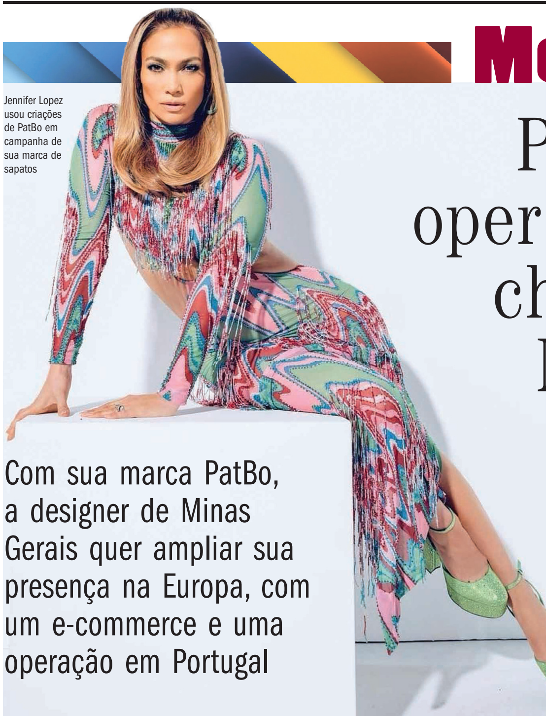
Jennifer Lopez usou criações de PatBo em campanha de sua marca de sapatos

Com sua marca PatBo, a designer de Minas Gerais quer ampliar sua presença na Europa, com um e-commerce e uma operação em Portugal