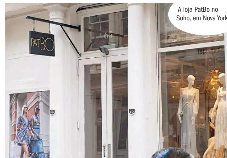
A loja PatBo no Soho, em Nova York

Uma jornada de internacionalização na contramão da tendência do "luxo silencioso", com peças bordadas com pedrarias, tanto casuais, quanto para festa. "Sou maximalista mesmo." Sua