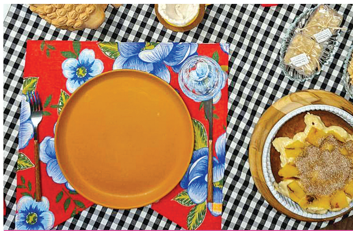
Jogo americano de chita sobre toalha de mesa xadrez

Se você não quiser comprar pratos de barro ou com tema de festa junina, é possível personalizar os que você já tem