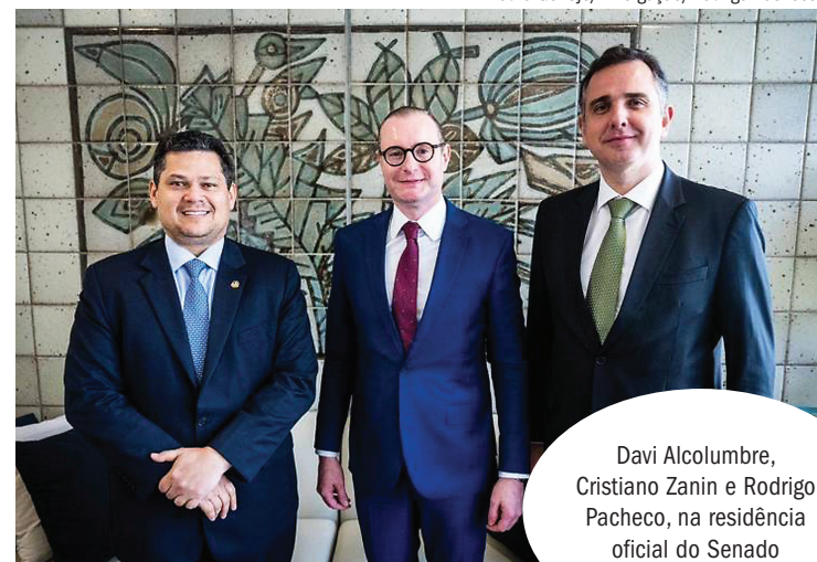
Davi Alcolumbre, Cristiano Zanin e Rodrigo Pacheco, na residência oficial do Senado