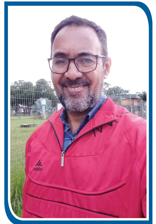
Licenciado em História pela UFMS, pós-graduado em Gestão Escolar e professor da rede pública municipal

É, portanto, dentro dessa perspectiva de proteção e cuidado aos animais, presentes nesse mundo ESG, que vivemos, a direção aqui apontada, para que junto com essa visão desenvolvimentista que ela seja também socialmente justa e ecologicamente responsável, no sentido de poder oferecer um local para o descanso de nossos amigos!