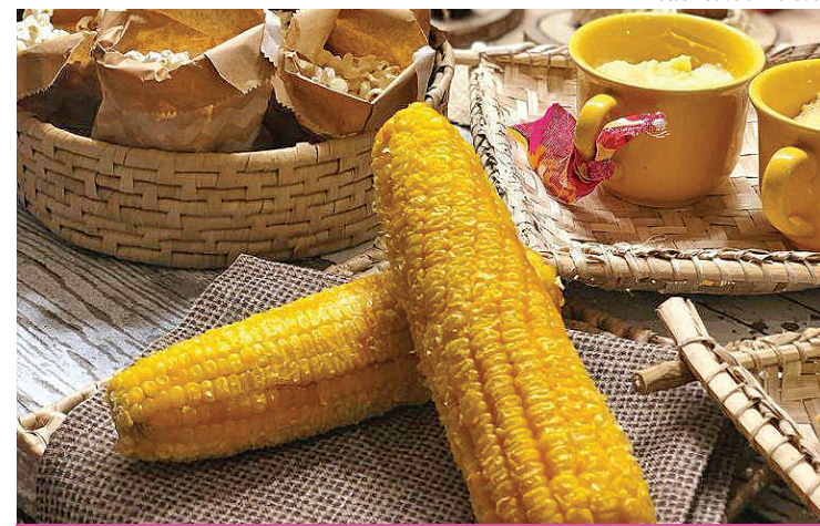
Milho servido em bandeja de palha forrada com tecido com estampa de girassol

Confira como criar decoração divertida, colorida e barata para comemorar o São João