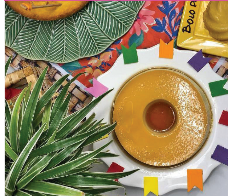
Prato decorado com banderinhas feitas de EVA