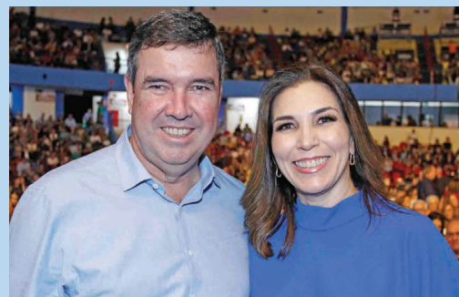
O querido governador Eduardo Riedel (PSDB) e a primeira-dama, Mônica Riedel