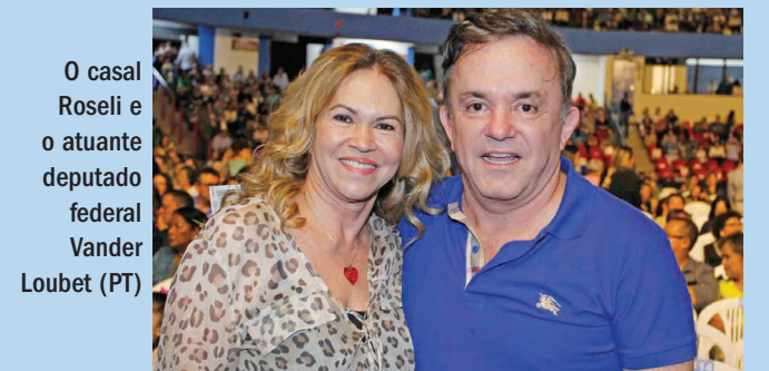
O casal Roseli e o atuante deputado federal Vander Loubet (PT)