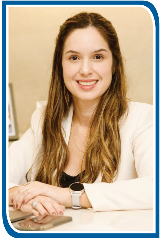
É pedagoga e mestre pela UFMS em Saúde e Desenvolvimento. É diretora da Escola Harmonia

Com os maiores, que estão no ensino fundamental 2 e no ensino médio, e que ainda não desenvolveram o hábito de estudar sozinho, você precisará ter mais paciência e constância para desinstalar um hábito errado e cultivar novos hábitos corretos. Nessas situações, você precisará ter calma, dialogar mais, fazer antecipações e combinados sobre a nova fase do estudante e, sabiamente, driblar e orientar nos momentos de quedas. Lembre-se: jamais rompa com seu filho nas situações em que você sabe que ele errou. Nessas circunstâncias, corrija a atitude e o comportamento dele, diga que você não aprova o que ele fez, mas que você sempre estará com ele para caminharem juntos na direção do que é certo e verdadeiro. A grande maioria dos pais, quando vão corrigir os filhos, rompem com as relações afetivas, achando que, assim, os filhos aprenderão. Entretanto, estes, por imaturidade, vendo o afastamento dos pais, acabam se refugiando em outras relações, que nem sempre são adequadas e saudáveis. Resumindo: sempre que seu filho errar, corrija-o, sim! Mas nunca rompa os laços afetivos e de confiança. Ele precisa saber que você ainda acredita nele. Como afirmou Santo Agostinho, em sua Carta 211, “Cum dilectione hominum et odio vitiorum”, que significa: “Com amor pela humanidade e ódio pelos pecados”. Corrija e gere consequências, sempre demonstrando suas intenções e principalmente seu cuidado e amor.