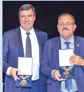
O governador de MS, Eduardo Riedel (PSDB), e o ministro do STJ Humberto Martins