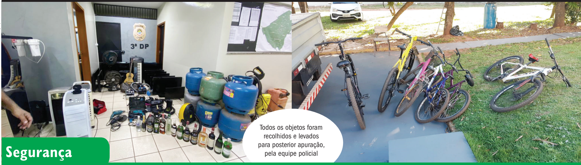
Todos os objetos foram recolhidos e levados para posterior apuração, pela equipe policial