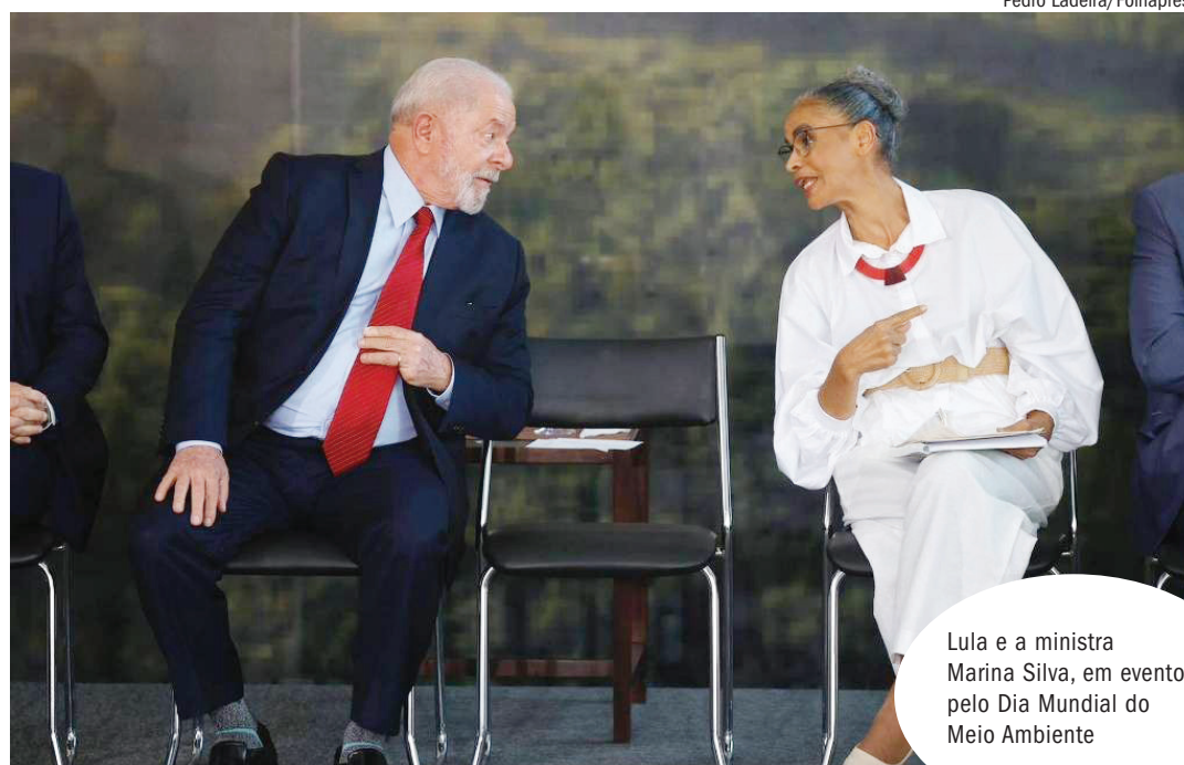
Lula e a ministra Marina Silva, em evento pelo Dia Mundial do Meio Ambiente

Uma das alterações mais significativas no padrão da destruição da floresta são a