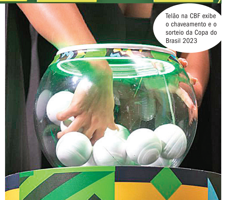
Tela na CBF exibe o chaveamento e o sorteio da Copa do Brasil 2023

São 17 taças em campo nas quartas de final: Grêmio (5 vezes), Palmeiras (4), Flamengo (4), Corinthians (3), e Athletico (1). América-MG, Bahia e São Paulo buscam, pela primeira vez, o título da competição.