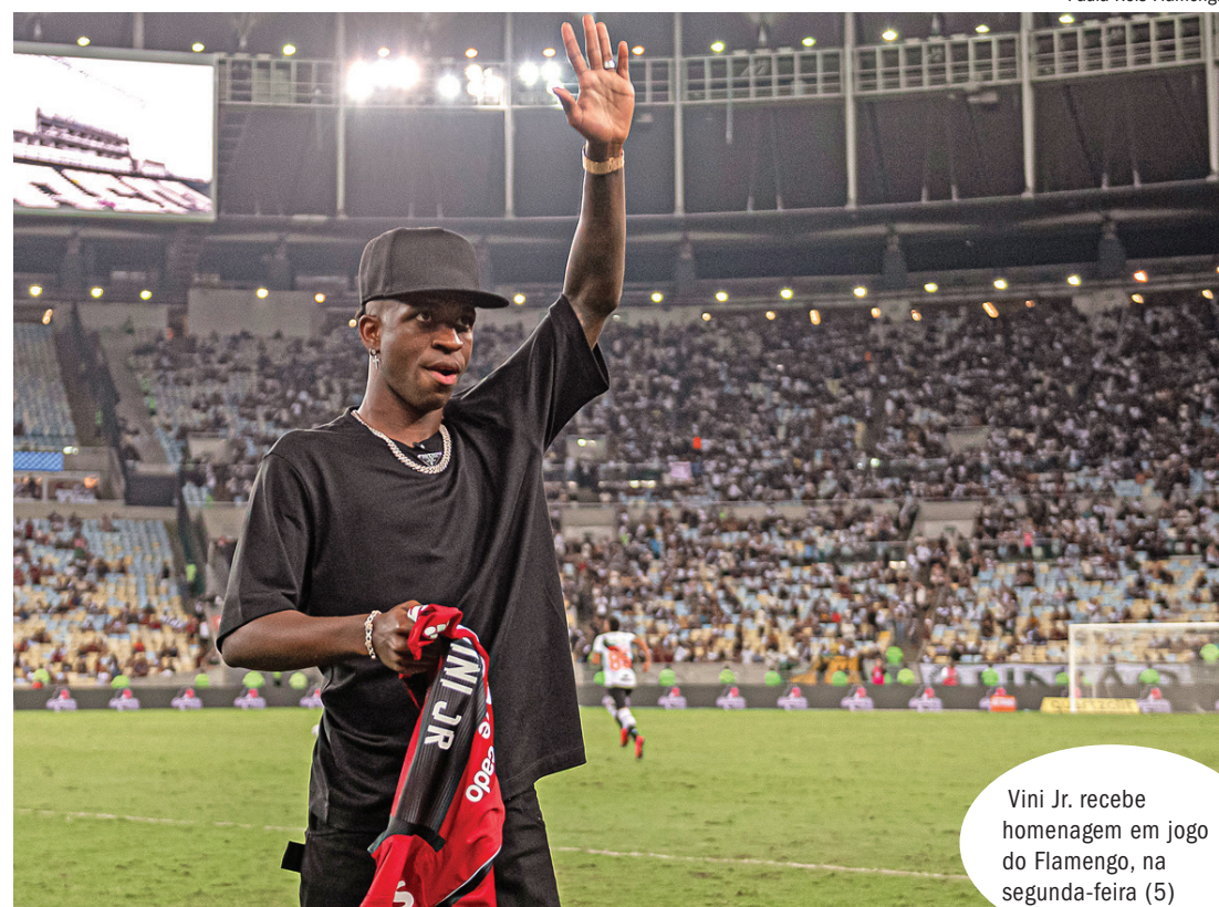
Vini Jr. recebe homenagem em jogo do Flamengo, na segunda-feira (5)

A Comissão Antiviolença, que cuida de casos de racismo, xenofobia e intolerância em atividades esportivas, sugeriu também o aumento do valor