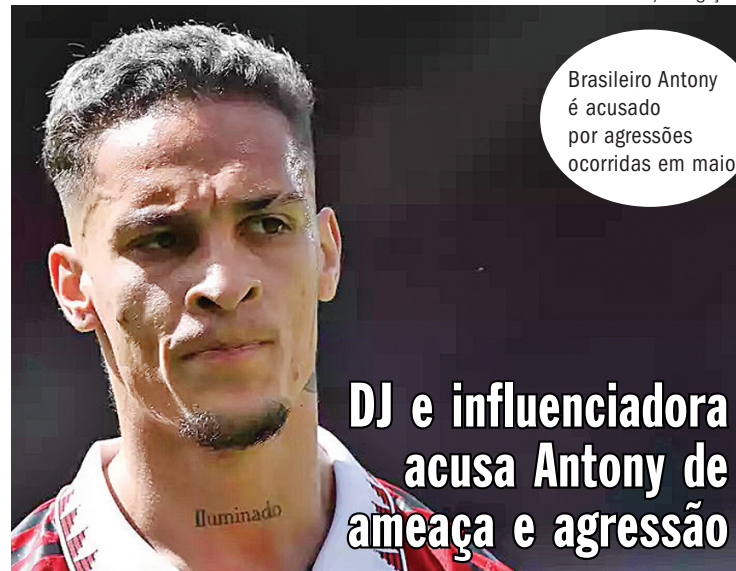
Brasileiro Antony é acusado por agressões ocorridas em maio