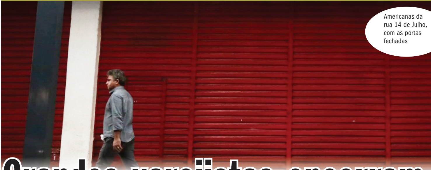
Americanas da rua 14 de Julho, com as portas fechadas