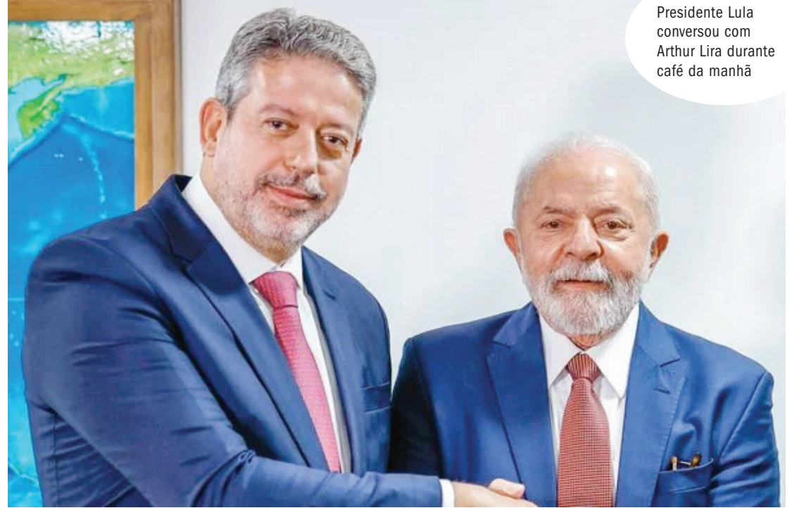
Presidente Lula conversou com Arthur Lira durante café da manhã