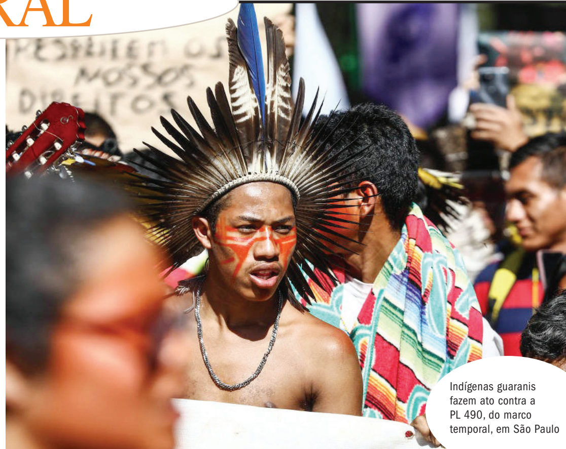
Indígenas guaranis fazem ato contra a PL 490, do marco temporal, em São Paulo

“Os povos indígenas do Brasil têm tido seus territórios e tradições historicamente violados. Como diz Ailton Krenak, nunca houve paz para os povos indígenas, a invasão de seus territórios nunca cessou”, destacou Marta Machado, Secretaria Nacional de Polí-