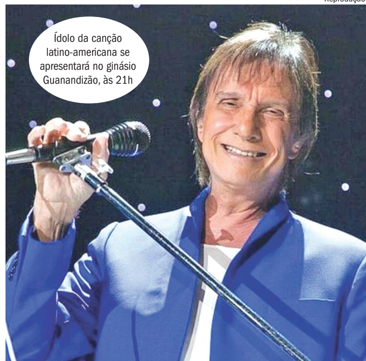
Ídolo da canção latino-americana se apresentará no ginásio Guanandizão, às 21h

Conhecido como “Rei”, Roberto Carlos começou a carreira na década de 1960, influenciado pelo samba-canção e pela bossa nova. Com composições próprias, geralmente feitas em parceria com o amigo Erasmo Carlos, fundou as bases para o pri-