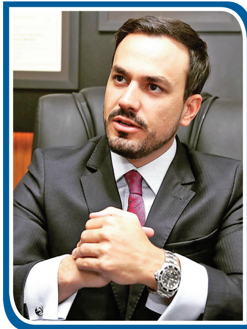
Mestre e doutorando em Direito Empresarial, sócio do escritório OVA Advogados

A integridade e a ética são comportamentos que devem nortear a utilização desse mecanismo, garantindo que apenas as empresas genuinamente em crise financeira possam usufruir dos benefícios da recuperação judicial, para preservar a confiança no sistema jurídico e para manter a justiça e a equidade na aplicação da lei, situação recentemente