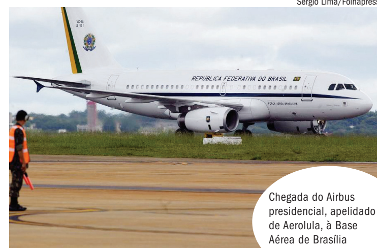
Chegada do Airbus presidencial, apelidado de Aerolula, à Base Aérea de Brasília

Isso porque a instalação de uma suíte com chuveiro, sala de reuniões e todo o sistema de comunicação e internet do modelo deixaria em solo por até dois meses e a FAB tem usado com fre-