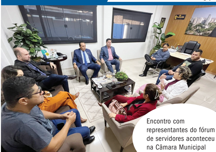
Encontro com representantes do fórum de servidores aconteceu na Câmara Municipal