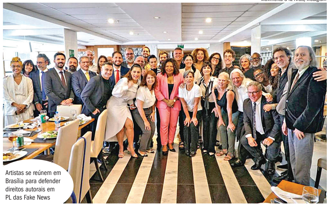
Artistas se reúnem em Brasília para defender direitos autorais em PL das Fake News

A Associação Brasileira de Autores Roteiristas, a Abra, tem defendido um modelo de gestão coletiva, como já acontece no caso da música, com o Escritório Central de Arrecadação e Distribuição, o Ecad, em que os roteiristas