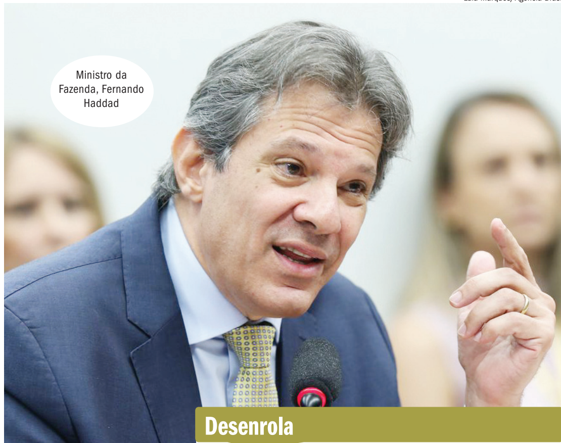
Ministro da Fazenda, Fernando Haddad

Por se tratar de renúncia fiscal, a medida precisa vir acompanhada de algum tipo de compensação. Uma das possibilidades levantadas é de que a regulamentação do segmento das apostas espor-