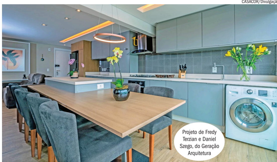
Projeto de Fredy Terzian e Daniel Szego, do Geração Arquitetura

É importante buscar uma uniformidade entre cozinha e lavanderia integradas, desde a cor da marcenaria até dos revestimentos (pisos