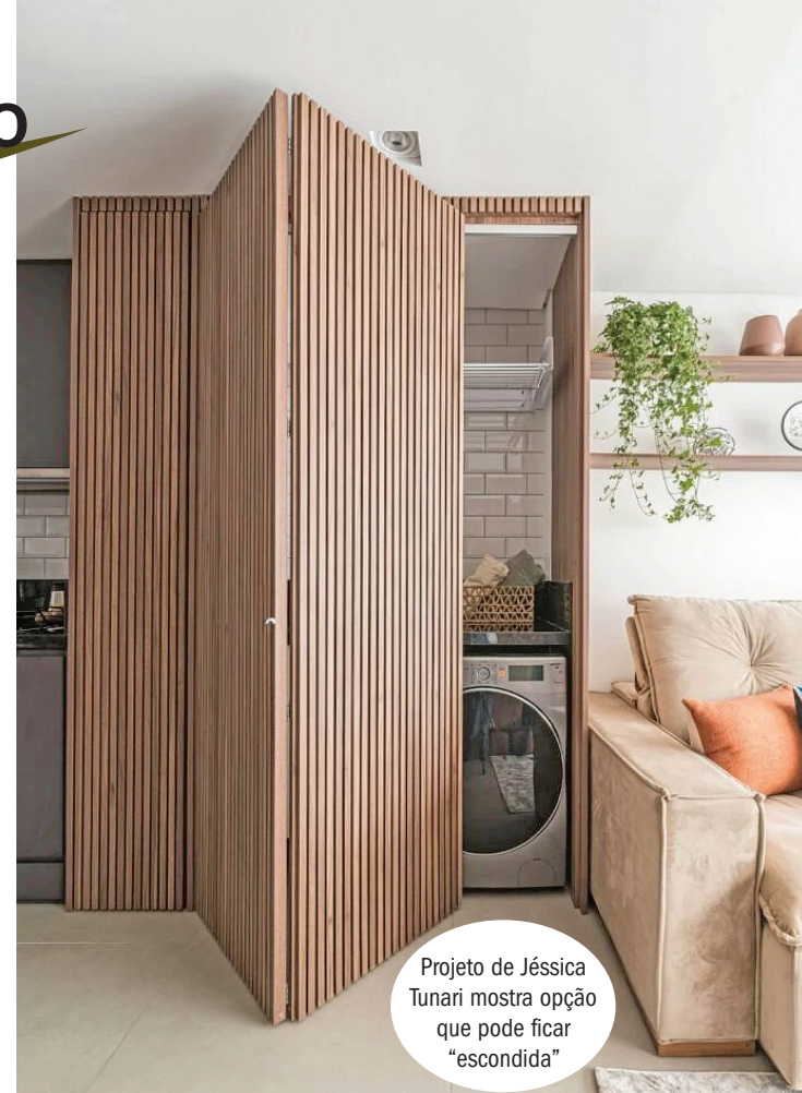
Projeto de Jéssica Tunari mostra opção que pode ficar "escondida"