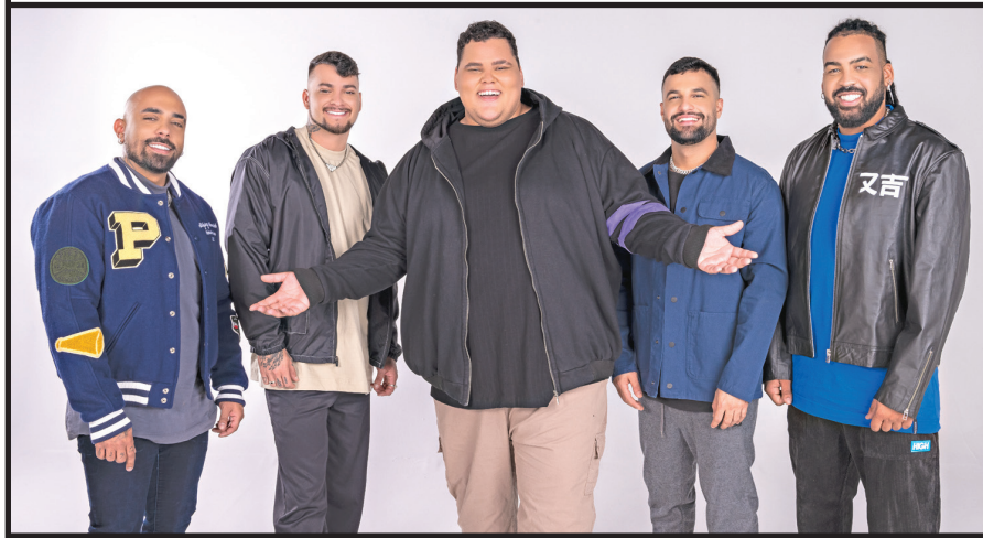
Menos é Mais