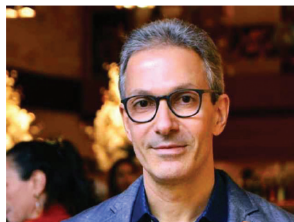
Governador de Minas Gerais, Romeu Zema