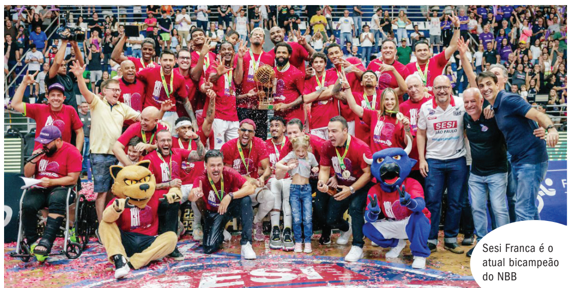
Sesi Franca é o atual bicampeão do NBB

A CBB, porém, deixou claro que pretende indicar para esse e outros torneios, como a Liga Sul-Americana, equipes que disputam os seus campeonatos. O Campeonato Brasileiro da confederação