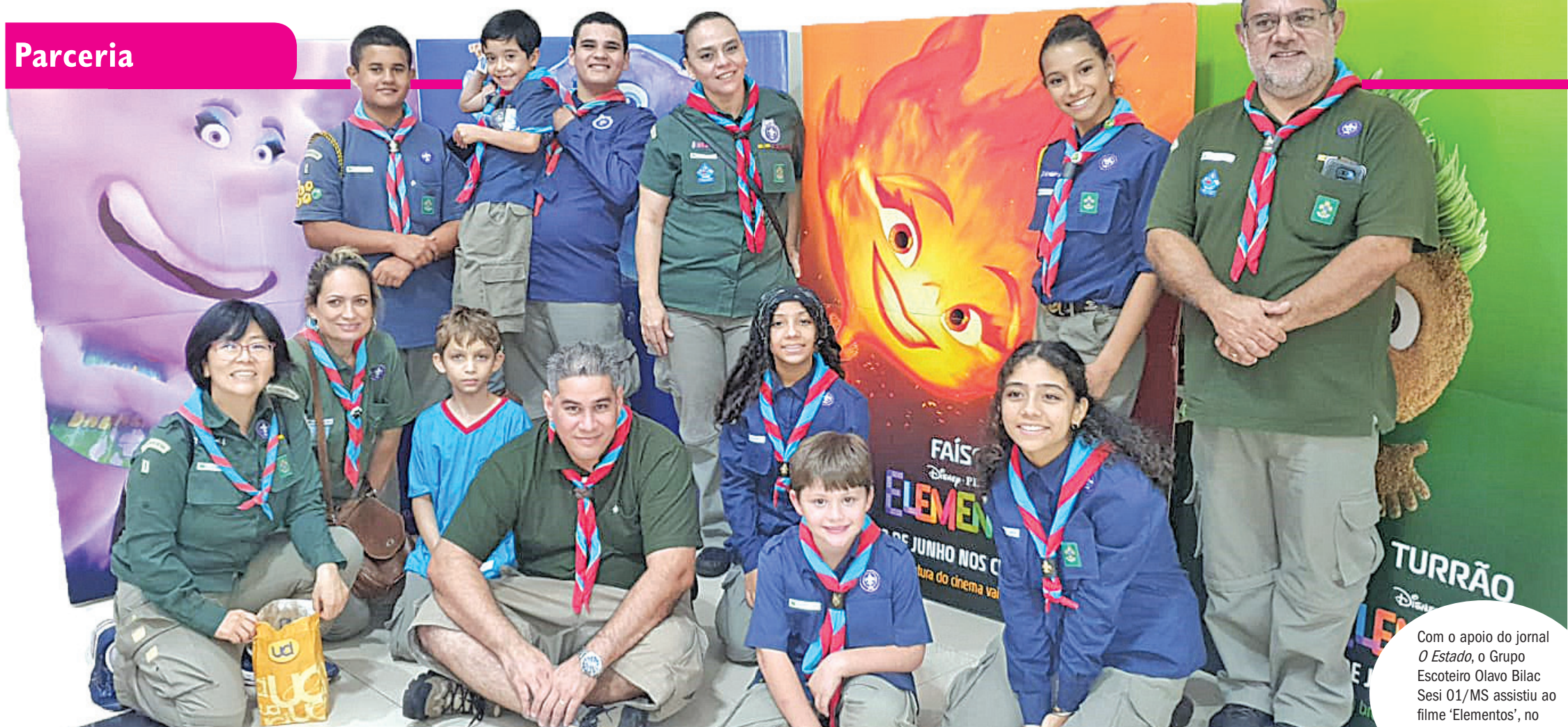
Com o apoio do jornal O Estado , o Grupo Escoteiro Olavo Bilac Sesi 01/MS assistiu ao filme 'Elementos', no cinema UCI, no shopping Bosque dos Ipês