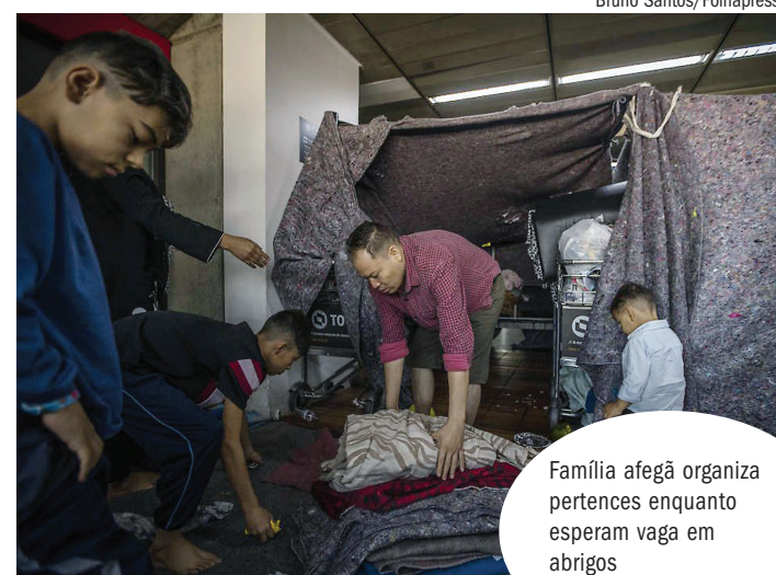
Família afegã organiza pertences enquanto esperam vaga em abrigos

ONGs e especialistas em migração demandam que o Estado estrutura um plano de acolhida a longo prazo para os afegãos. Do contrário, expressam ativistas que atuam no acolhimento a esse grupo, cenas como as recém-registradas no Aeroporto de Guarulhos voltarão a se repetir em breve, tão logo desembarquem novos imigrantes no país.