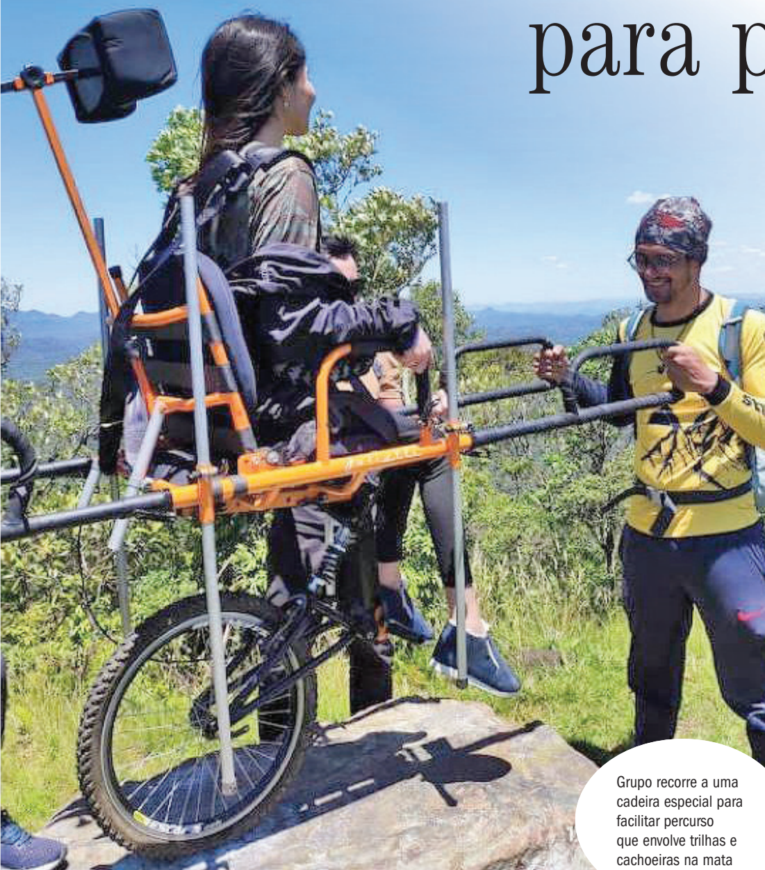
Grupo recorre a uma cadeira especial para facilitar percurso que envolve trilhas e cachoeiras na mata

Grupo participa de trilhas e percursos nas florestas e cachoeiras em projeto iniciado desde 2018, no PR