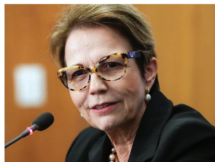
Senadora de Mato Grosso do Sul, Tereza Cristina