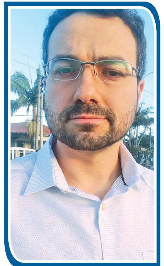
O autor do artigo é pós-graduado em Direito público e escritor. Facebook / Instagram: @rodolphobpereira

devida crítica à tentativa de censura: “O Ministério Público Federal, quando faz propaganda em um veículo digital, pago pelo povo, somente para alardear uma acusação contra quem quer que seja, faz uso indevido de recursos públicos contra o próprio público, que é dono dos recursos. Esse alarde de uma acusação serve para intimidar e manchar a reputação daquele que é acusado. É, em resumo, um ato antidemocrático, de má-fé, abusivo, leviano, e que pretende levar a população ao engano. E porque é abusivo, é um ato ilícito, um exercício de injustiça praticado com o dinheiro do pobre brasileiro pagador de impostos. Os serviços prestados à sociedade brasileira pela Jovem Pan preenchem muitas páginas da história do Brasil desde o século passado. Mas somente agora está sob ataque. Justamente por ousar ser aquilo que se espera de um veículo de imprensa: livre, independente, e sempre crítico.”