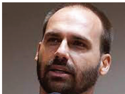
Filho, deputado federal Eduardo Bolsonaro