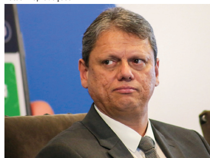
Governador de São Paulo, Tarcísio de Freitas