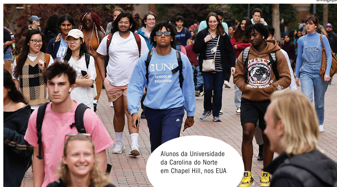
Alunos da Universidade da Carolina do Norte em Chapel Hill, nos EUA

"Ao mesmo tempo, como todas as partes concordam,