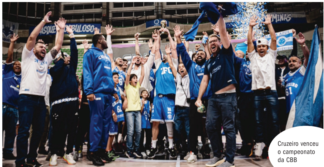
Cruzeiro venceu o campeonato da CBB

tem sido, na prática, uma espécie de segunda divisão, sem as principais agremiações. O mais recente foi vencido pelo Cruzeiro, no início deste mês.