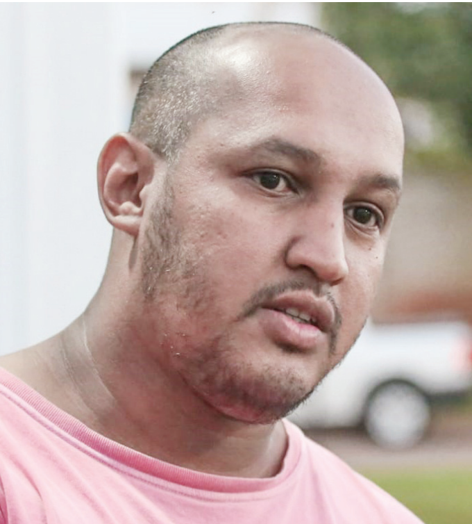
Proteção Atuando como agente patrimonial da unidade há um ano e meio, o profissional destaca que lembrou das filhas, no momento da ação

A polícia também investiga um suposto abuso sexual cometido contra ele, enquanto ainda era aluno da escola municipal e isso teria desencadeado o ataque. Página A5