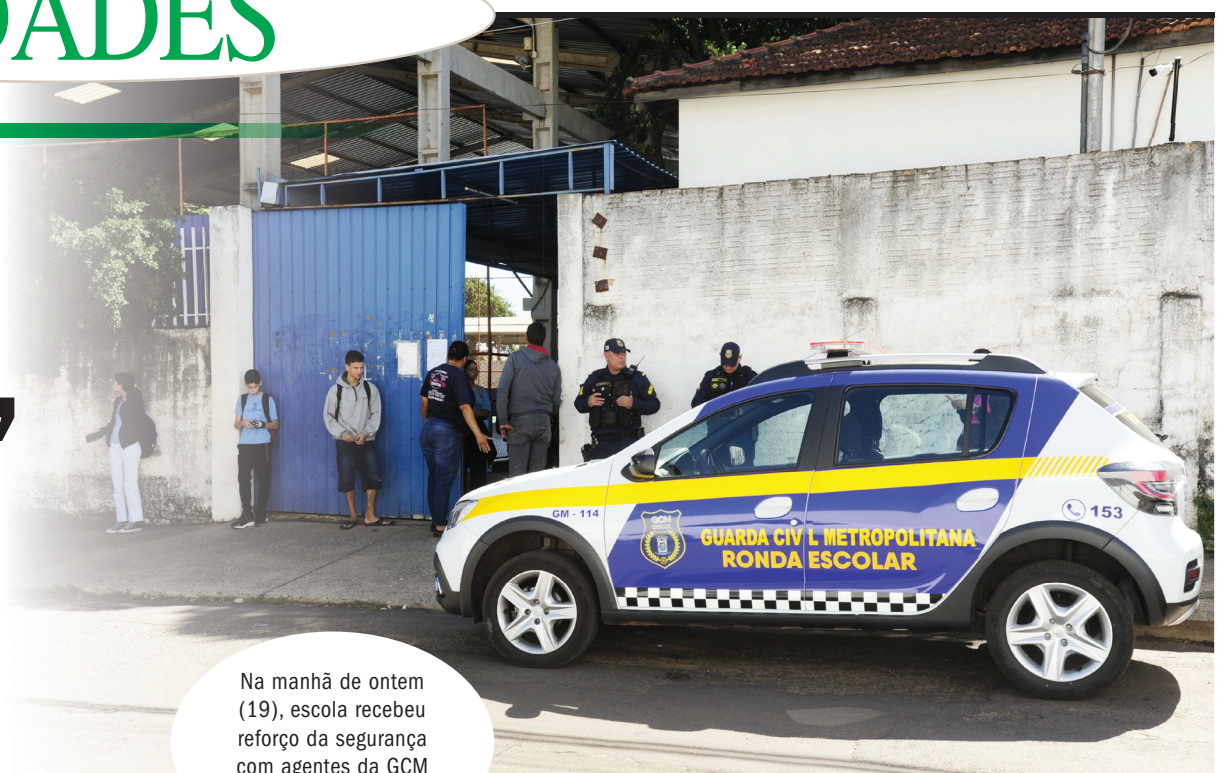
Na manhã de ontem (19), escola recebeu reforço da segurança com agentes da GCM

Após o ato, os funcionários acionaram a Polícia Militar, que encaminhou o jovem à Deajj (Delegacia Especializada de Atendimento à Infância e Juventude). A escola foi submetida a exame pericial e os instrumentos que seriam utilizados para vitimar os alunos, sendo quatro facas e um machete, foram apreendidos pela PM. As circunstâncias e suas motivações ainda estão sendo investigadas. A advogada, vítima do adolescente, recebeu alta hospitalar na manhã de ontem (19).