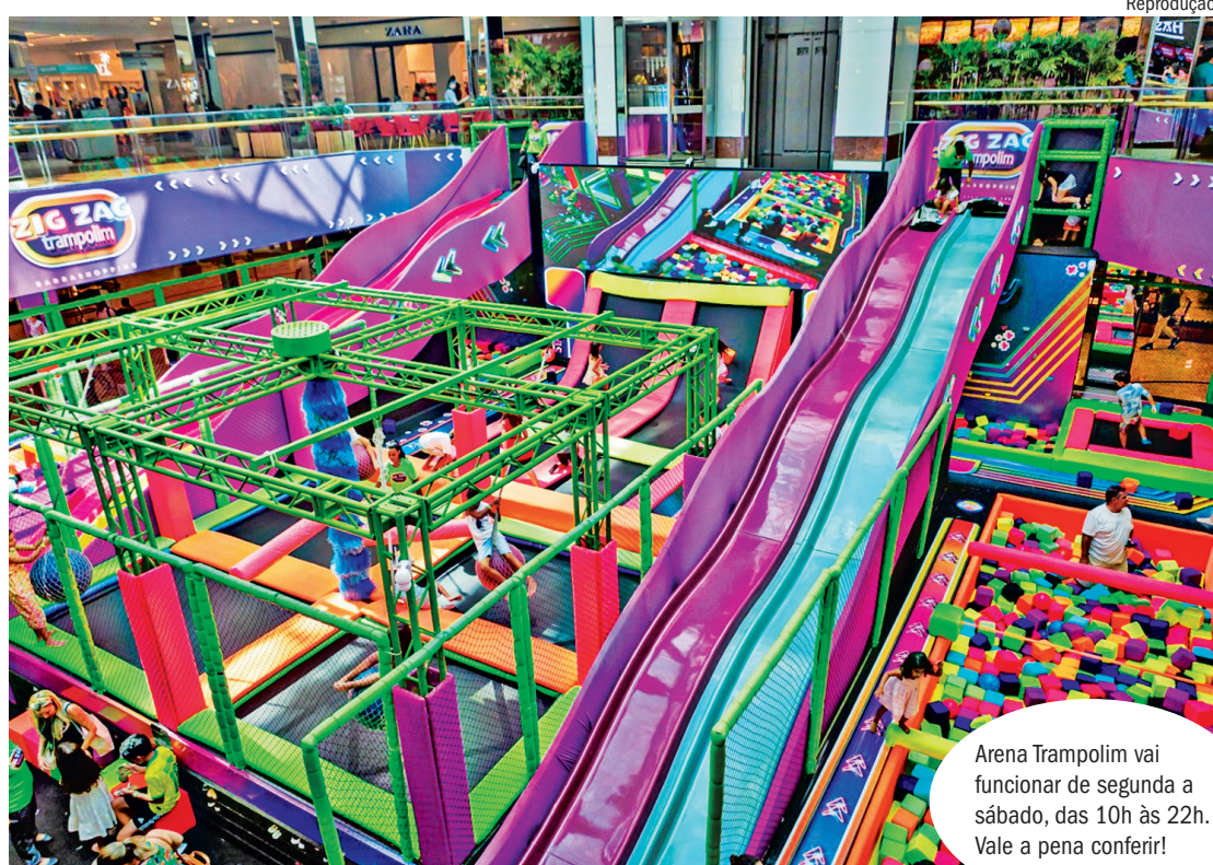
Arena Trampolim vai funcionar de segunda a sábado, das 10h às 22h. Vale a pena conferir!

São muitas atrações para crianças a partir de 3 anos e