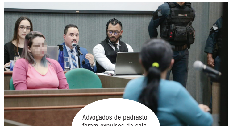
Advogados de padrasto foram expulsos da sala de audiência e encontro foi cancelado pelo juiz