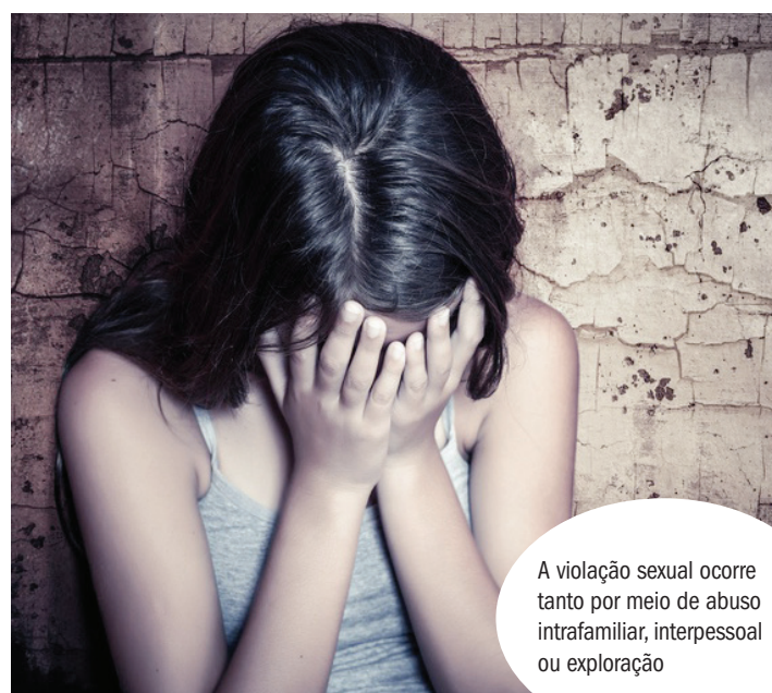
A violação sexual ocorre tanto por meio de abuso intrafamiliar, interpessoal ou exploração

O governo federal publicou, na edição de sexta-feira (19), no Diário Oficial da União, um decreto criando a comissão intersectorial de enfrentamento da violência sexual contra crianças e adolescentes. O objetivo é articular ações e políticas públicas relativas à temática, entre as quais, a revisão e atualização do Plano Nacional de Enfrentamento da Violência Sexual contra Crianças e Adolescentes. A criação da comissão é parte das ações que marcam a passagem do Dia Nacional de Combate ao Abuso e Exploração Sexual de Crianças e Adolescentes, lembrado em 18 de maio.