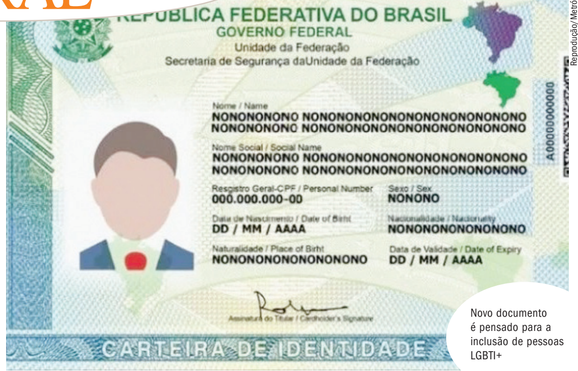
Novo documento é pensado para a inclusão de pessoas LGBTQI+

Os novos parâmetros foram determinados depois que o MDHC (Ministério dos