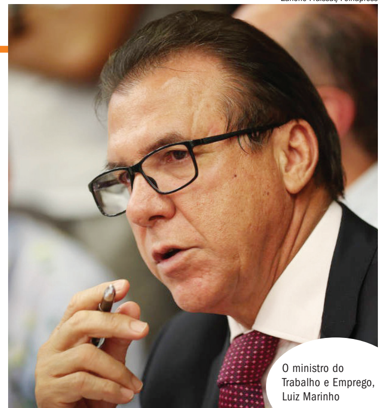
O ministro do Trabalho e Emprego, Luiz Marinho

O crescimento no número de trabalhadores resgatados é visto por auditores e por outros profissionais envolvidos no