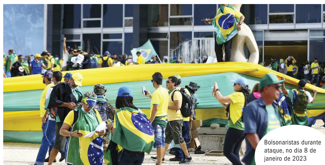
Bolsonaristas durante ataque, no dia 8 de janeiro de 2023

Até o momento, votaram pela abertura de ação penal contra mais 245 pessoas o relator, ministro Alexandre de Moraes, que foi seguido por Dias Toffoli, Cármen Lúcia, Edson Fachin, Rosa Weber e Gilmar Mendes.