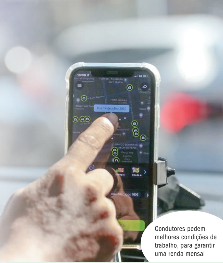
Condutores pedem melhores condições de trabalho, para garantir uma renda mensal

A paralisação foi convocada pela Fembrapp (Federação dos