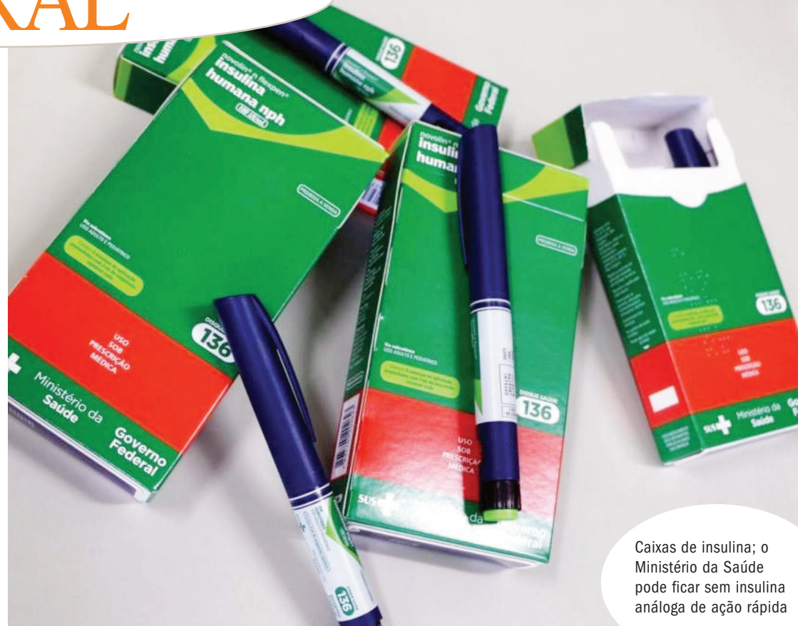
Caixas de insulina; o Ministério da Saúde pode ficar sem insulina análoga de ação rápida

“Cabe informar que as insulinas regulares mais consumidas estão em estoque adequado e o caso da insulina análoga de ação rápida está sendo tratado com máxima prioridade, junto aos fornecedores nacionais e internacionais, para garantir o atendimento da população”, concluiu o ministério.