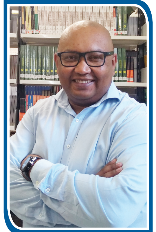
Coordenador do Núcleo de Estudos Afrobrasileiros e Indígenas (Neabi) e professor de Direito, Literatura e Sociologia da Estácio

Nada a se comemorar, muita reflexão, muita luta e muita reverência aos Movimentos Negros, incessantes militantes e lutadores que vêm, desde o Movimento Negro Unificado, conquistando e derrubando barreiras, numa sociedade estruturada pelo racismo.