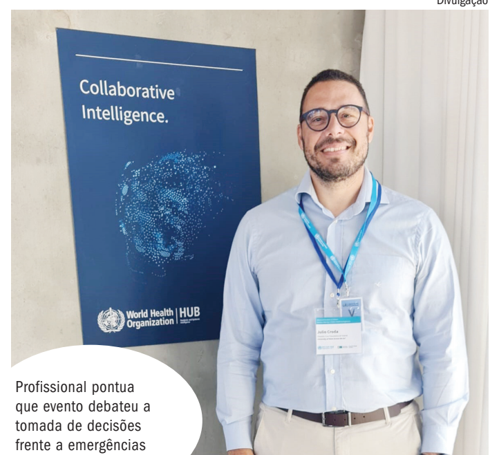
Profissional pontua que evento debateu a tomada de decisões frente a emergências