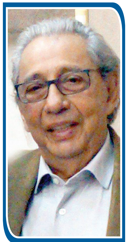
Economista, professor titular aposentado da UFMS e membro da UBE-MS

As CPIs, as derrotas de Lula no Congresso Nacional e os julgamentos de Bolsonaro e seus milicianos são temas que não podem ser negligenciados, mas estão paralisando o Brasil e perpetuando uma crise que não tem a proporção que querem dar para ela. A educação, a saúde, o saneamento básico e a segurança são problemas cruciais que não são resolvidos com alocação de emendas parlamentares. A infraestrutura rodoviária, ferroviária e aeroportuária está abandonada, espendendo recursos orçamentários.