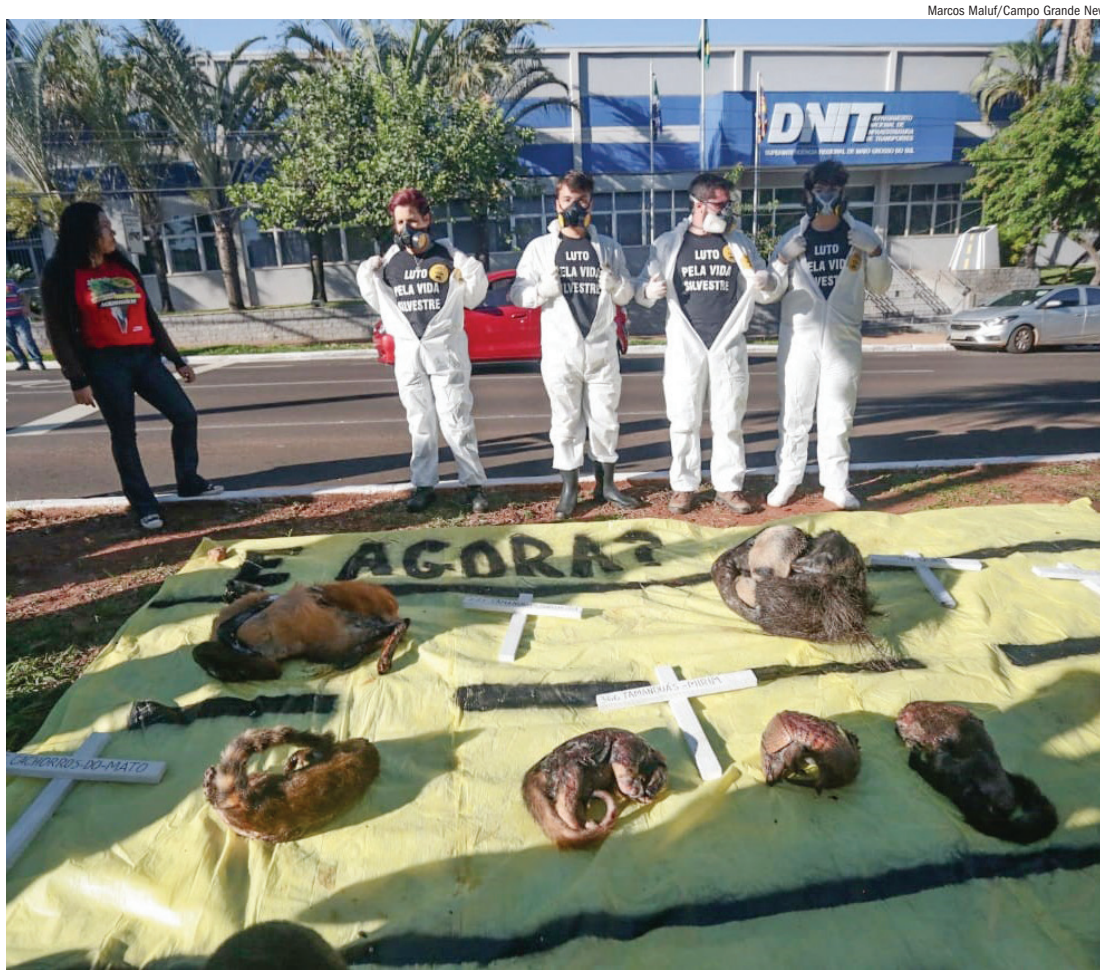
Atropelamento Corpos de animais silvestres, como tatu e lobo-guará, colocados em frente à sede do Dnit. Página A6