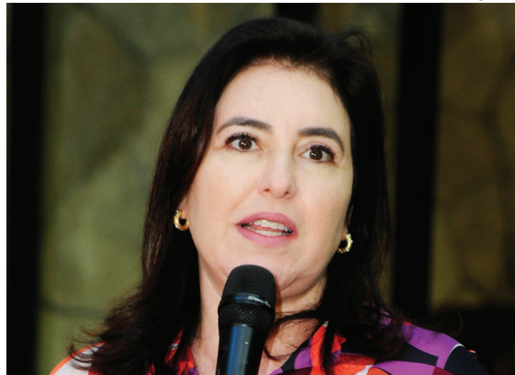
Ministra Simone realiza primeiro compromisso em MS, após ser nomeada