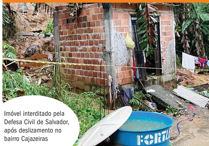
Imóvel interditado pela Defesa Civil de Salvador, após deslizamento no bairro Cajazeiras