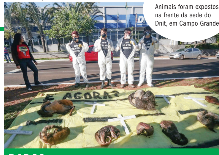
Animais foram expostos na frente da sede do Dnit, em Campo Grande