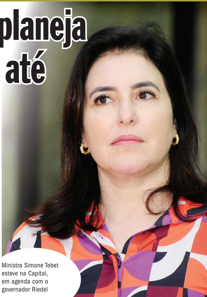
Ministra Simone Tebet esteve na Capital, em agenda com o governador Riedel

“Um Brasil capaz de crescer, se desenvolver, gerar emprego e renda e não deixar ninguém para trás, porque é tão rico, mas com um povo tão pobre. Nós dependemos realmente de reformas que ainda não aconteceram, no Brasil”, concluiu.