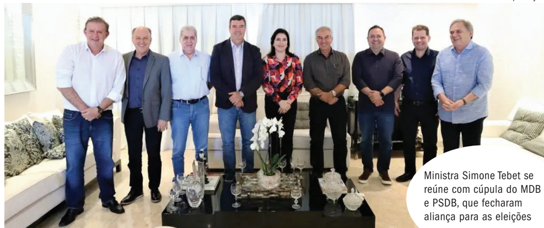
Ministra Simone Tebet se reúne com cúpula do MDB e PSDB, que fecharam aliança para as eleições

Tebet destacou que a questão foi tratada pela executiva do PSDB e do MDB e que ela recebeu o convite dos diretórios, para selar o acordo. Sobre o fato de estar no cargo de ministra do Planejamento e Orçamento, a convite do presidente Lula e os motivos de o MDB não procurar firmar aliança com o PT de MS, Tebet diz que a questão cabe aos presidentes de diretórios e