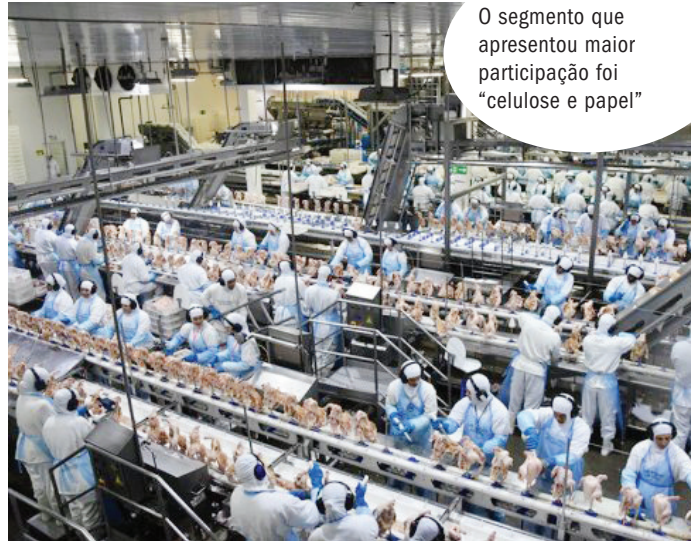
O segmento que apresentou maior participação foi “celulose e papel”