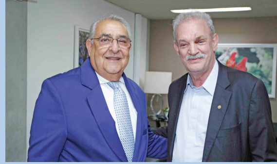
O presidente do Tribunal de Contas de MS, Jerson Domingos, e o deputado federal Geraldo Resende (PSDB)