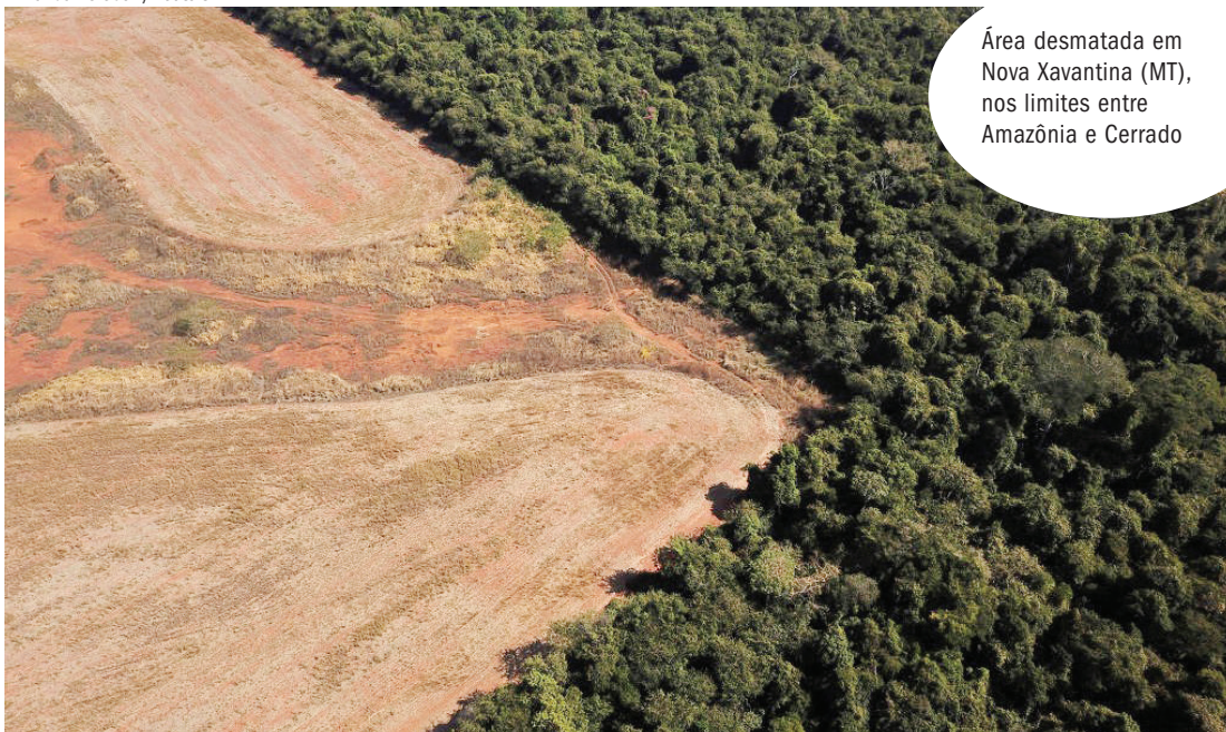
Área desmatada em Nova Xavantina (MT), nos limites entre Amazônia e Cerrado

é publicado pelo Prodes (Projeto de Monitoramento do Desmatamento na Amazônia Legal por Satélite), também do Inpe, duas vezes por ano.