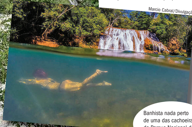
Banhista nada perto de uma das cachoeiras do Parque Nacional da Serra da Bodoquena