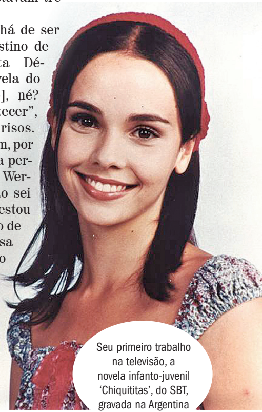
Seu primeiro trabalho na televisão, a novela infanto-juvenil 'Chiquititas', do SBT, gravada na Argentina