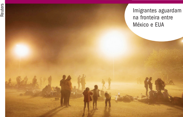
Imigrantes aguardam na fronteira entre México e EUA