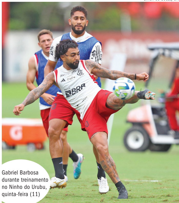
Gabriel Barbosa durante treinamento no Ninho do Urubu, quinta-feira (11)