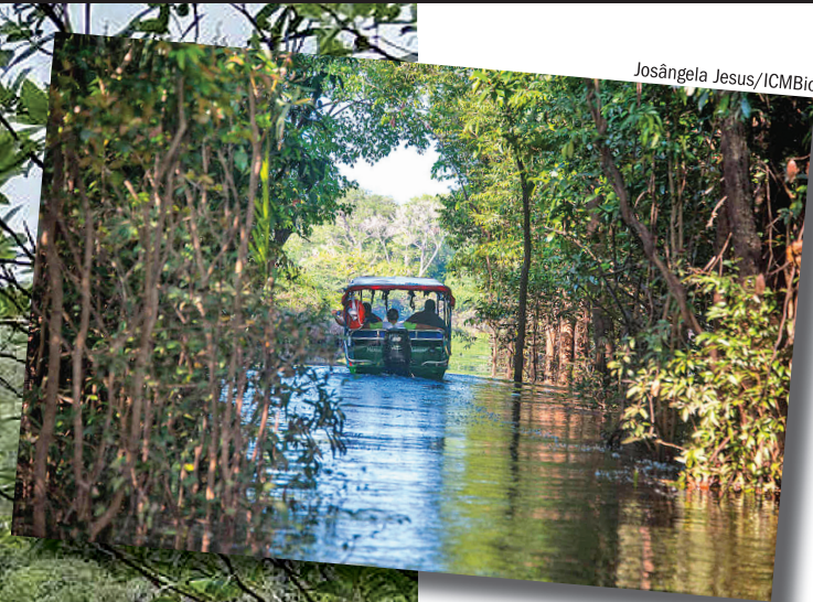
Voadeira navegando pelas trilhas aquáticas do Rio Jaú, no Parque Nacional do Jaú (AM)