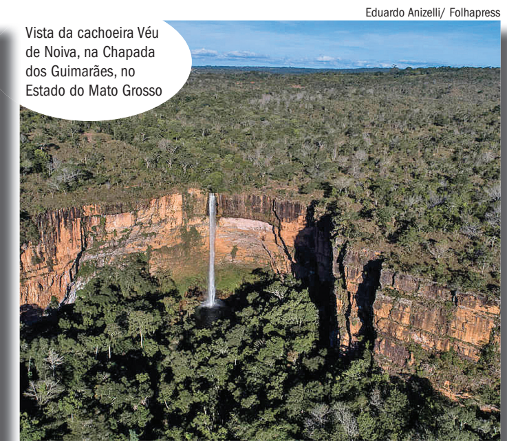
Vista da cachoeira Veu de Noiva, na Chapada dos Guimarães, no Estado do Mato Grosso