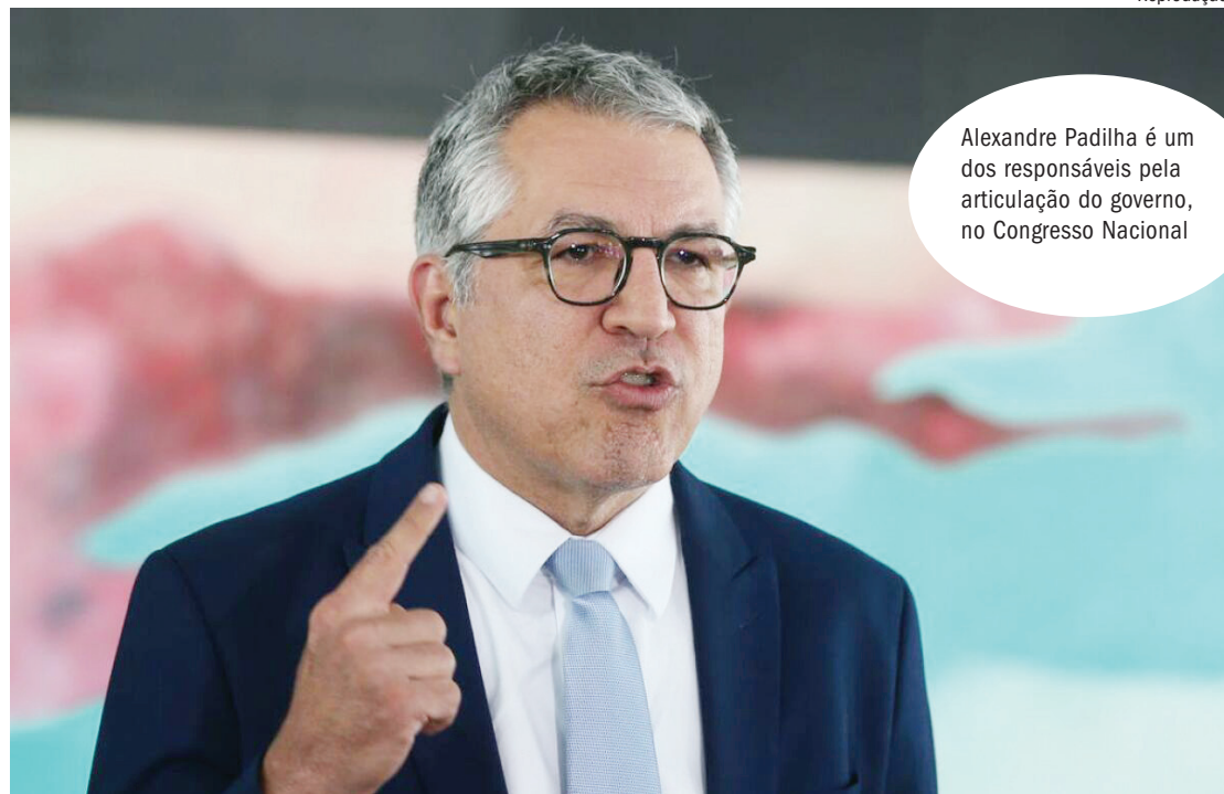
Alexandre Padilha é um dos responsáveis pela articulação do governo, no Congresso Nacional

O ministro afirmou, porém, que agora isso é feito com transparência. “Estamos empenhando os recursos do orçamento de 2023, que são emendas individuais de cada parlamentar, estão inscritas lá, todo mundo sabe quem é, transparência absoluta.”