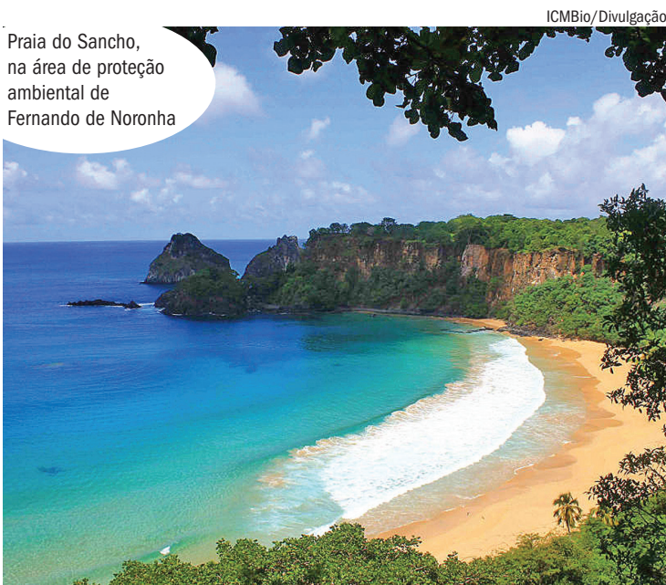
Praia do Sancho, na área de proteção ambiental de Fernando de Noronha