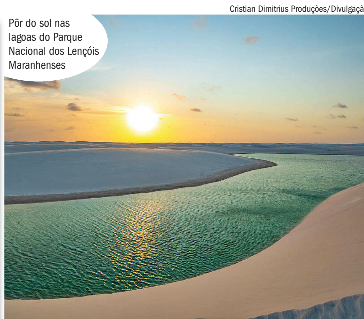
Pôr do sol nas lagoas do Parque Nacional dos Lençóis Maranhenses