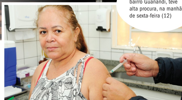
UBS Dona Neta, no bairro Guanandi, teve alta procura, na manhã de sexta-feira (12)

Dourados recebeu ontem (12), o prédio da “nova” escola estadual Castro Alves, localizada na área central da cidade. A reforma integral do prédio vai permitir que o estabelecimento possa ampliar a capacidade em, pelo menos, mais 500 alunos nas 16 salas de aula totalmente reformuladas e no espaço ampliado, inclusive, com a construção do laboratório de pesquisas e da ampla área de refeitório/cozinha. A escola abriga 680 alunos, do 6º ao 9º ano.