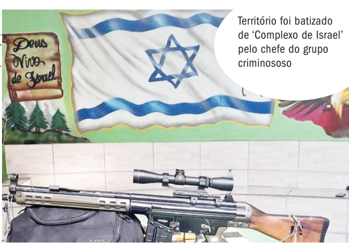
Território foi batizado de ‘Complexo de Israel’ pelo chefe do grupo criminoso

O Complexo de Israel é emblemático, fruto de um fenômeno que alguns pesquisadores têm chamado de “narcopentecosta-