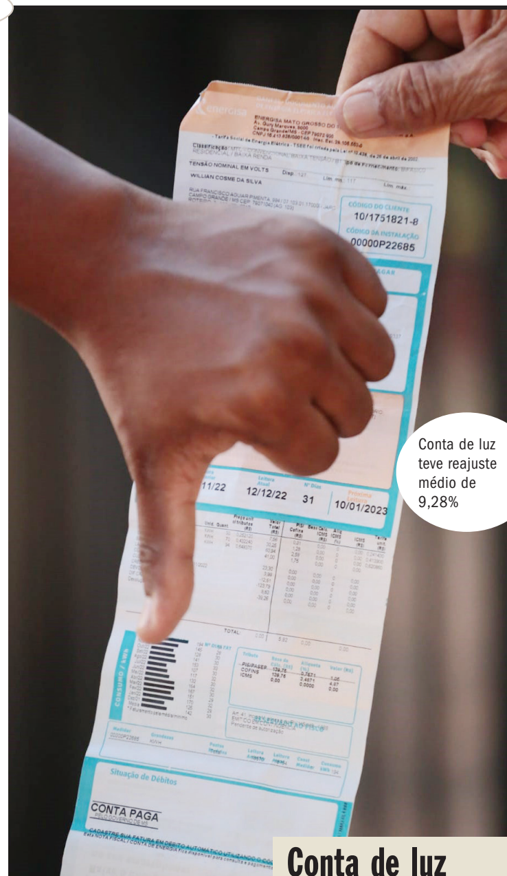
Conta de luz teve reajuste médio de 9,28%

O economista Eugênio Pavão detalha o cenário econômico de Campo Grande, diante da alta da inflação, influenciada pela mudança na conta de energia elétrica.