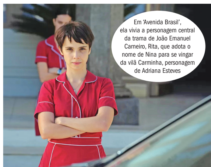
Em 'Avenida Brasil', ela vivia a personagem central da trama de João Emanuel Carneiro, Rita, que adota o nome de Nina para se vingar da vilã Carminha, personagem de Adriana Esteves

panhol o tempo todo, língua que não falava no dia a dia há 20 anos, desde que fez seu primeiro trabalho na televisão, a novela infanto-juvenil “Chiquititas”, do SBT, gravada na Argentina. “Entre na última temporada, e era uma coisa incrível, primeiro eles gravavam a novela argentina e, no ano seguinte, chegava um monte de atores, atrizes, pais e mães das crianças e tal, todos brasileiros, para aproveitar a estrutura e refilmar a novela em português, para o SBT”, lembra.