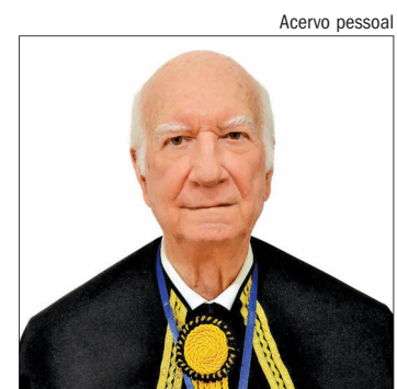
Membro da AMLMS - Cadeira 22

São três letras apenas, As desse nome bendito: Três letrinhas, nada mais E nelas cabe o infinito E palavra tão pequena Confessam mesmo os ateus És do tamanho do céu E apenas menor do que Deus! Para louvar a nossa mãe, Todo bem que se disser Nunca há de ser tão grande Como o bem que ela nos quer. Palavra tão pequenina, Bem sabem os lábios meus Que és do tamanho do CÉU E apenas menor que Deus!