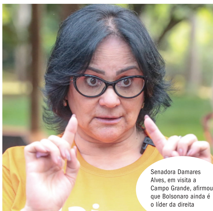
Senadora Damares Alves, em visita a Campo Grande, afirmou que Bolsonaro ainda é o líder da direita

A senadora faz parte da CPMI dos atos de 8 de janeiro e comentou sobre outras comissões de investigação. Segundo ela, haverá muito diálogo entre todas, no que se refere à oposição. “Estou na CPMI dos atos de 8 de janeiro. Gostaria de estar também na CPI (da Câmara Federal) do MST. Existe mais uma CPI, que é das ONGs (Organização Não Governamental), no Senado, e vamos dialogar muito. Nós temos, no campo, algumas ONGs que estão provocando mais tensão do que ajudando e algumas a serviço do Movimento Sem-Terra. Então, queremos entender quem financia essas organizações, quais os verdadeiros motivos delas. Até onde elas vão?”, disse, lembrando que, na Amazônia, por exemplo, existem várias