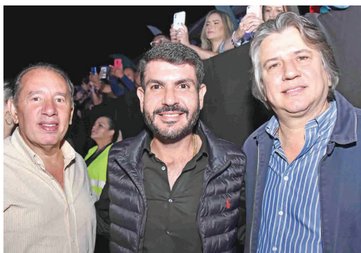
O presidente da Assembleia Legislativa de MS, Gerson Claro (PP), com o deputado estadual Jamilson Name (PSDB) e o secretário de Governo e Gestão Estratégica do MS, Pedro Caravina

A Confraria BPW-CG reúne-se no dia 20, a Tarde das Mães também será em 20 de maio. No dia 22, estão programados a Escola Mães Luz, além do Projeto Socioeducativo Harmonia e Frutos, eventos na agitada agenda de maio das dinâmicas ativistas da Associação de Mulheres de Negócios e Profissionais de Campo Grande.