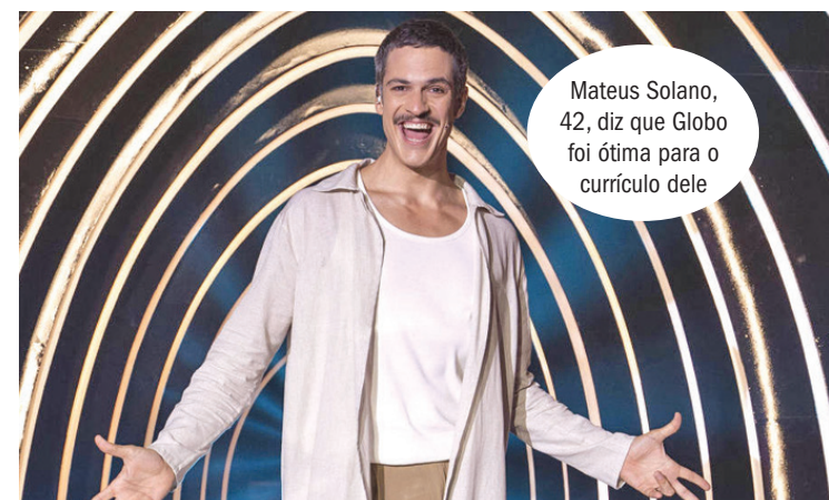
Mateus Solano, 42, diz que Globo foi ótima para o currículo dele