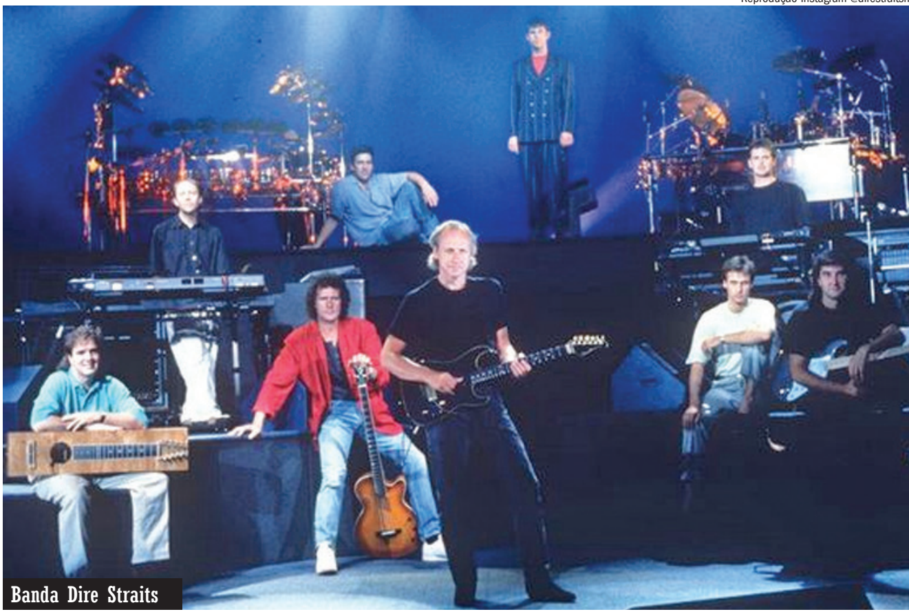
Banda Dire Straits

Hoje (12), tem mais uma edição do Quintal Sesc, no estacionamento da loja Riachuelo, do shopping Campo Grande, começando às 18h, com