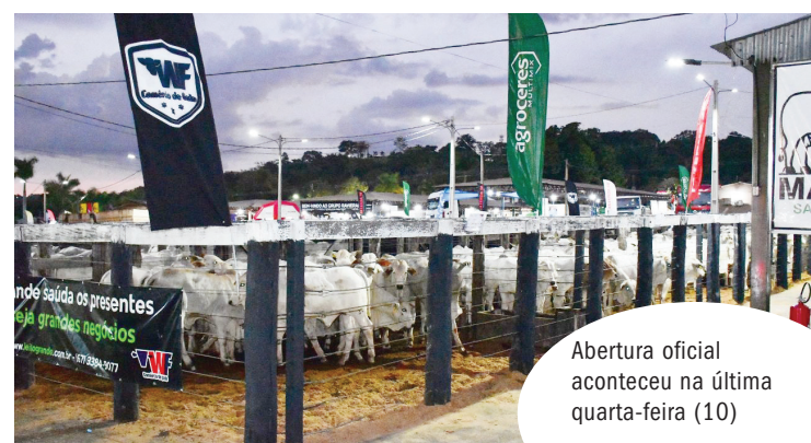
Abertura oficial aconteceu na última quarta-feira (10)