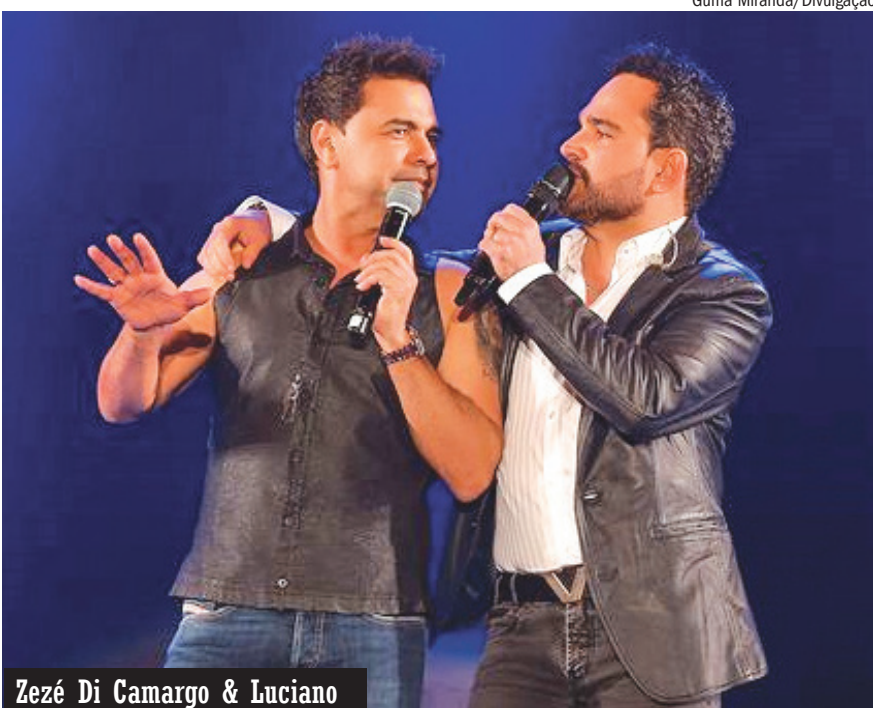
Zezé Di Camargo &amp; Luciano