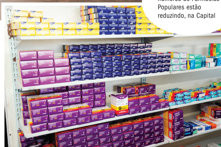
Sem novas adesões, números de Farmácias Populares estão reduzindo, na Capital