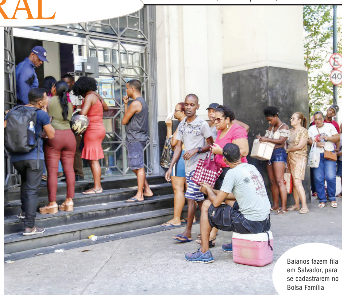
Baianos fazem fila em Salvador, para se cadastrarem no Bolsa Família

Mas ambos mostram que, sem crescimento sustentável alavancado por reformas pró-mercado, usar dinheiro público para combater as mazelas sociais funciona por um tempo, mas não se sustenta. Pois é dos impostos gerados pela atividade que vêm os recursos para essas ações.