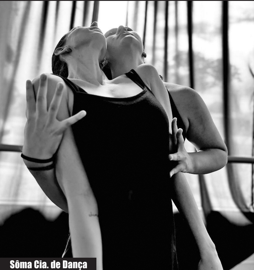
Sôma Cia. de Dança