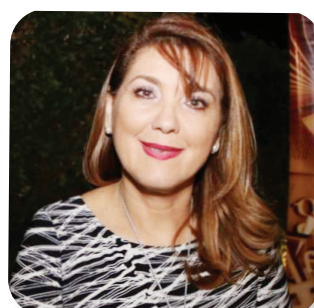
Professora da Universidade Federal de Mato Grosso do Sul

Os dias têm sido difíceis nessa tentativa de não nos perdermos nas figuras de morte escatológica, não nos perdermos na marginalização indigna dos que não fazem parte de nada, não sermos devorado pela caçada antropofágica dos cães sociais ou sermos calado no estreito safari doméstico sentimental que nos deixa nessa observação caótica de tudo e sem forças