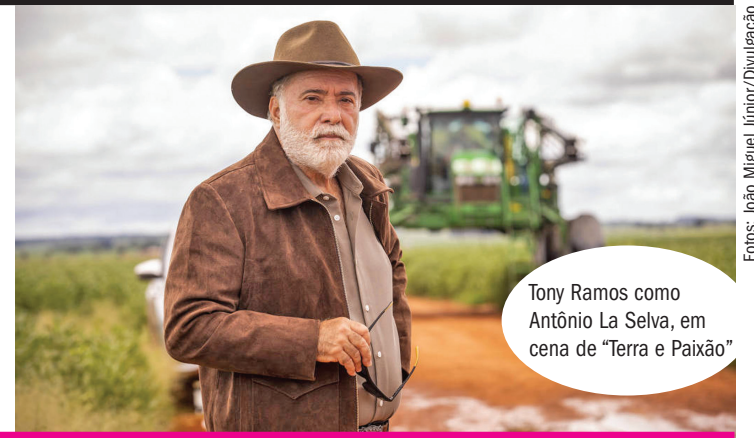
Tony Ramos como Antônio La Selva, em cena de "Terra e Paixão"