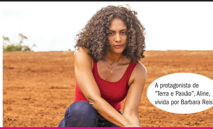
A protagonista de "Terra e Paixão", Aline, vivida por Barbara Reis