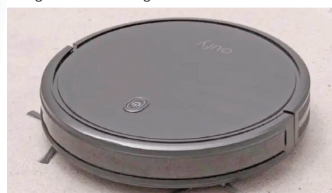
Existe uma gama de aspiradores robóticos com funcionalidades inteligentes.

Conheça alguns aparelhos domésticos inteligentes e saiba como começar a montar sua residência com eles