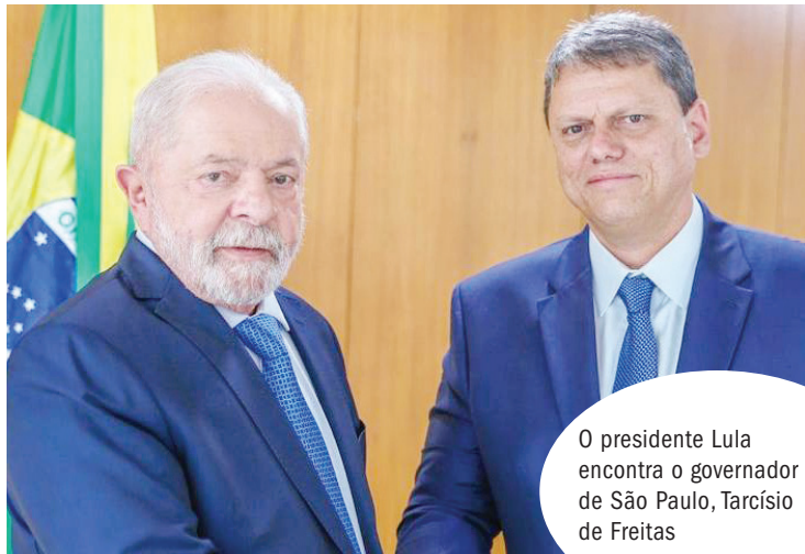
O presidente Lula encontra o governador de São Paulo, Tarcísio de Freitas