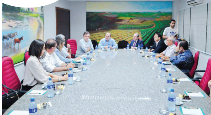
Reunião na segunda-feira, entre Famasul, governo do Estado e parlamentares