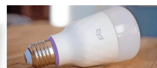
A Philips Hue fornece várias lâmpadas, acessórios e luminárias inteligentes.