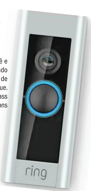
Proteja você e sua casa usando campainhas de vídeo de toque.