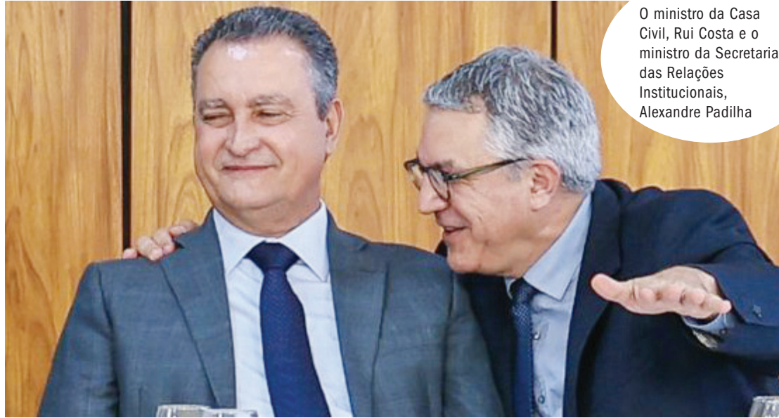
O ministro da Casa Civil, Rui Costa e o ministro da Secretaria das Relações Institucionais, Alexandre Padilha

principalmente, a atuação dos ministros Alexandre Padilha (Secretaria de Relações Institucionais) e Rui Costa (Casa Civil) na articulação política.