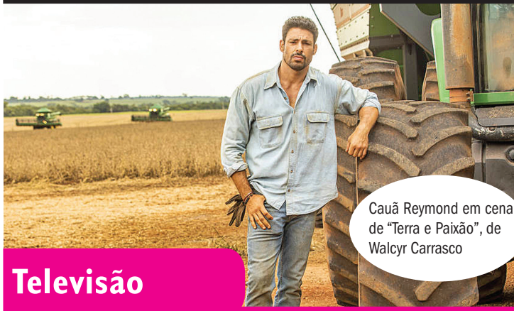
Cauã Reymond em cena de "Terra e Paixão", de Walcyr Carrasco