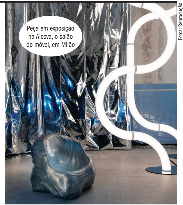
Peça em exposição na Alcova, o salão do móvel, em Milão