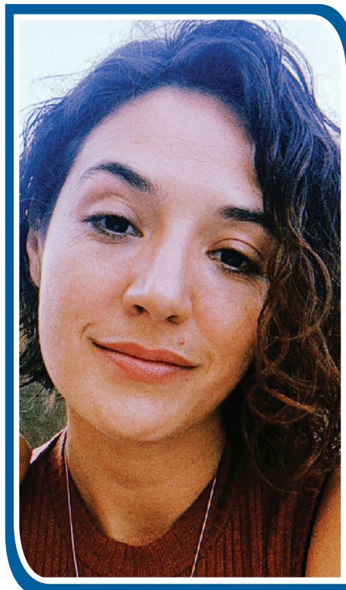
Pedagoga e doutoranda em Educação, pela UFMS

Ou os homens aprendem a respeitar as mulheres e entendem que elas são pessoas com direitos como os deles e que devem ser respeitadas, como tal, ou eles continuarão sofrendo, às sombras de seus próprios atos.