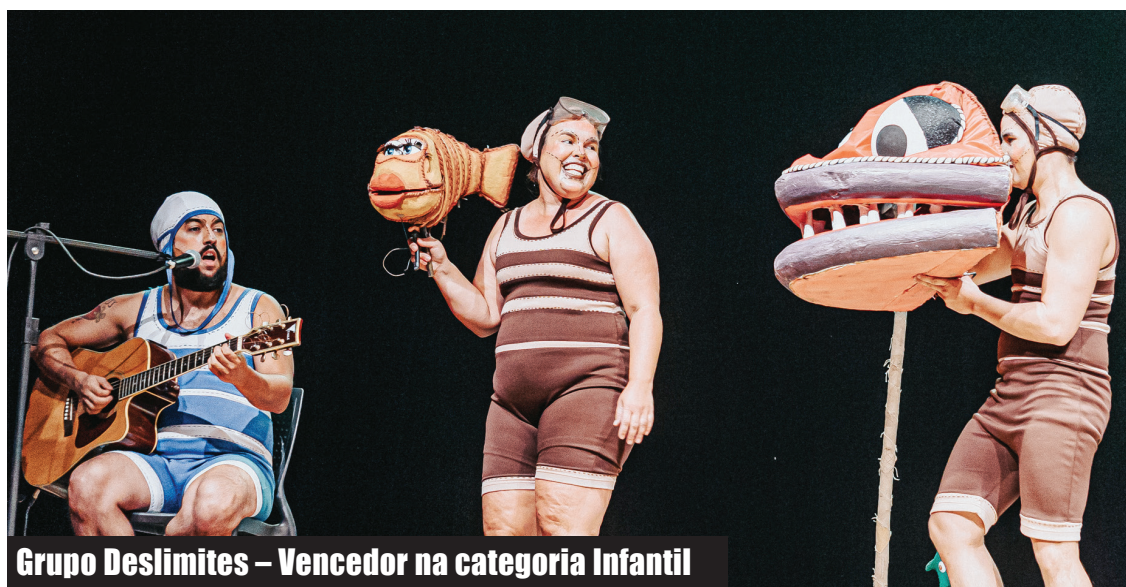
Grupo Deslimites – Vencedor na categoria Infantil