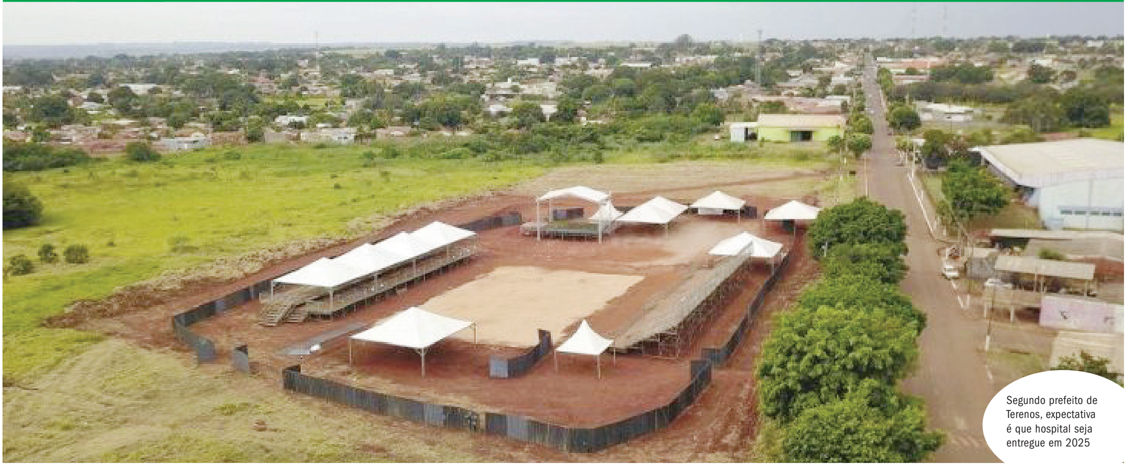
Segundo prefeito de Terenos, expectativa é que hospital seja entregue em 2025