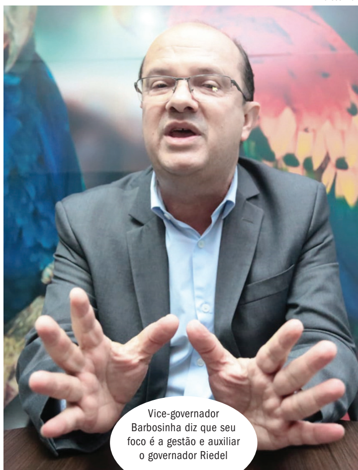
Vice-governador Barbosinha diz que seu foco é a gestão e auxiliar o governador Riedel

o senador Nelsinho, mas foi rápido e não falamos sobre política. Mas, é um nome muito forte, é senador da República, foi prefeito da Capital e obviamente que deve ter o seu planejamento político. Mas nós não chegamos a dialogar acerca de eleições de 2024 e nem de 2026.