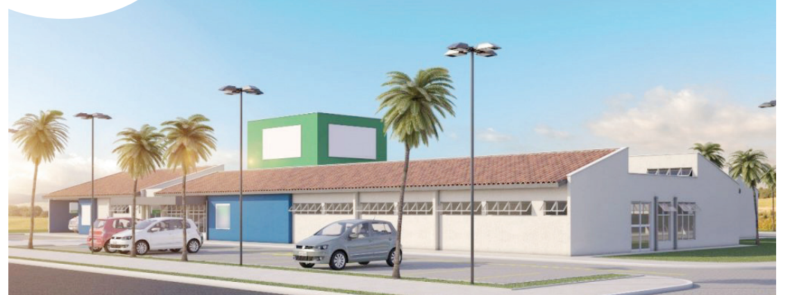
Projeto prevê estrutura construída em área de 1,2 mil metros quadrados

Cabe ressaltar que a construção do hospital de Terenos é uma parceria da Prefeitura municipal com o governo do Estado de Mato Grosso do Sul que, conforme o prefeito, disponibilizou cerca de R$ 4 milhões para a obra.