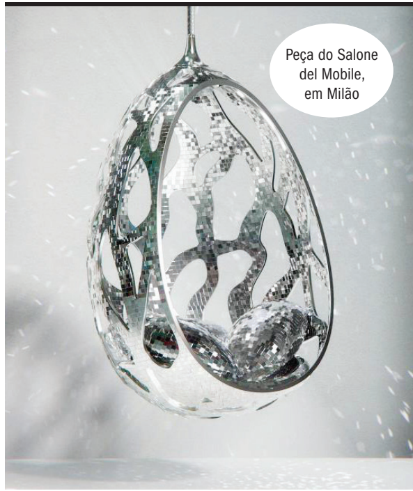
Peça do Salone del Mobile, em Milão