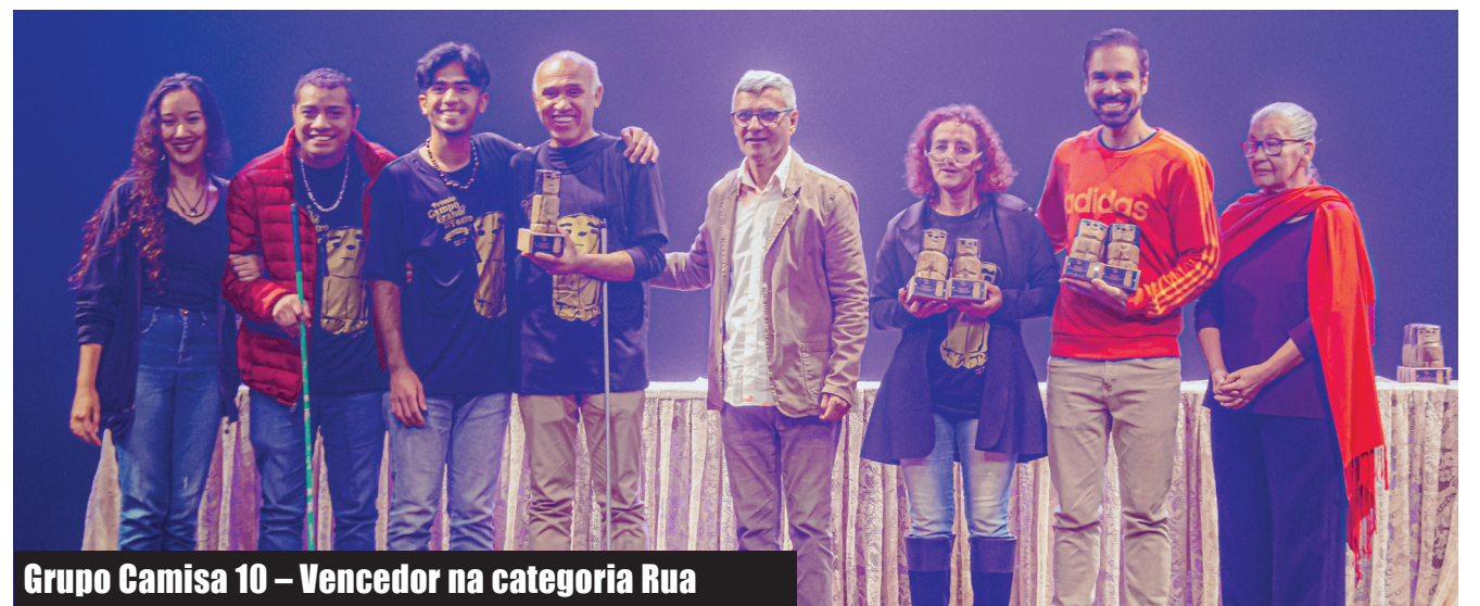
Grupo Camisa 10 – Vencedor na categoria Rua

atro é uma tarefa árdua, então é um incentivo para seguirmos em frente. É um reconhecimento do nosso trabalho, desejamos vida longa a esse espetáculo. Mais do que a concorrência, é interessante a confraternização com a classe teatral, pois, nessa premiação, encontramos muitos amigos de trabalho”, ressaltou a diretora do grupo, que também foi premiada na categoria “Melhor Iluminação” e “Melhor Sonoplastia”.