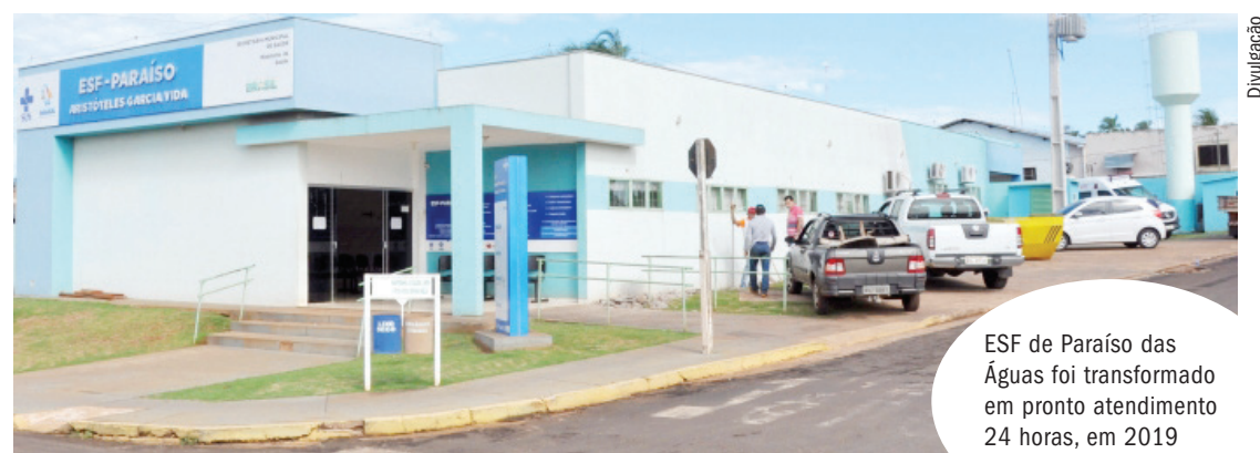
ESF de Paraíso das Águas foi transformado em pronto atendimento 24 horas, em 2019

Em relação à criação de hospitais por região, ele afirma que é algo que está em construção e as secretarias estão caminhando junto com o governo do Estado. “Estamos trabalhando para dar mais au-