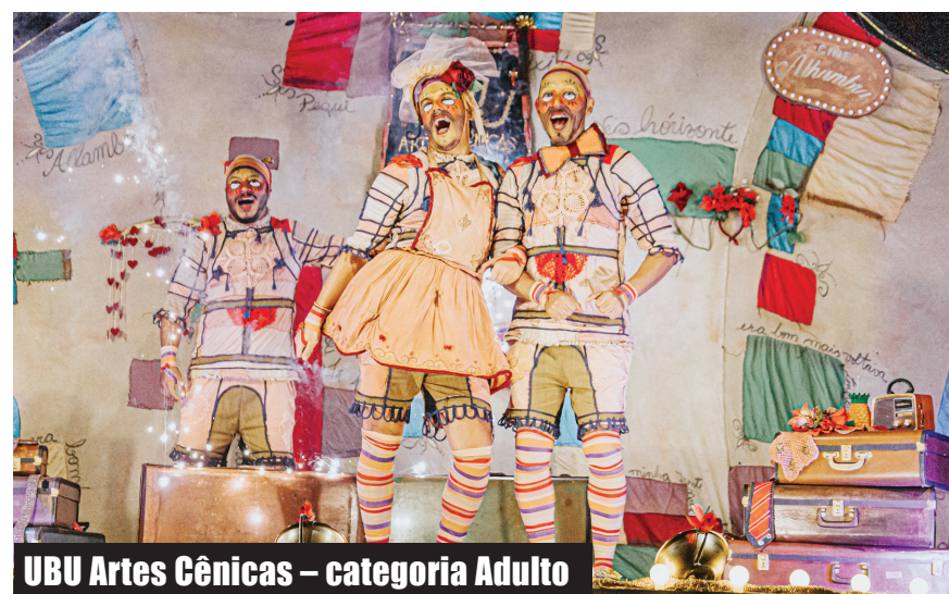
UBU Artes Cênicas – categoria Adulto