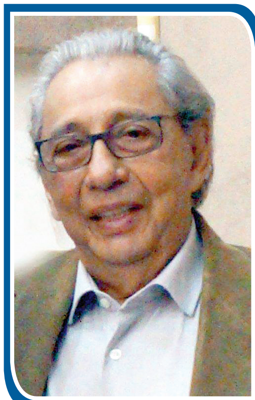
Economista, professor titular aposentado da UFMS e membro da UBE-MS