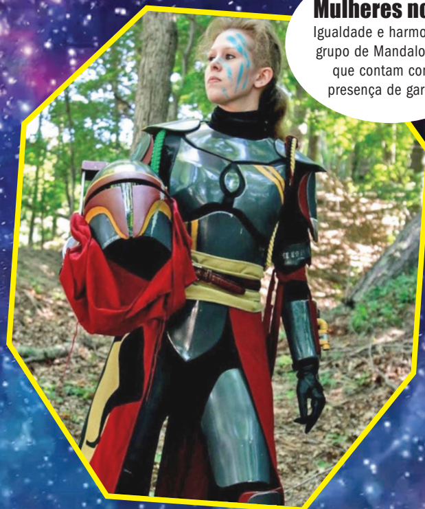
Mulheres no clã Igualdade e harmonia no grupo de Mandalorianos que contam com a presença de garotas