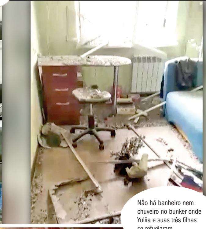
Não há banheiro nem chuveiro no bunker onde Yuliia e suas três filhas se refugiaram