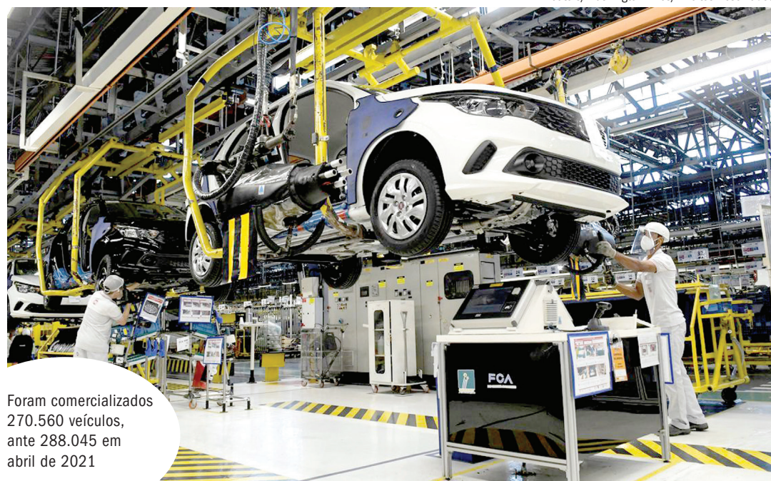
Foram comercializados 270.560 veículos, ante 288.045 em abril de 2021

“Temos notado uma recuperação gradativa nos encampamentos. Apesar de ainda estarmos em retração, no acumulado do ano, notamos que, no fechamento do primeiro bimestre de 2022, o volume estava cerca de 13% menor se comparado a igual período de 2021. Agora, a retração caiu para pouco mais de 7%, o que sinaliza um movimento de retomada”, destacou o presidente da Fe-