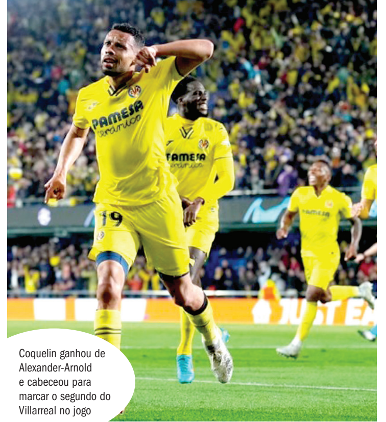
Coquelein ganhou de Alexander-Arnold e cabeceou para marcar o segundo do Villarreal no jogo

O Liverpool sofreu, mas conseguiu vaga na decisão