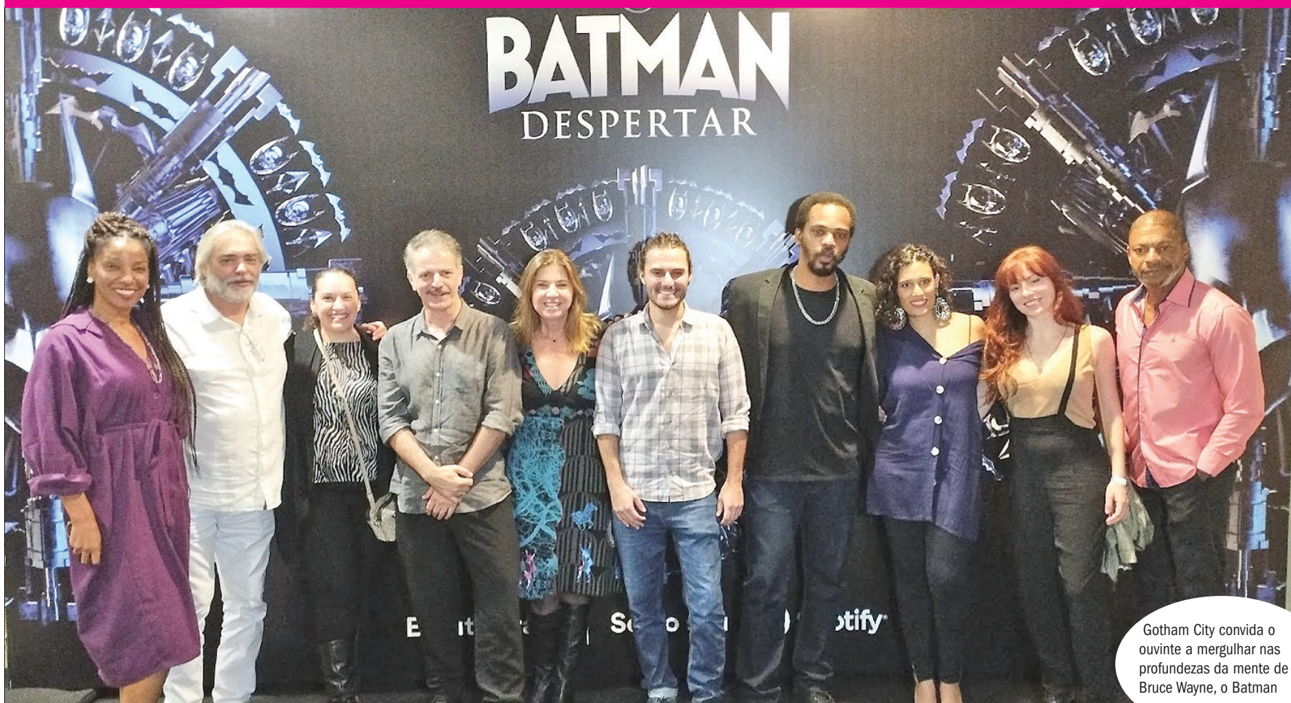
Gotham City convida o ouvinte a mergulhar nas profundezas da mente de Bruce Wayne, o Batman