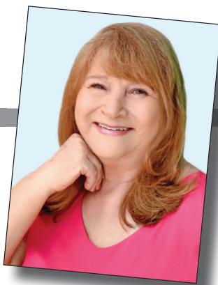
*Professora, cronista e poeta

II Ovelha é fofa nuvem do chão. Nuvem, fofa ovelha do céu. As quatro patas ficam por conta da sua imaginação.”