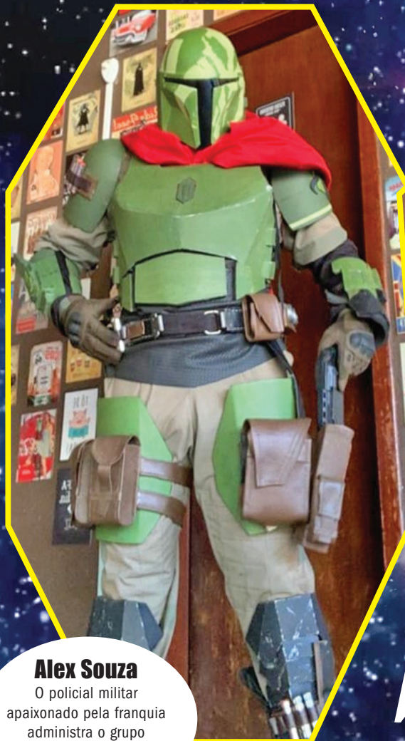
Alex Souza O policial militar apaixonado pela franquia administra o grupo que tem integrantes de todo o país