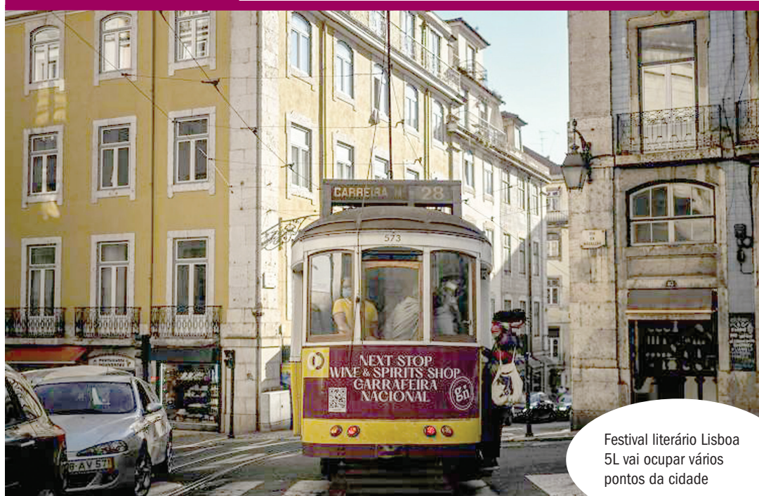
Festival literário Lisboa 5L vai ocupar vários pontos da cidade