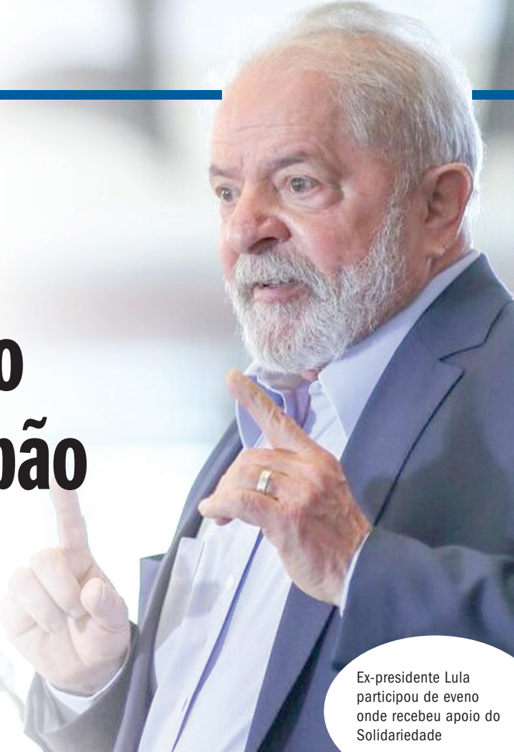
Ex-presidente Lula participou de evento onde recebeu apoio do Solidariedade

O petista estava acompanhado do ex-governador Geraldo Alekmin (PSB), que irá compor a chapa presidencial como vice-presidente, e de