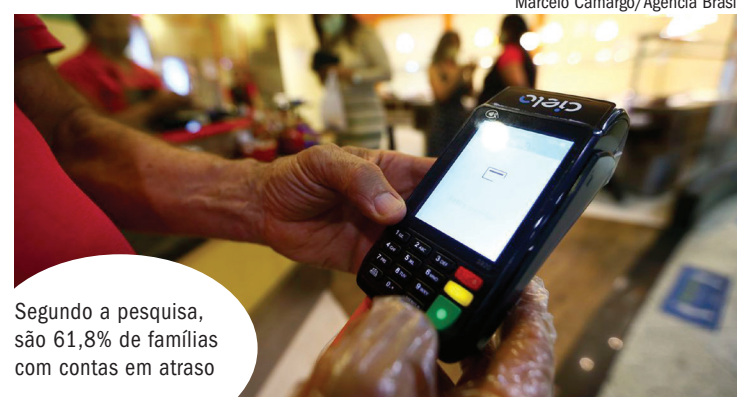
Segundo a pesquisa, são 61,8% de famílias com contas em atraso

Em relação às condições de pagamento, 14,1% acham que conseguem pagar; 31,3% parcialmente e 42,8% acreditam que não conseguirão pagar. (IC)