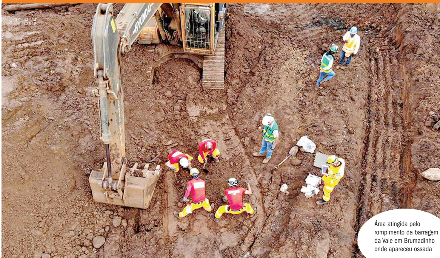
Área atingida pelo rompimento da barragem da Vale em Brumadinho onde apareceu ossada