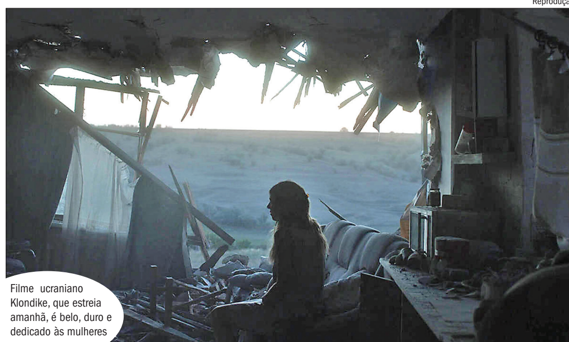
Filme ucraniano Klondike, que estreia amanhã, é belo, duro e dedicado às mulheres