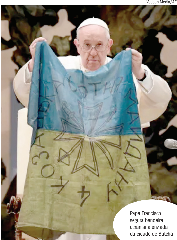
Papa Francisco segura bandeira ucraniana enviada da cidade de Butcha

domingo, o pontífice reiterou o pedido para que os corredores humanitários em Mariupol, cidade fortemente atingida por bombardeios, sejam abertos para a retirada de civis.