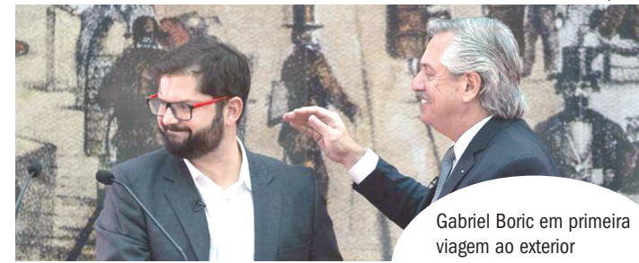
Gabriel Boric em primeira viagem ao exterior