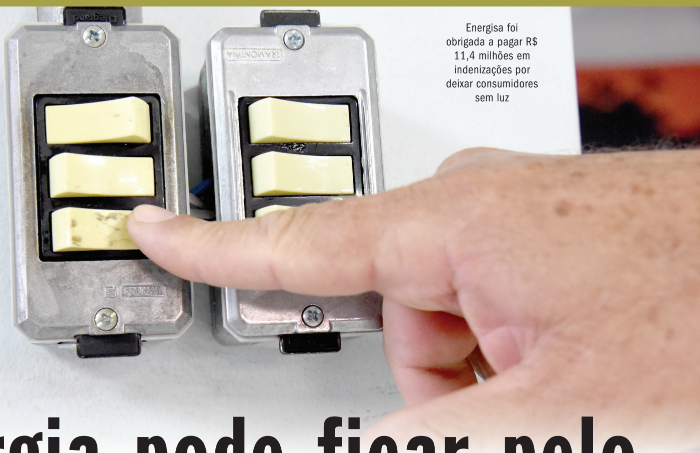
Energisa foi obrigada a pagar R$ 11,4 milhões em indenizações por deixar consumidores sem luz

Definição acontece nesta terça-feira, durante Reunião Pública Ordinária de Diretoria da Aneel