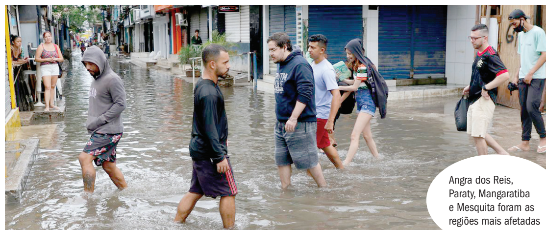
Angra dos Reis, Paraty, Mangaratiba e Mesquita foram as regiões mais afetadas

As chuvas que atingiram o Estado do Rio de Janeiro entre a noite de sexta-feira (1º) e a madrugada de sábado (2) deixaram 17 mortos, a maioria no litoral sul. Segundo o Corpo de Bombeiros, o município com maior número de óbitos é Angra dos Reis, onde dez corpos foram resgatados de um deslizamento de terra. Em Paraty, foram seis óbitos por soterramento. Em Mesquita, na Baixada Fluminense, um homem morreu eletrocutado. Os bombeiros ainda buscam cinco desaparecidos no sul do estado, sendo quatro em Angra dos Reis e um em Paraty. Um menino, resgatado com vida pelos bombeiros em Paraty, foi internado em estado gravíssimo no Hospital Estadual Adão Pereira Nunes, em Duque de Caxias, na Baixada. Segundo a Prefeitura de Duque de Caxias, o menino está respirando com a ajuda de ventilação mecânica no