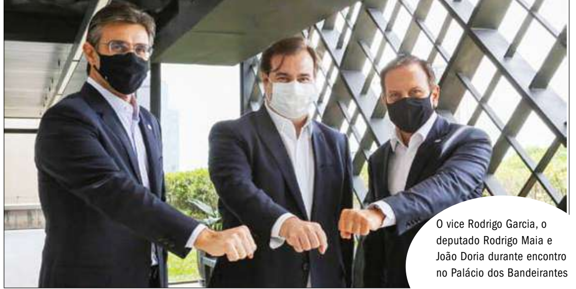
O vice Rodrigo Garcia, o deputado Rodrigo Maia e João Doria durante encontro no Palácio dos Bandeirantes