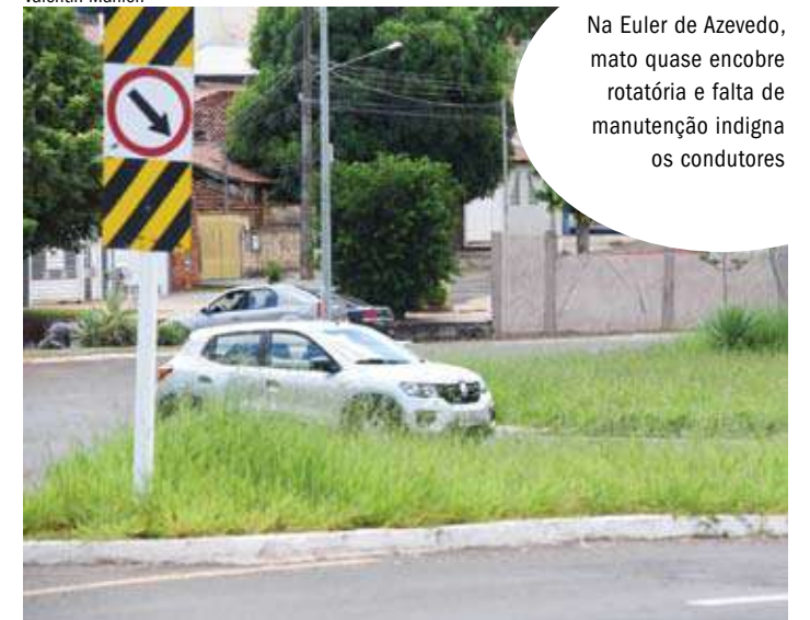
Na Euler de Azevedo, mato quase encobre rotatória e falta de manutenção indigna os condutores