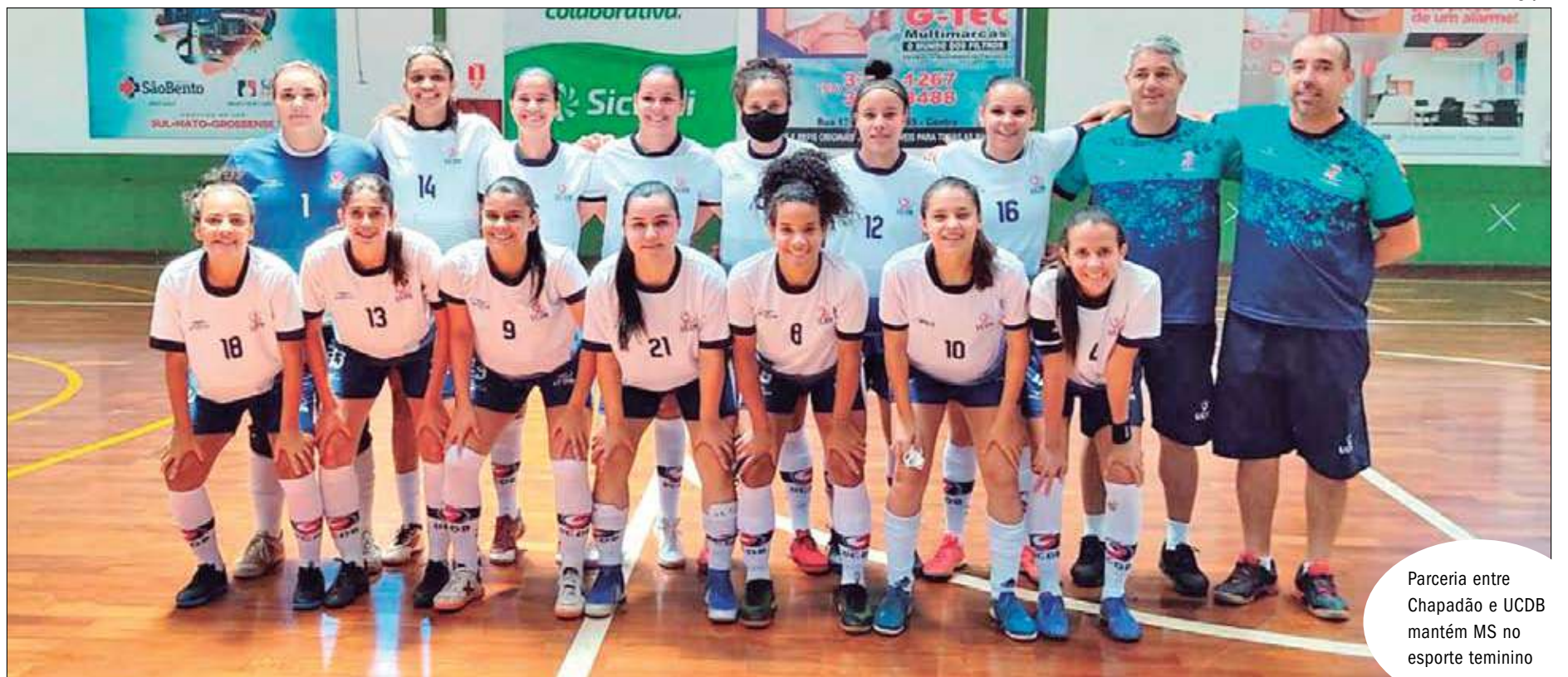
Parceria entre Chapadão e UCDB mantém MS no esporte feminino