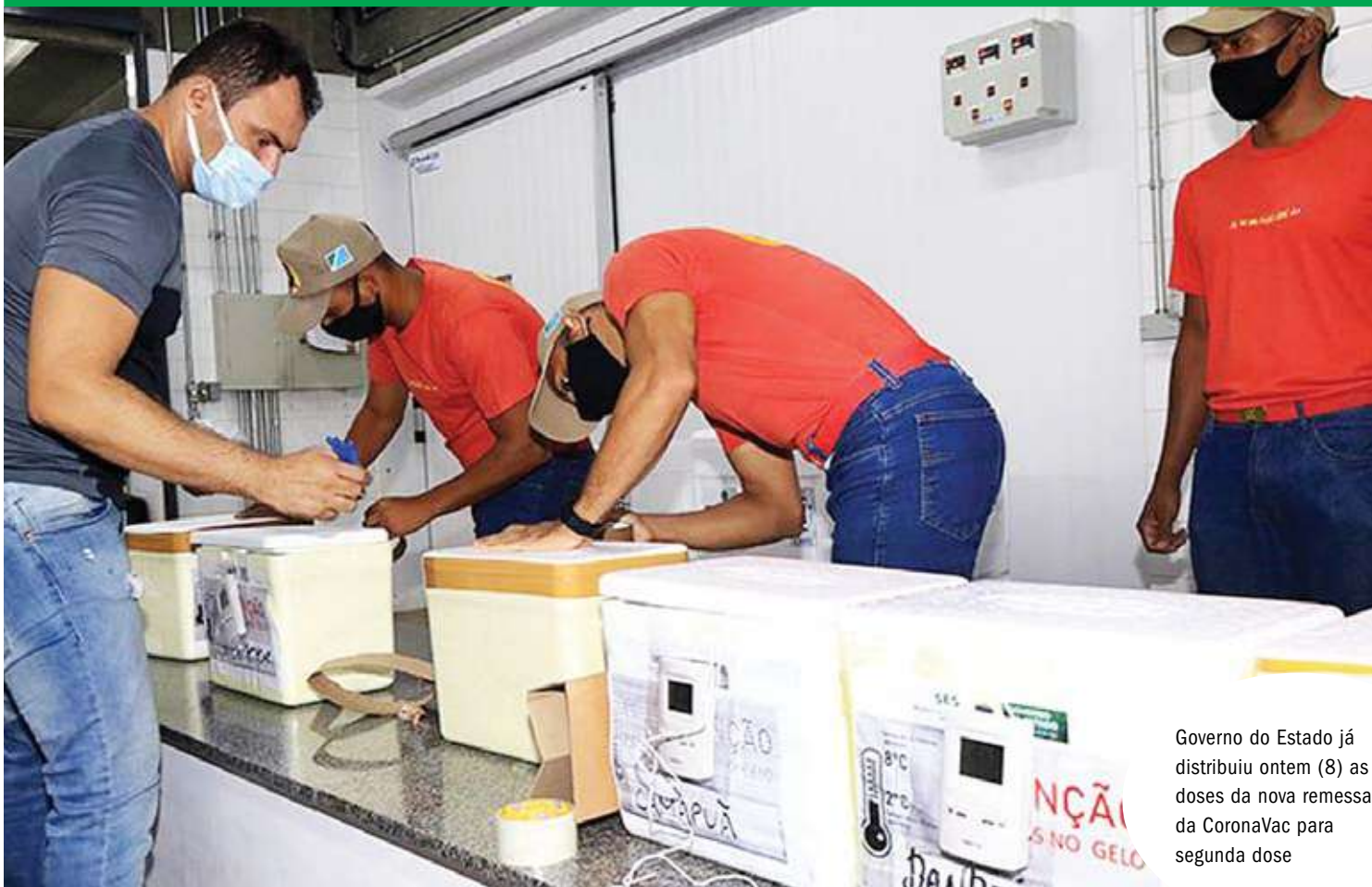
Governo do Estado já distribuiu ontem (8) as doses da nova remessa da CoronaVac para segunda dose