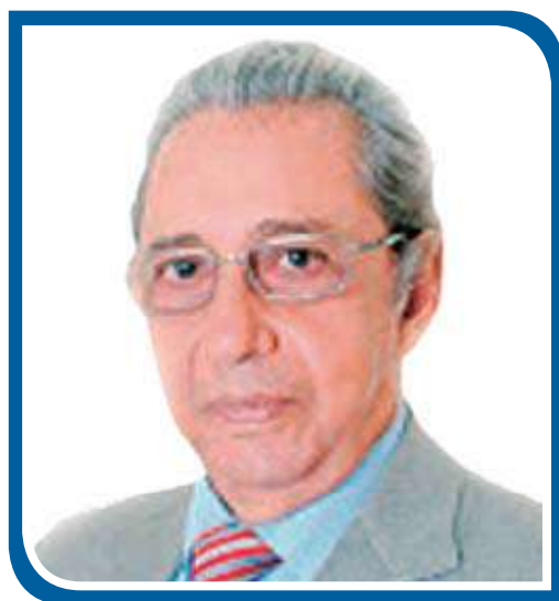
Economista e professor universitário com doutorado.

Bolsonaro não é culpado pelo governo que está fazendo. Ele não está preparado para o cargo, mas não é culpado. Os culpados são os eleitores que o elegeram fugindo do “lulopetismo”, da corrupção e dos políticos de 2018. Ele nunca teve um plano de governo ou qualquer proposta de governabilidade para o país; sempre foi autoritário; sempre chamou índios e quilombolas de vagabundos; sempre defendeu a liberação dos agrotóxicos e a expansão do agronegócio na floresta amazônica e no pantanal; sempre foi contra a es-