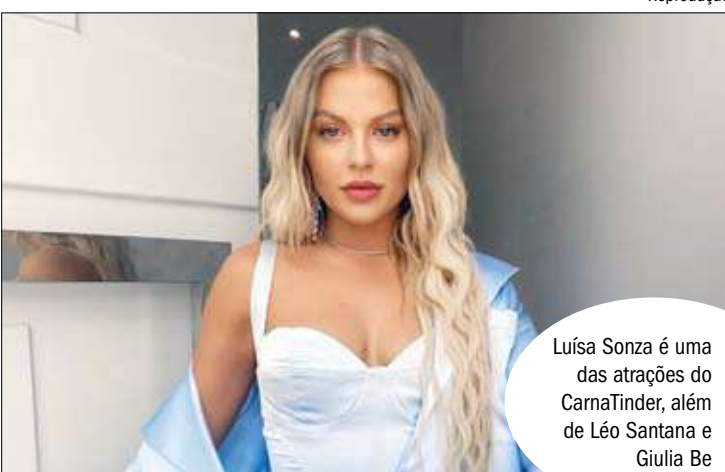
Luísa Sonza é uma das atrações do CarnaTinder, além de Léo Santana e Giulia Be

Para acessar esse servidor (de 18+) você precisa ter uma cópia legítima do jogo instalada e se inscrever: