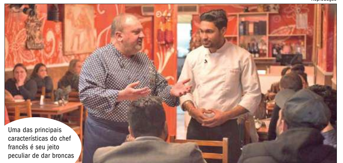
Uma das principais características do chef francês é seu jeito peculiar de dar broncas

"Depois que passa na TV, muita gente quer conhecer e vai lá. Mas muitas vezes os próprios donos do restaurante não imaginam e não são preparados. A gente avisa, ajuda, tenta preparar o ambiente, mas eles não imaginam que vai ter fila no dia seguinte. Esse é o grande problema pós-programa", analisa o chef mais engraçado do momento.