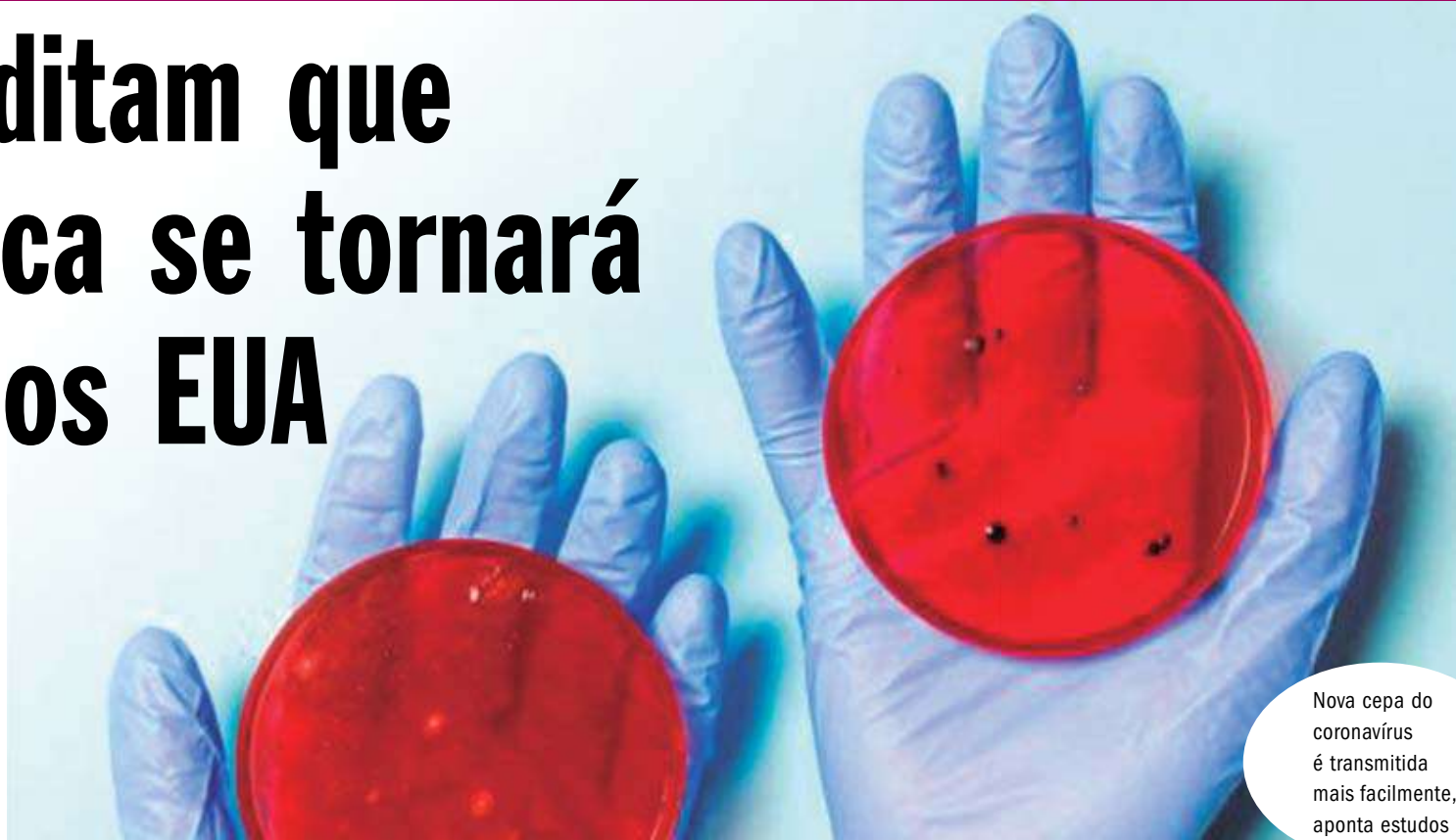
Nova cepa do coronavírus é transmitida mais facilmente, aponta estudos

Com frequências ainda relativamente baixas das variantes B.1.1.7, B.1.351 (África do Sul) e P.1 (Brasil), ainda há tempo para colocar em ação programas de vigilância necessários e ações de mitigação. “A menos que medidas decisivas e imediatas de saúde pública sejam tomadas, o aumento taxa de transmissão dessas linhagens provavelmente terá consequências devastadoras para a mortalidade e morbidade da COVID-19 nos EUA em poucos meses”, concluem os pesquisadores.