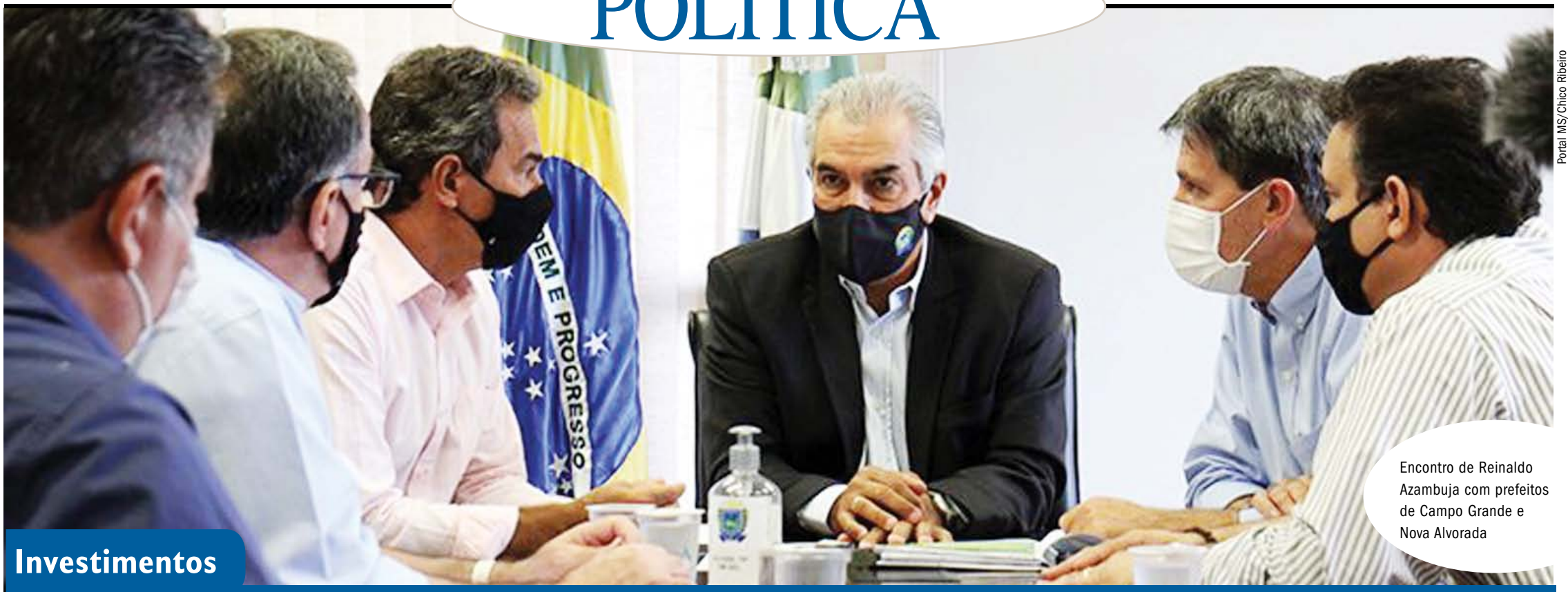
Encontro de Reinaldo Azambuja com prefeitos de Campo Grande e Nova Alvorada