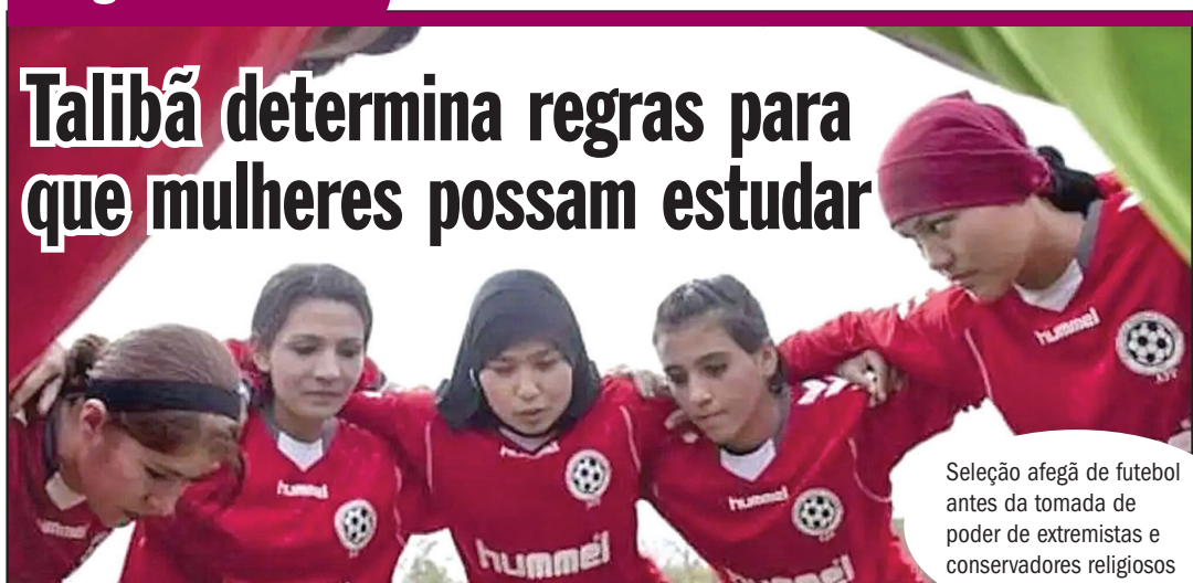
Seleção afegã de futebol antes da tomada de poder de extremistas e conservadores religiosos