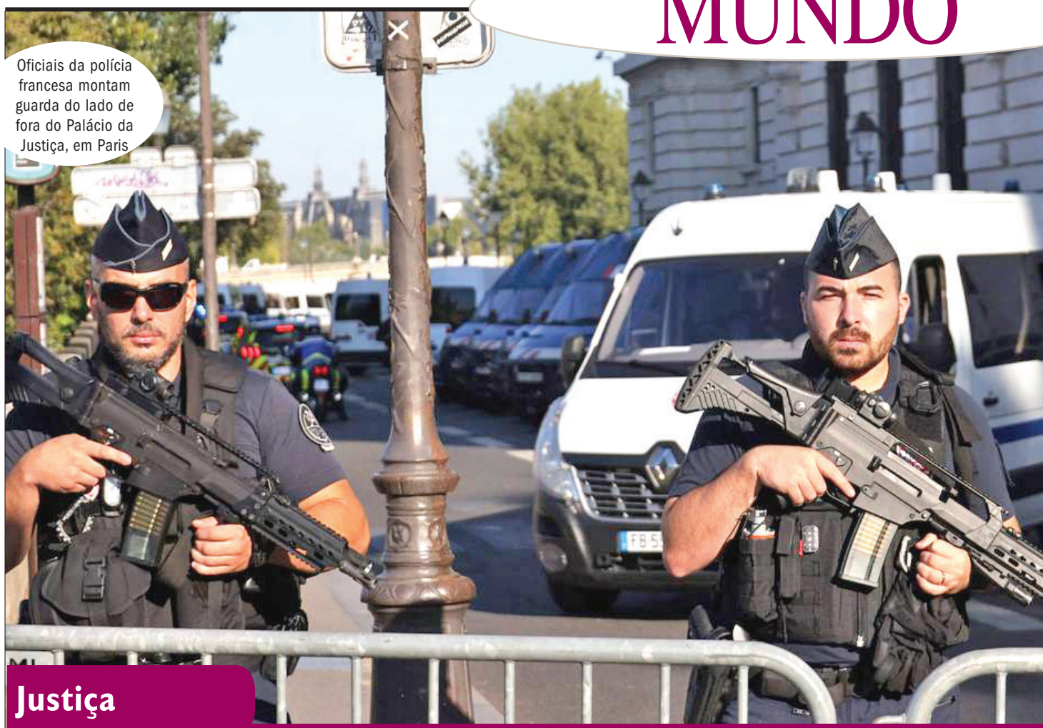
Oficiais da polícia francesa montam guarda do lado de fora do Palácio da Justiça, em Paris