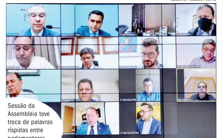
Sessão da Assembleia teve troca de palavras ríspidas entre parlamentares