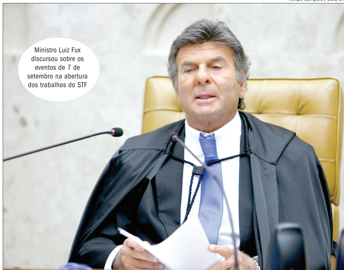
Ministro Luiz Fux discursou sobre os eventos de 7 de setembro na abertura dos trabalhos do STF

“Ofender a honra dos ministros, incitar a população a propagar discursos de ódio contra a instituição do Supremo Tribunal Federal e incitar o descumprimento de