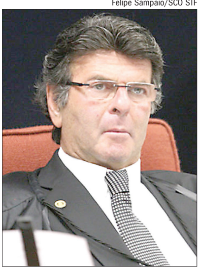
Felipe Sampaio/SCO STF