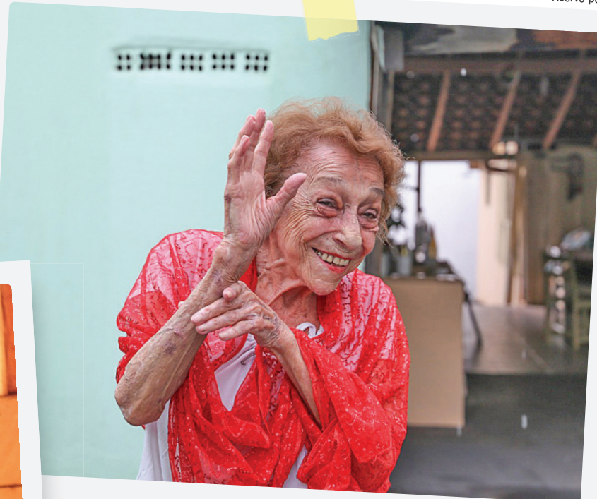
O sorriso fácil da ‘Dama do Rasqueado’