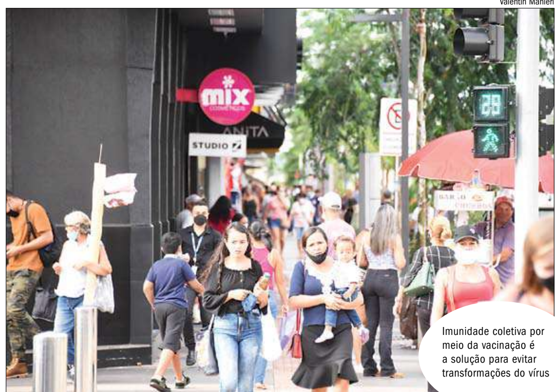
Imunidade coletiva por meio da vacinação é a solução para evitar transformações do vírus

houve uma mudança das linhagens ao longo do tempo, sendo que a partir de 2021 a linhagem P.1 passou a ser a mais predominante", diz o relatório feito em parceria pela UFMS (Universidade Federal de Mato Grosso do Sul), e FioCruz (Fundação Oswaldo Cruz) e Lacen (Laboratório Central).