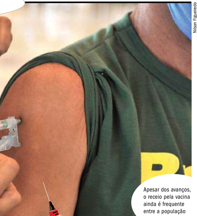
Apesar dos avanços, o receio pela vacina ainda é frequente entre a população