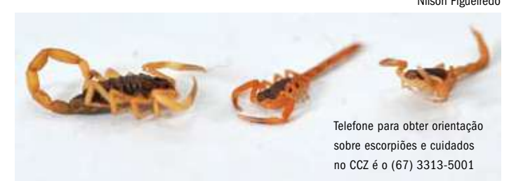
Telefone para obter orientação sobre escorpiões e cuidados no CCZ é o (67) 3313-5001