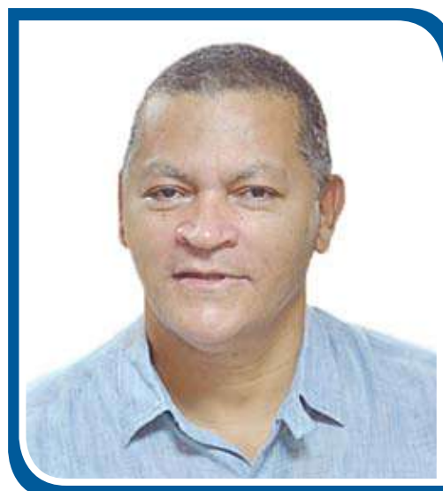
Jornalista e Professor

Então, não espere mais. Mude agora seu jeito de ser e de agir. Reflita sobre seus atos e ações que não são bem vistos não só pelo cônjuge como também por outros membros da sociedade e procure mudar. Dê um passo de cada vez. Se espelhe em Cristo. E ao homem,