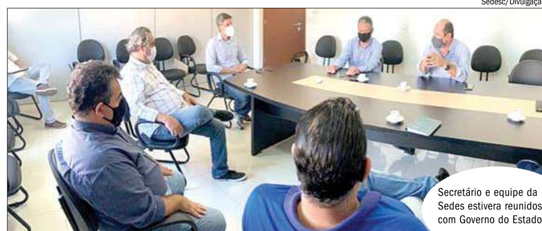
Secretário e equipe da Sedesc estiveram reunidos com Governo do Estado

"Todo projeto público que venha agregar benefícios à vida dos campo-grandenses a Sedesc