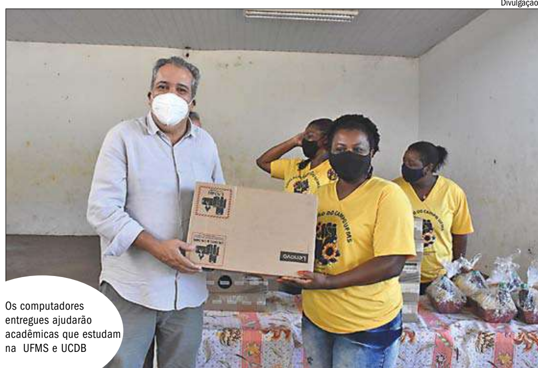
Os computadores entregues ajudarão acadêmicas que estudam na UFMS e UCDB