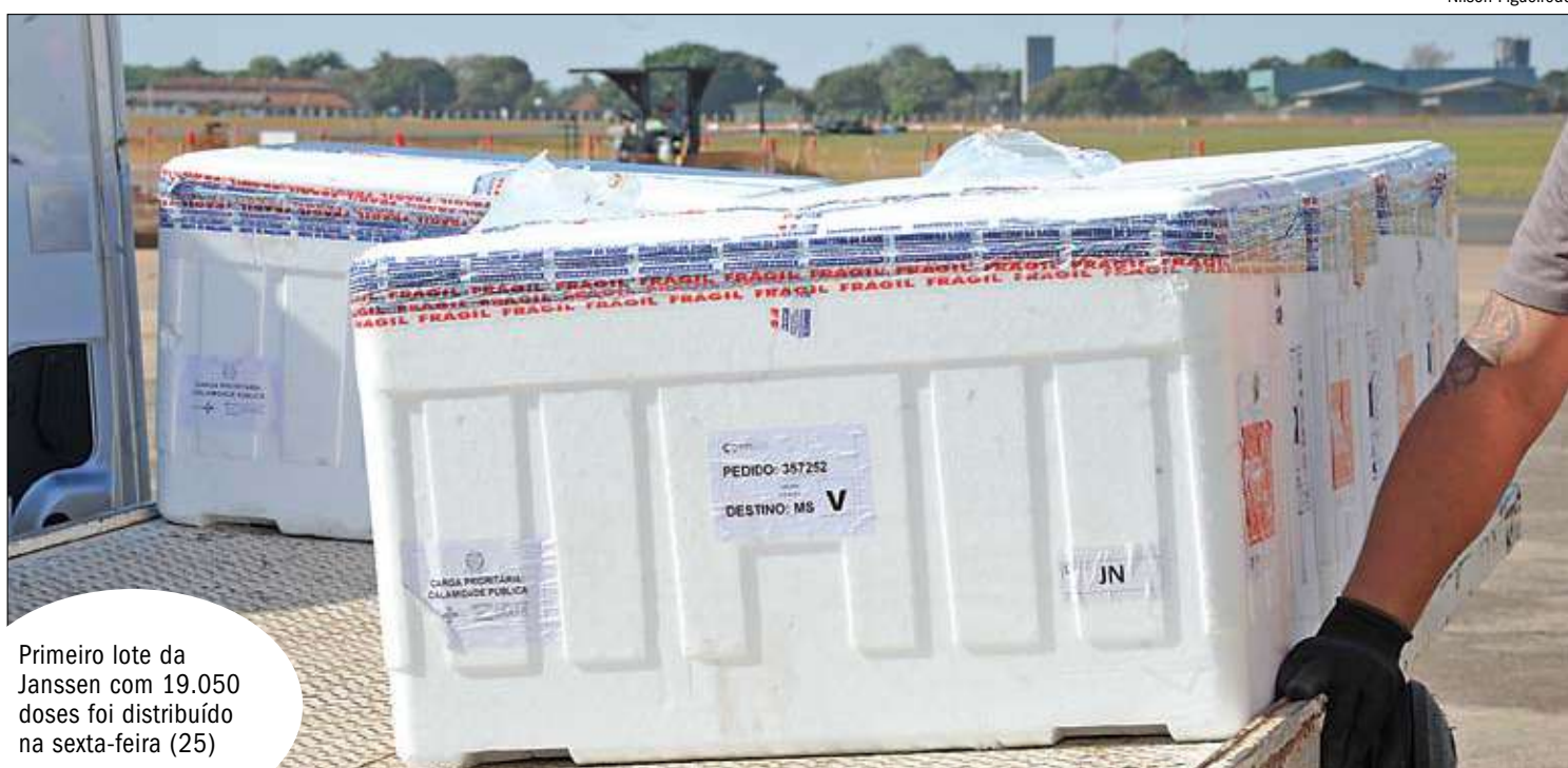
Primeiro lote da Janssen com 19.050 doses foi distribuído na sexta-feira (25)

Esse lote faz parte do primeiro carregamento da Janssen recebido pelo Brasil. Ao todo, os Estados Unidos encaminhou 1,5 milhão de doses, das 3 milhões que estavam previstas para chegar neste mês. Vale ressaltar que essa vacina é de dose única.