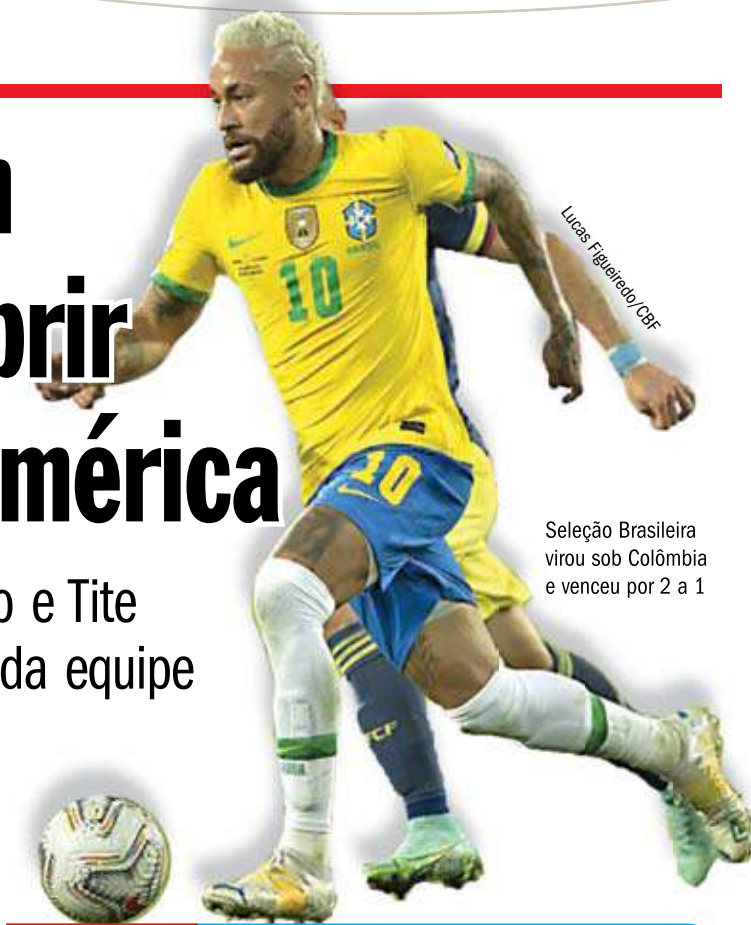
Seleção Brasileira virou sob Colômbia e venceu por 2 a 1