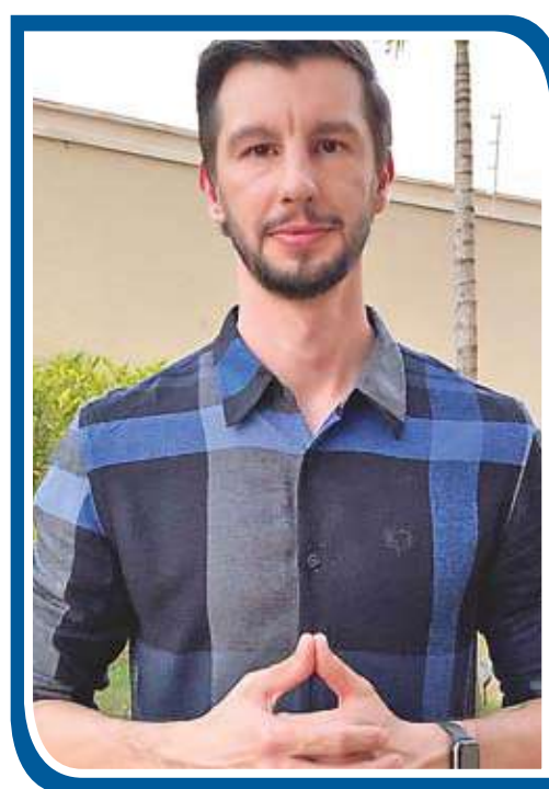
Hunter de Inovação do Sicredi e atua na área de Open Baking & Inovação da instituição financeira cooperativa

Esse trabalho colaborativo tem demonstrado que, para avançarmos nesta jornada, precisamos superar tanto barreiras culturais como estruturais. Por isso, é fundamental a cooperação dos agentes da cadeia do agro para auxiliar os pequenos e médios produtores na transição para o digital. Sem