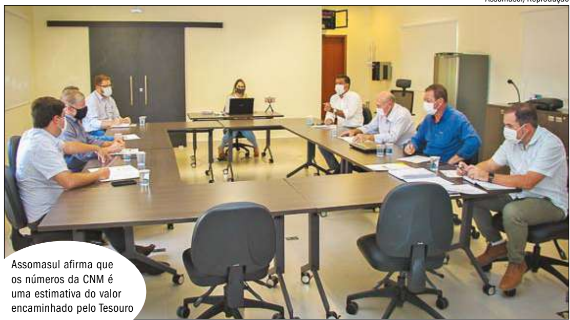
Assomasul afirma que os números da CNM é uma estimativa do valor encaminhado pelo Tesouro

A tabela divulgada pela CNM possui projeções e cálculos do FPM por estado e coeficiente. Consta os valores brutos do repasse do 1% FPM e o seu respectivo desconto 1% do Pasp. O indicativo é que Mato Grosso do Sul pode receber em valor bruto do decêndio aproximadamente R$ 74.022.006,21. Na tabela, o Estado também tem o indicativo de R$ 740.220,06 do Pasp e R$ 73.281.786,15 de valor líquido do decêndio.