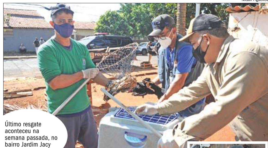
Último resgate aconteceu na semana passada, no bairro Jardim Jaci

Cada denúncia exige trabalho da polícia, já que uma equipe se desloca para verificar a procedência da reclamação. “Conseqüentemente a demanda e o serviço policial também aumentaram. Para todas as denúncias que chegam é disparada uma equipe de investigação para ir até o local”, disse.